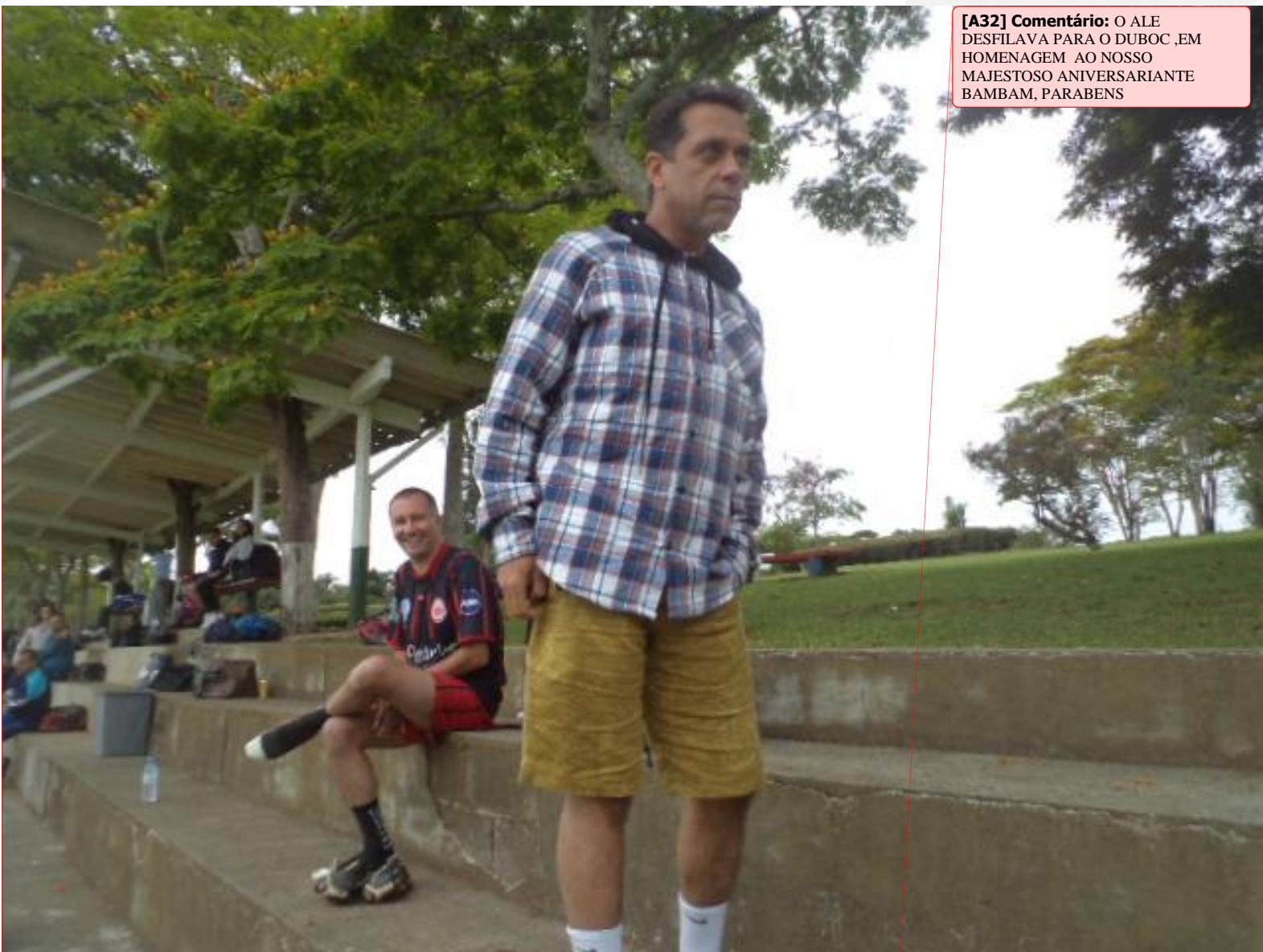
[A32] Comentário: O ALE DESFILAVA PARA O DUBOC ,EM HOMENAGEM AO NOSSO MAJESTOSO ANIVERSARIANTE BAMBAM, PARABENS