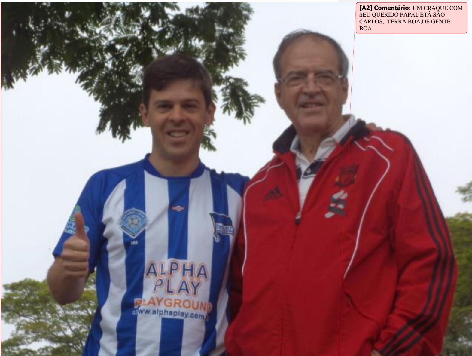
[A2] Comentário: UM CRAQUE COM SEU QUERIDO PAPAI, ETÁ SÃO CARLOS, TERRA BOA,DE GENTE BOA