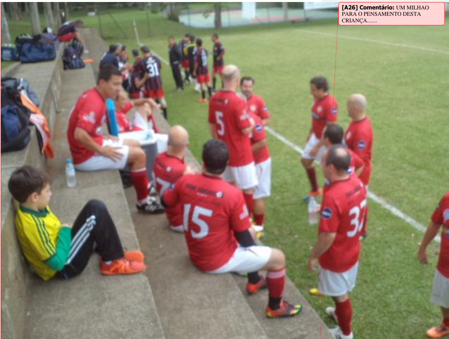
[A26] Comentário: UM MILHAO PARA O PENSAMENTO DESTA CRIANÇA.....