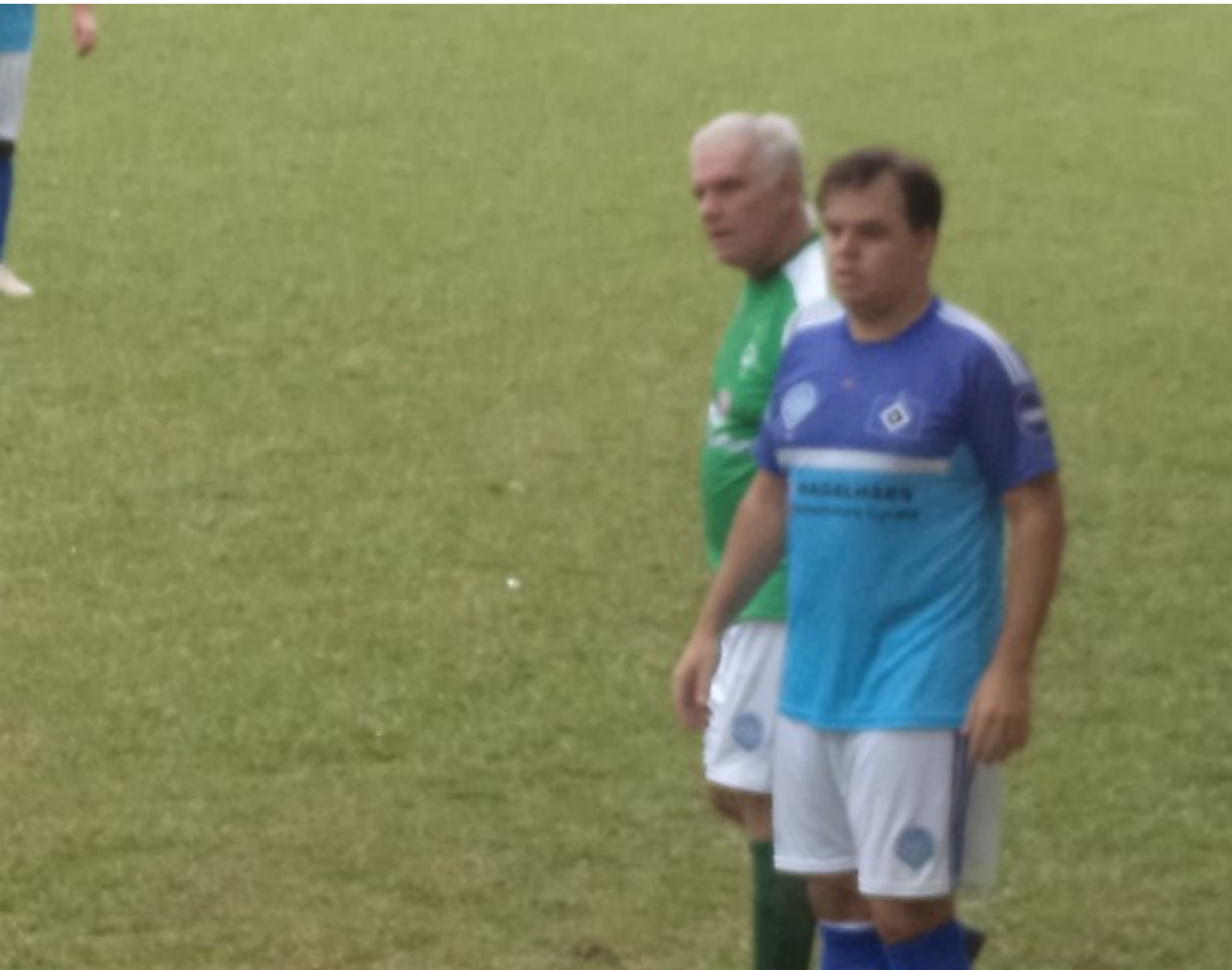
Não desgruda do Marcão