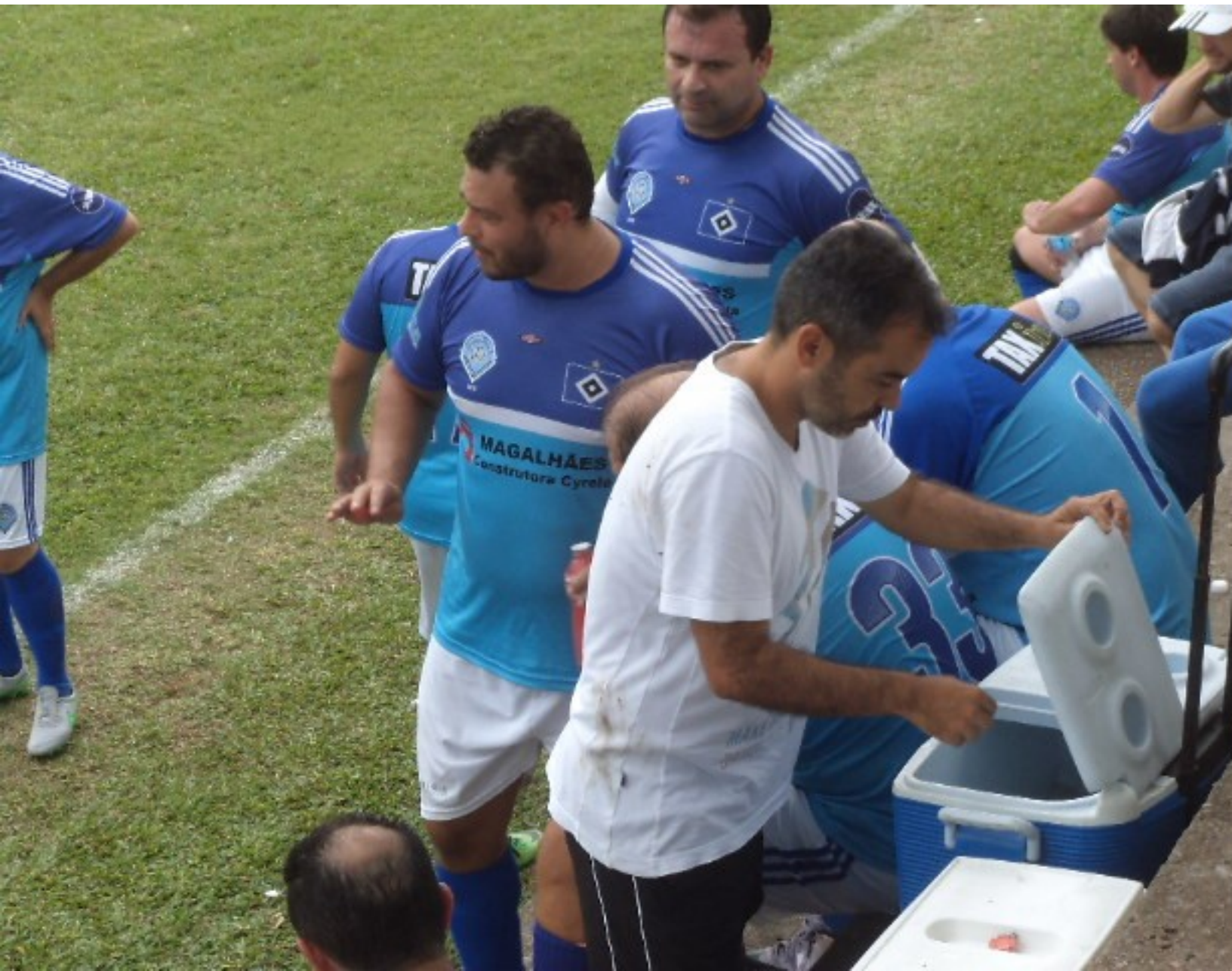
Taborda procurando um gatorade, será???