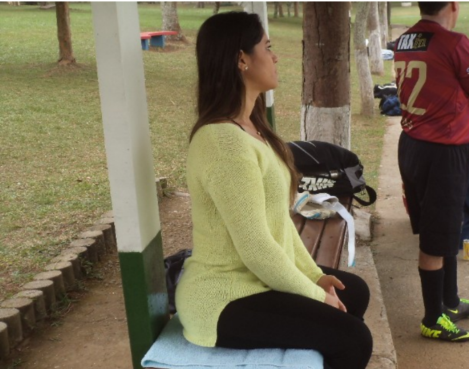
ACHEO ERRO NESTA FOTO.....O VILAS