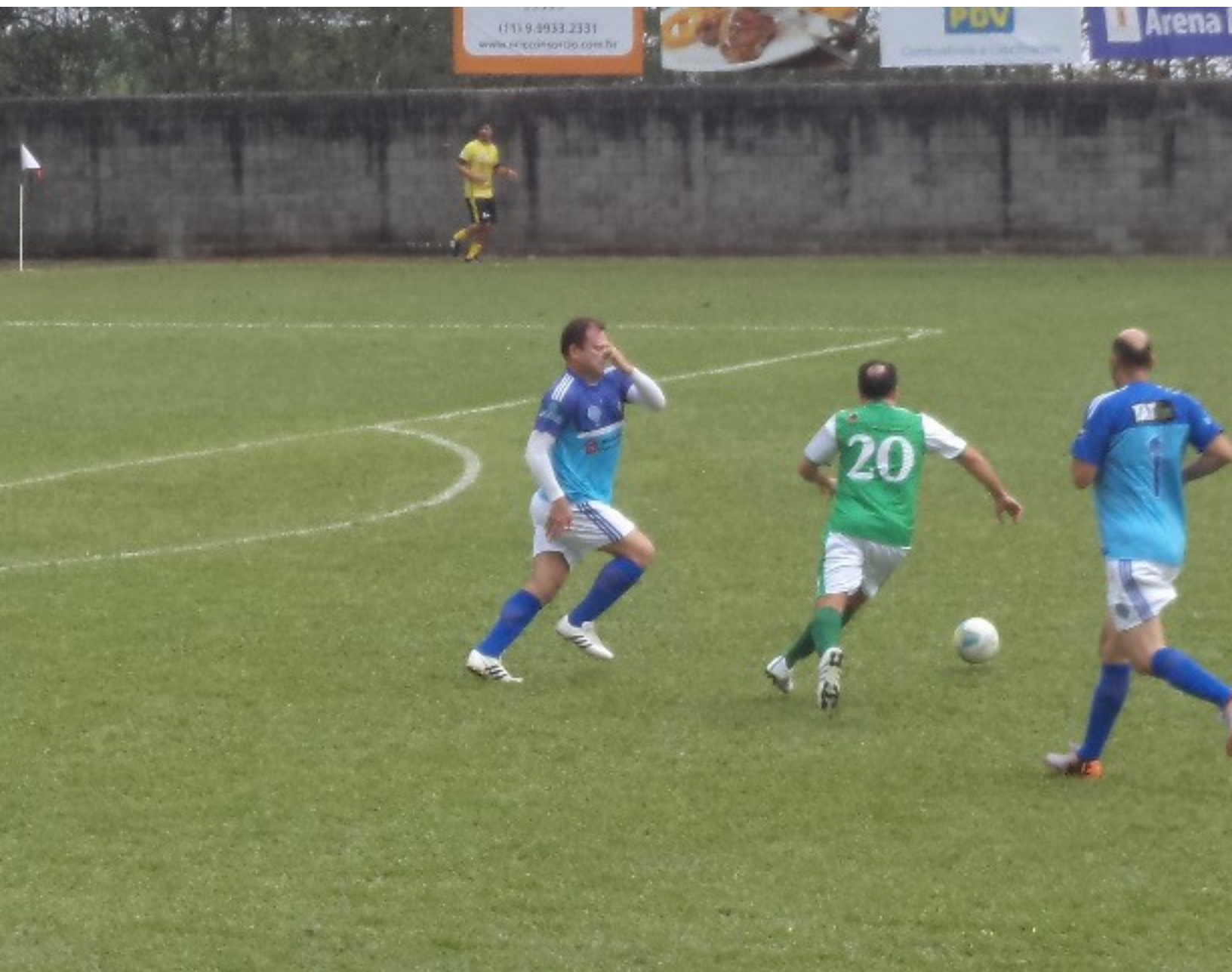
Jogada do Vulcano, jogou bem esse menino