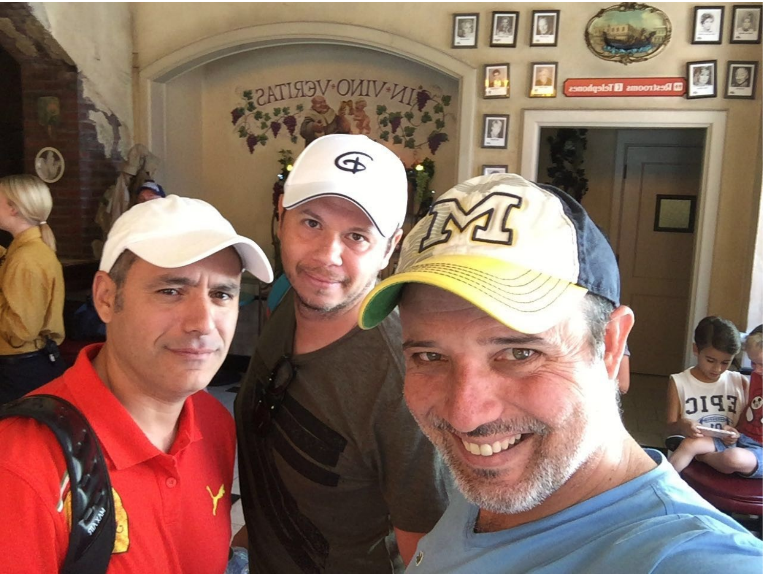
SAUDADES DOS AMIGOS !!!!!