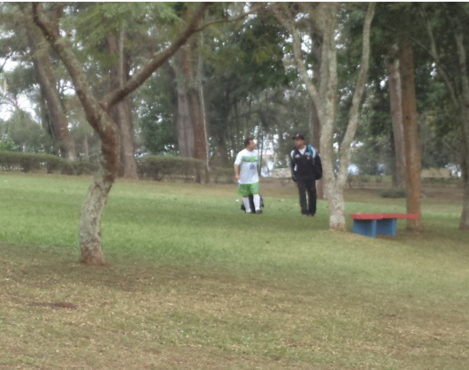
AEROPORTO, LOS ANGELES PARK