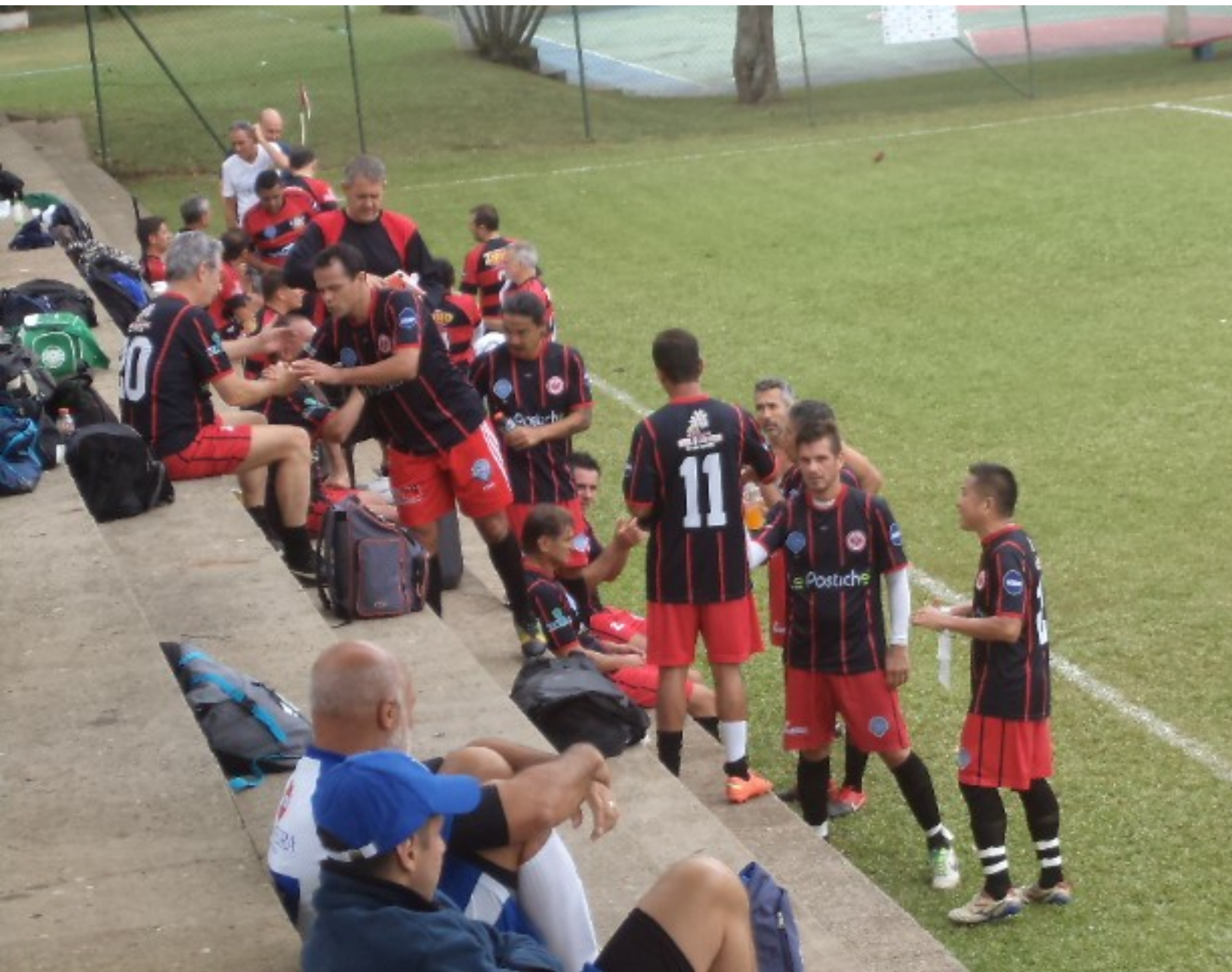
O Cesar não parece muito feliz