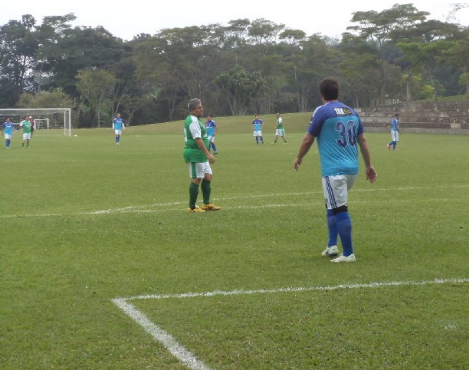
Duelo de “gordinhos”