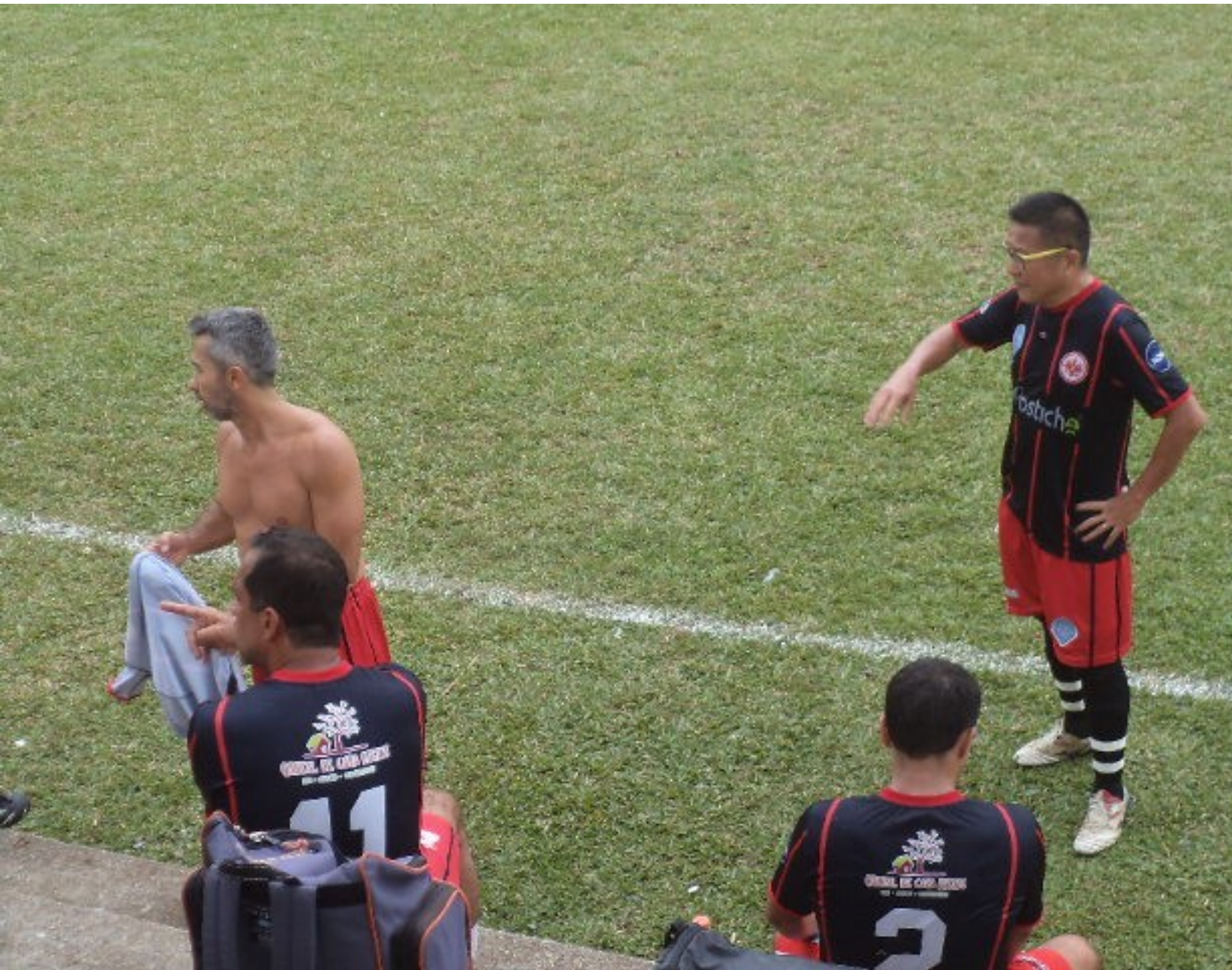
O Kurata não entende