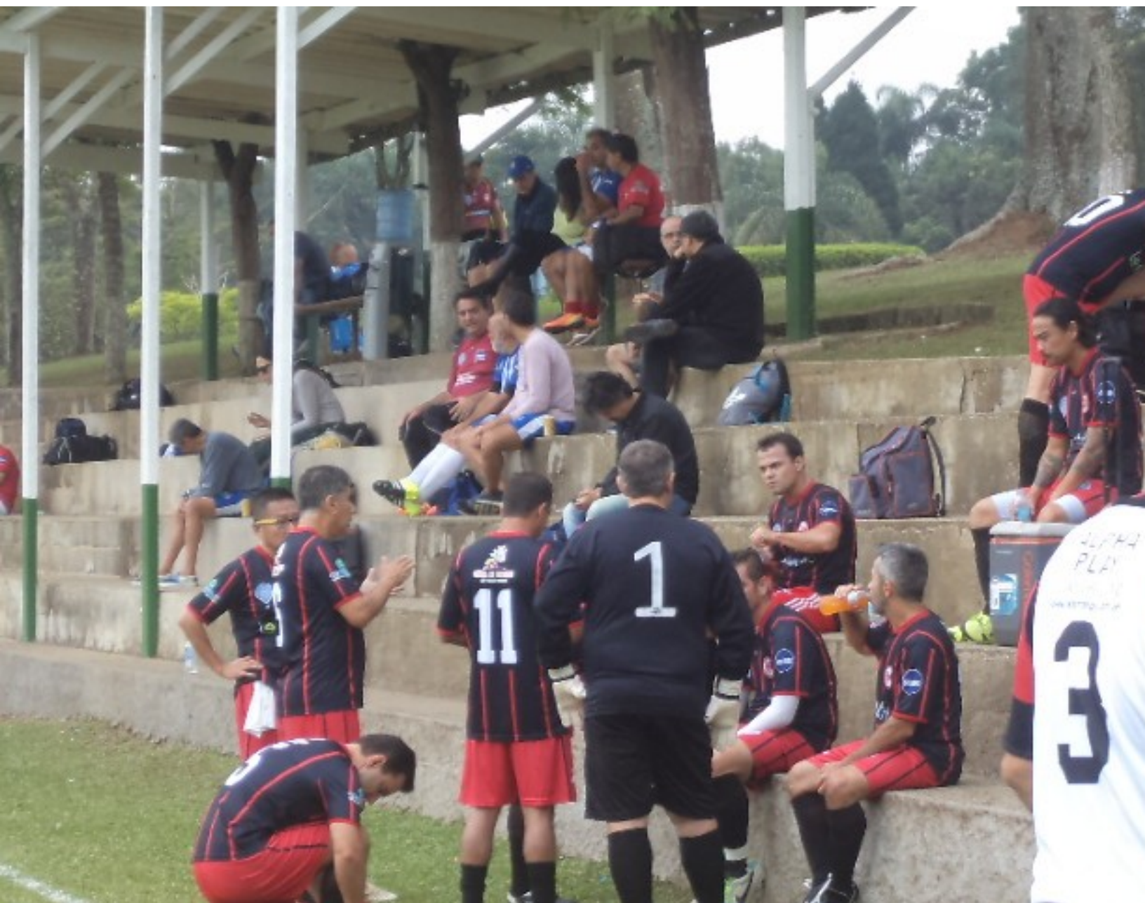
Mais resenha no intervalo