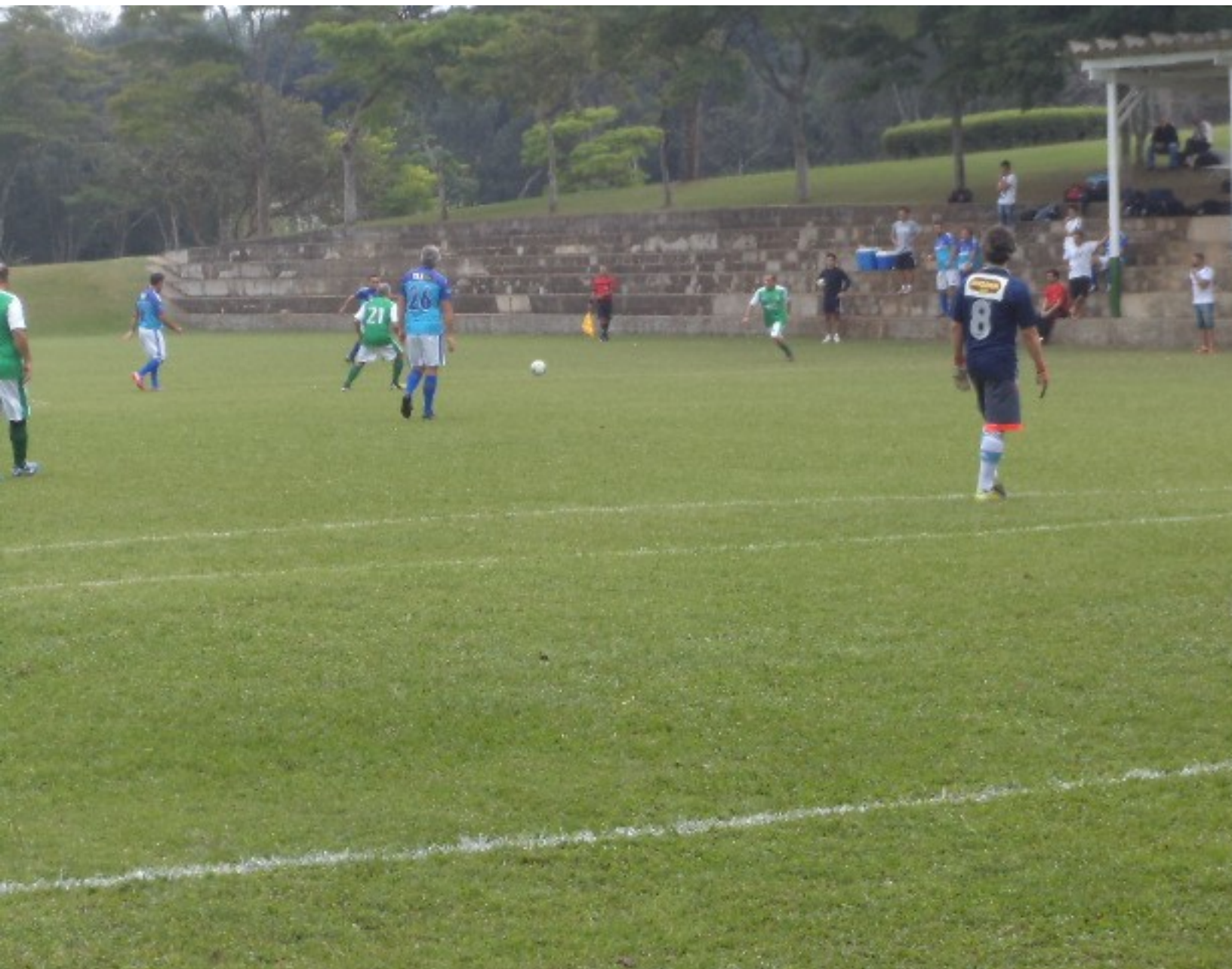
O jogo tava pegado