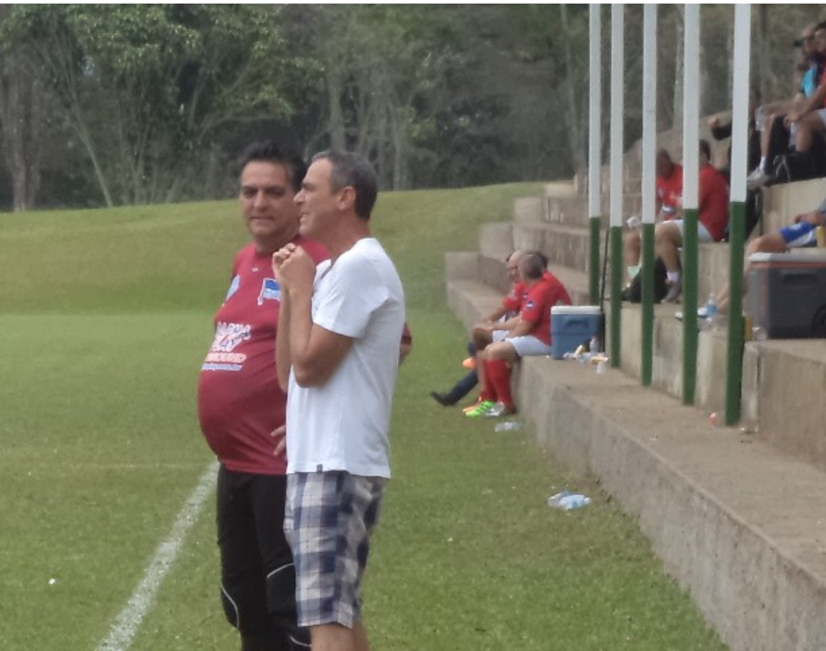
Confidências entre “guarda-metas” ora pá!!!