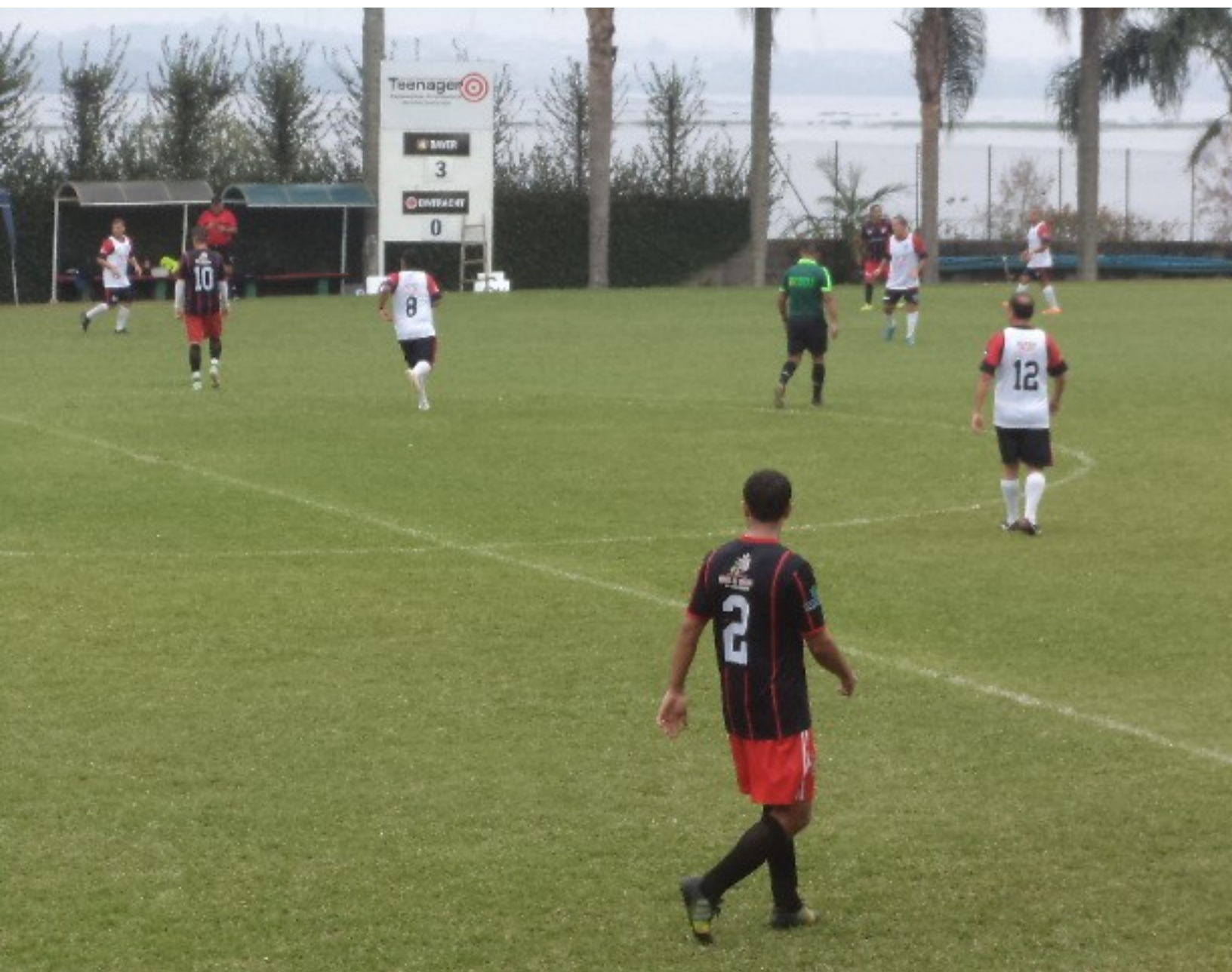
O jogo continua pegado