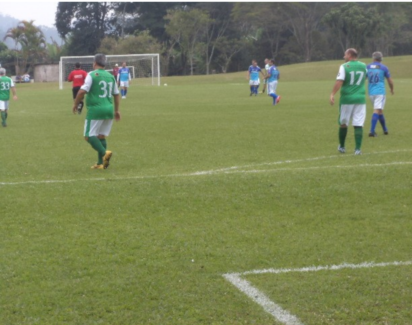
Linha defensiva de peso essa do Werder