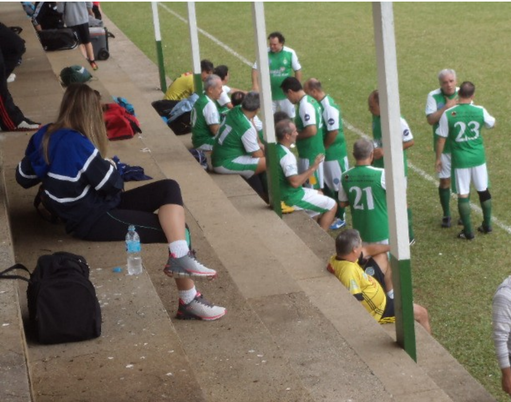
O Werder veio em peso