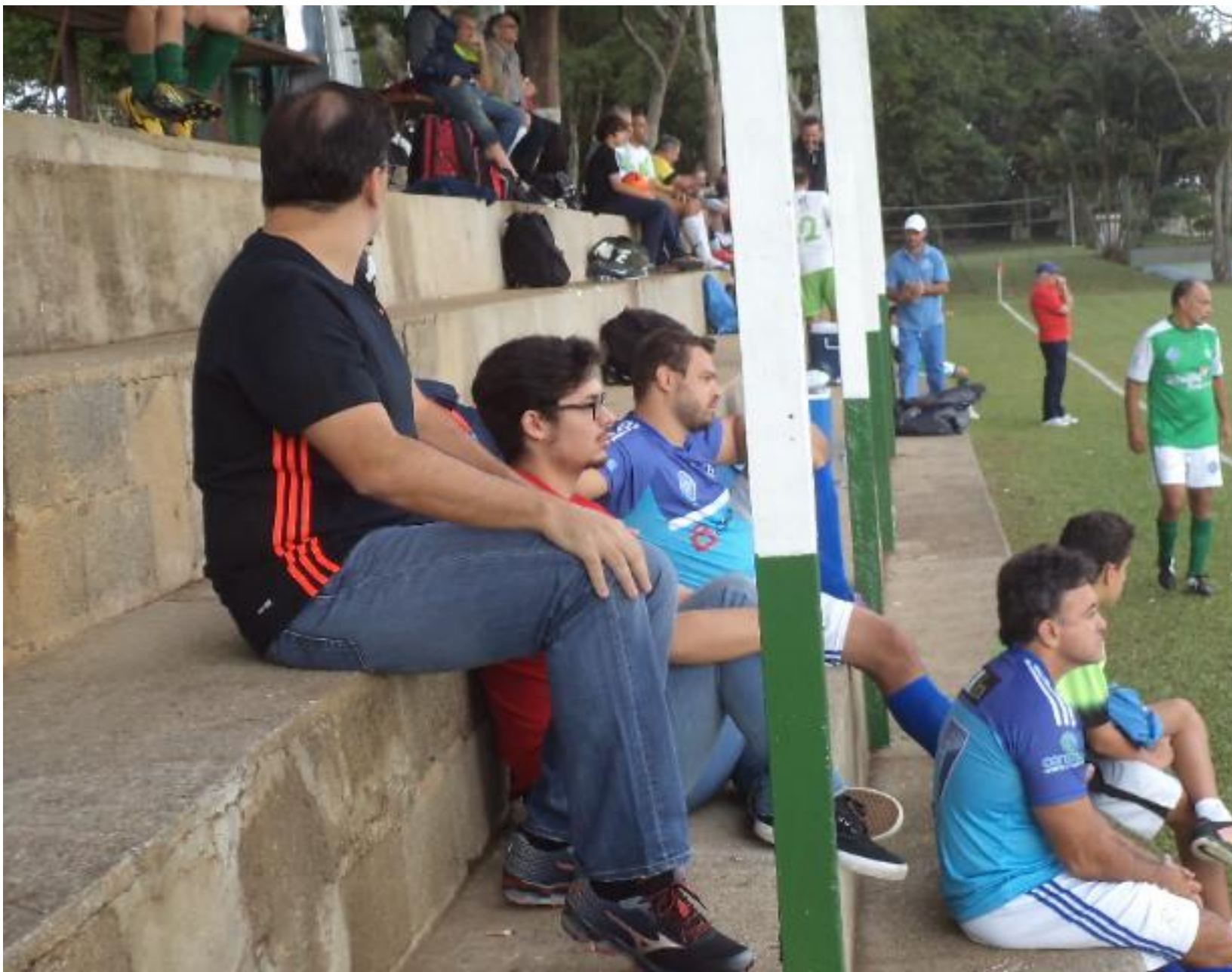
Todo mundo prestando atenção, jogo difícil