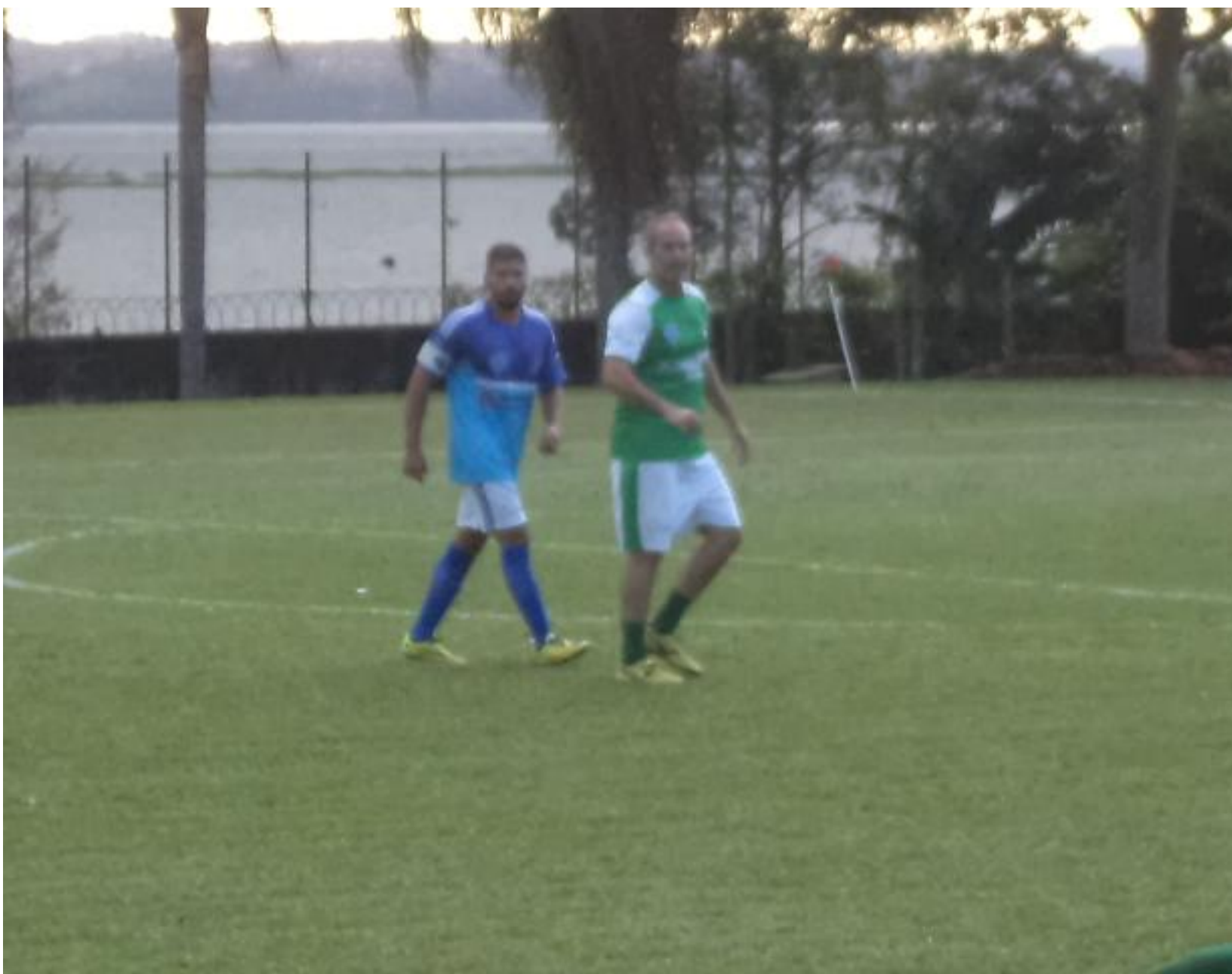
O Luigi voltou, tentou, insistiu, mas não deu certo