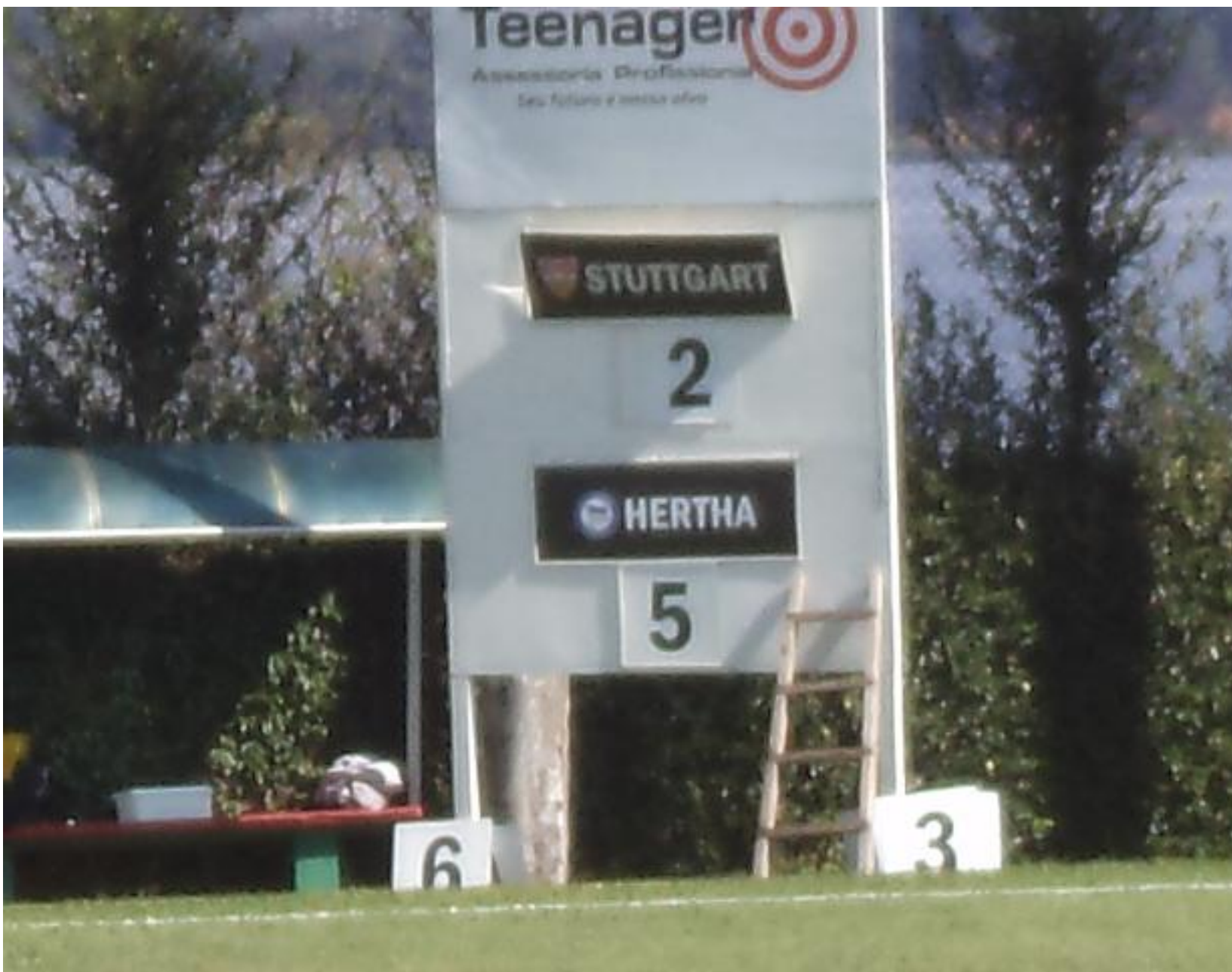
Final com superioridade do Hertha