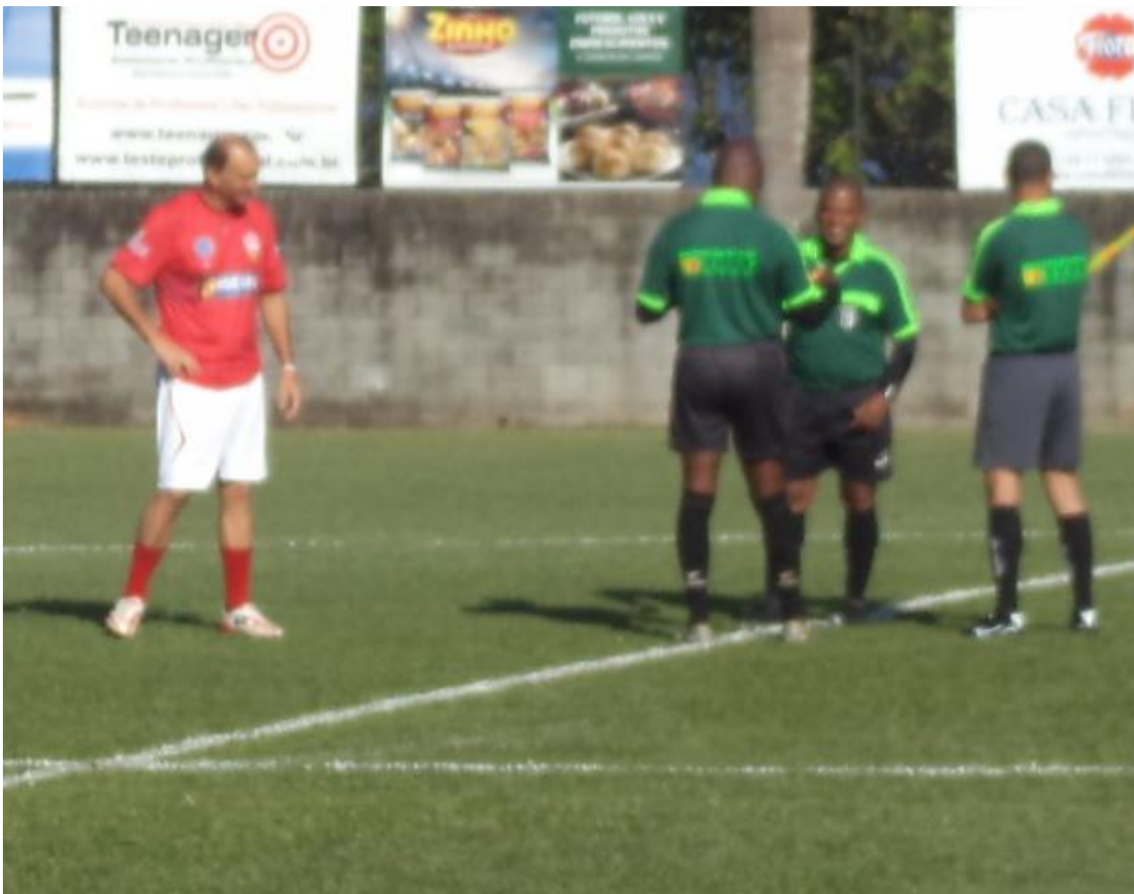
Parece que o papo tava bom.