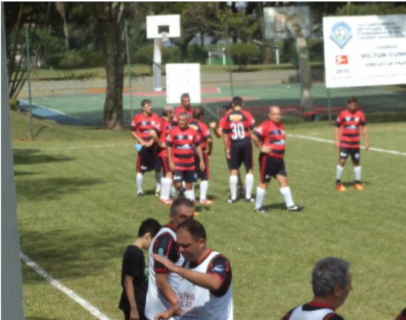
Do outro lado, camisas bem parecidas do Bayern.