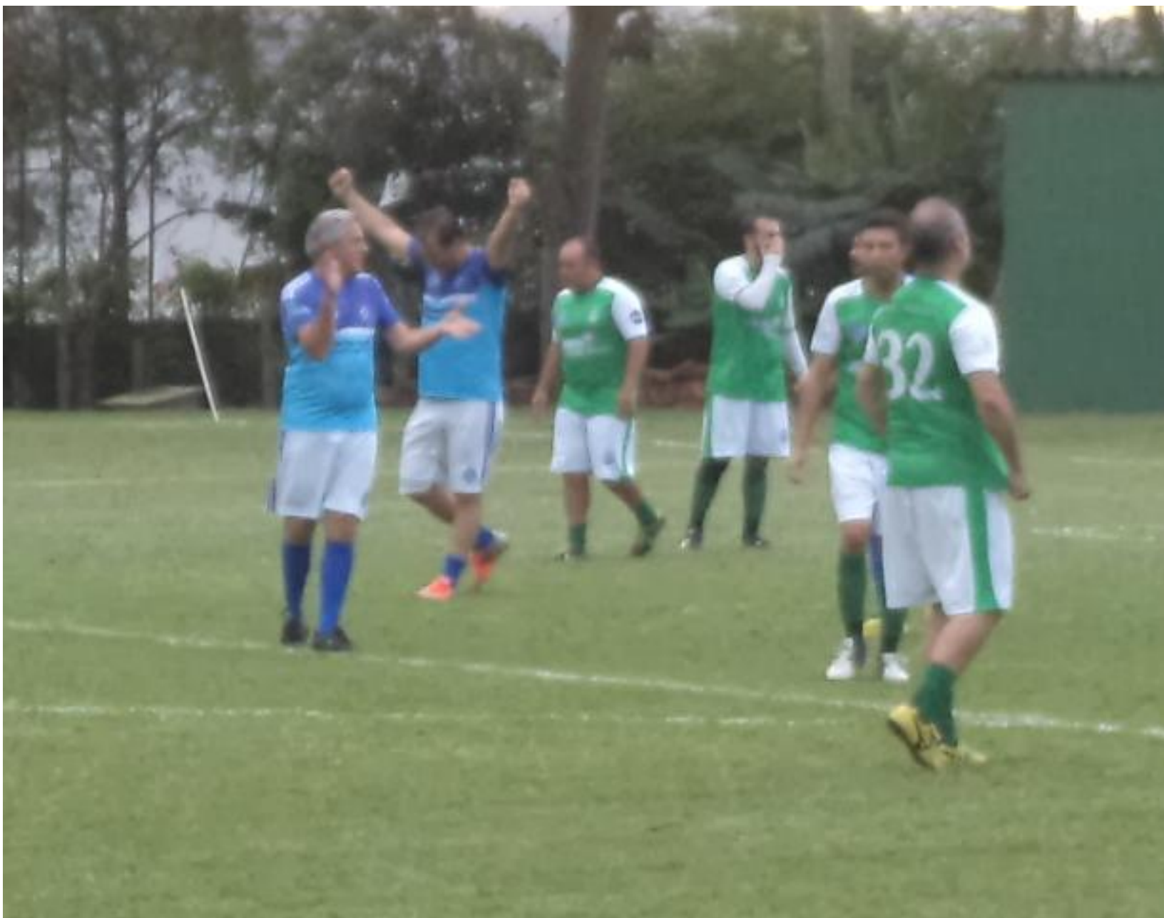
Vitória no final