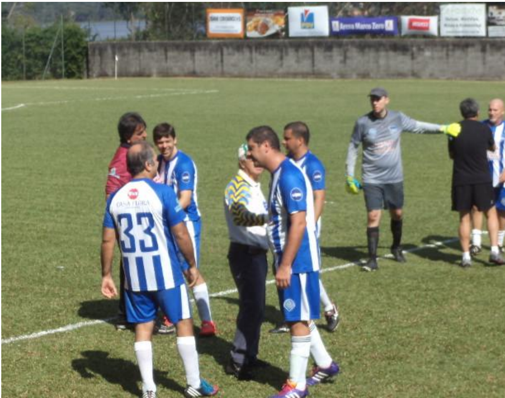
Fim de jogo, festa azul