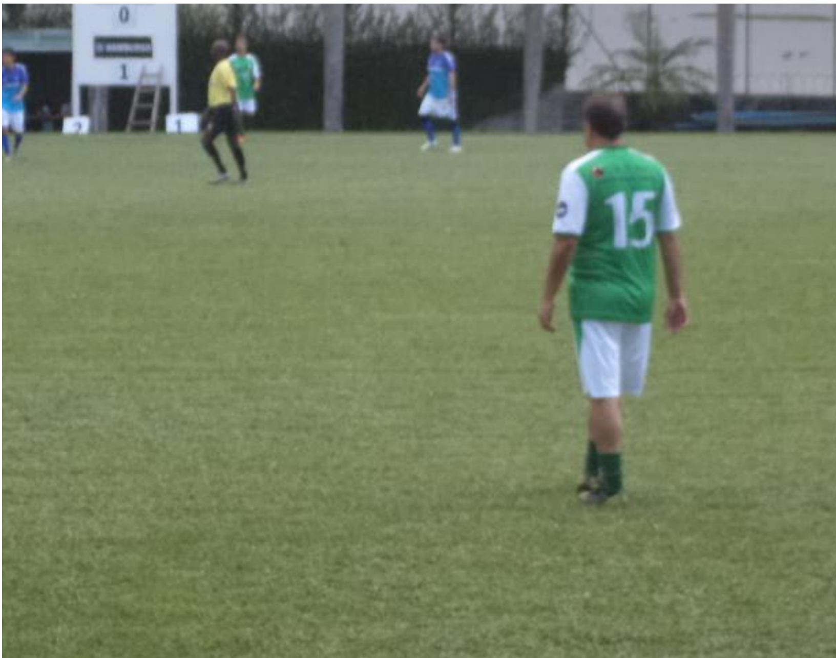
O Mariano entrou