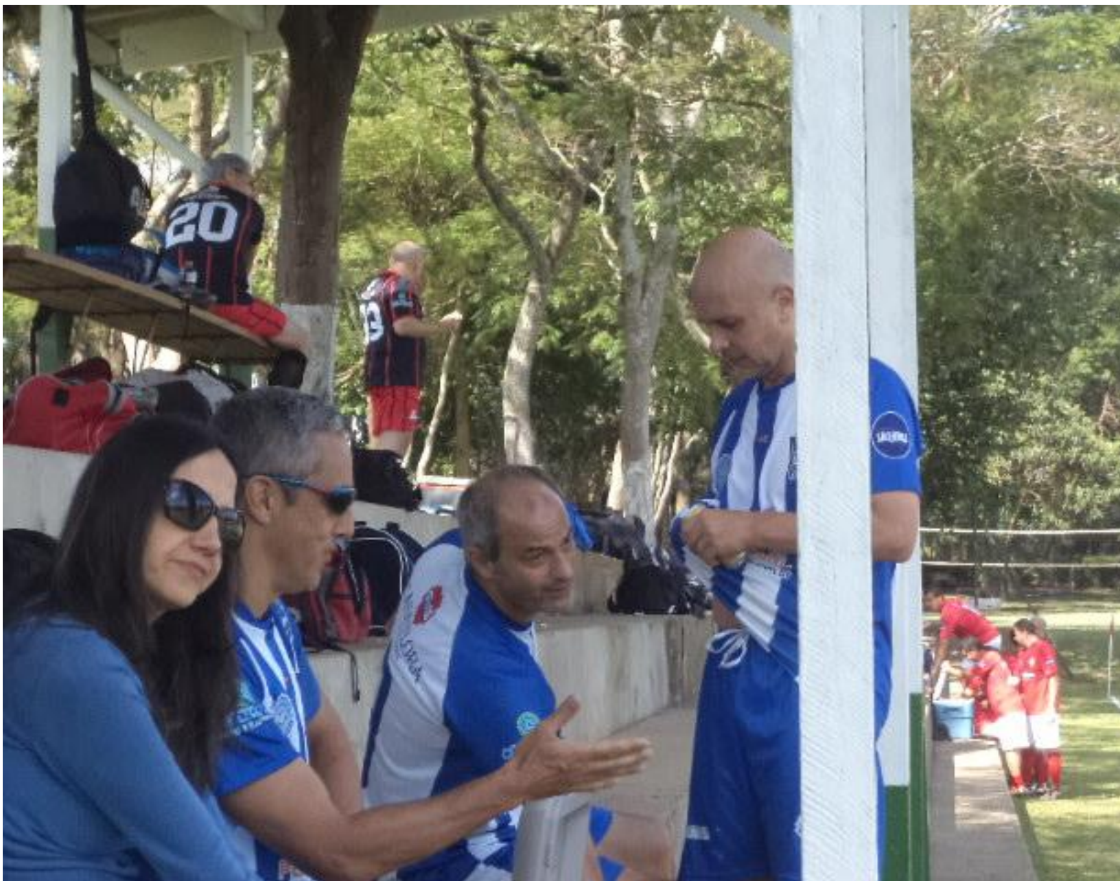
O Dadá levou a digníssima, para dar sorte. E deu.