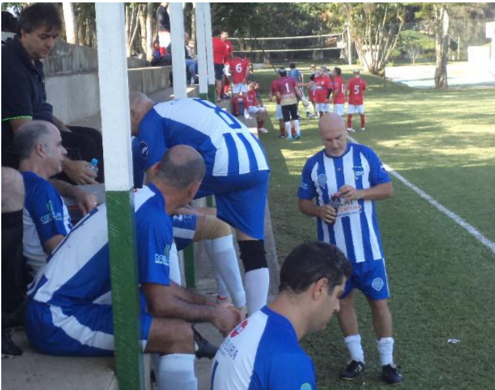
Muita concentração na parada técnica