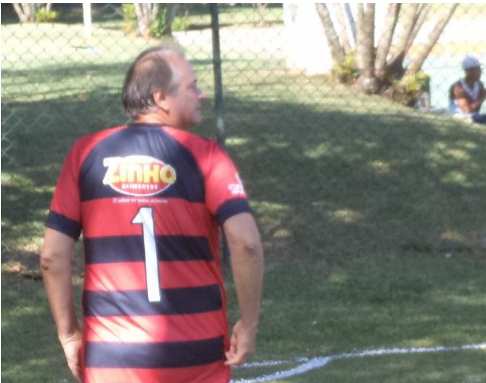
Fogassa desfilando o talento na linha