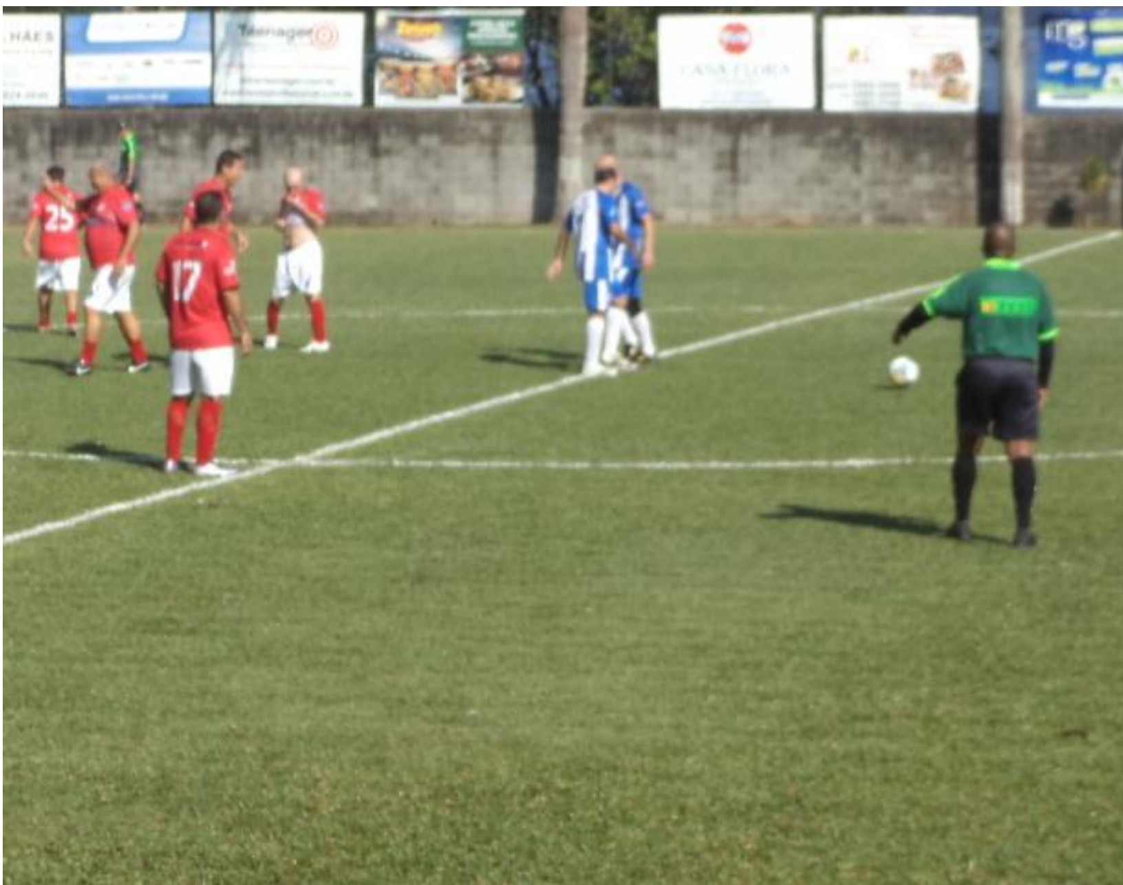
Será que essa foto foi depois do gol do Dunga?