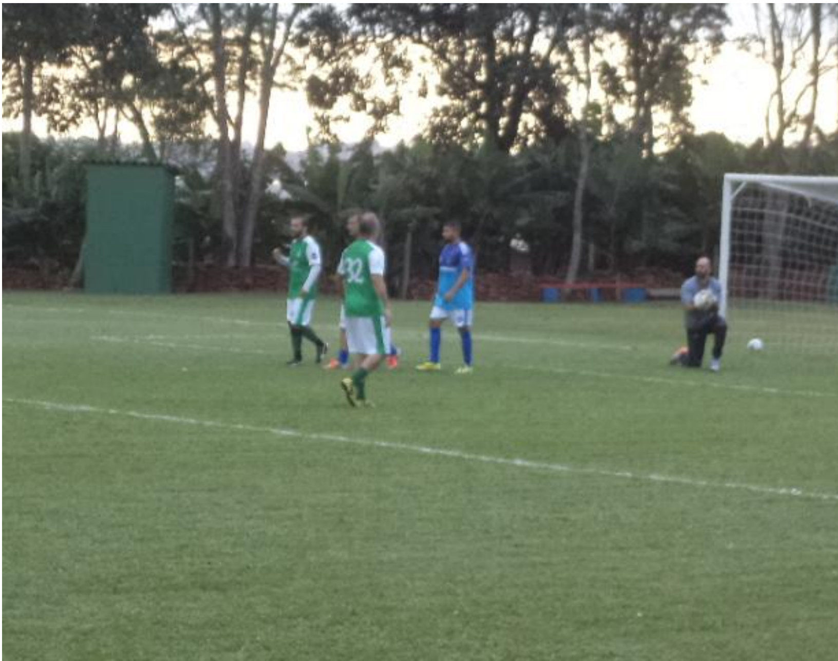
É difícil quando o dia é do goleiro