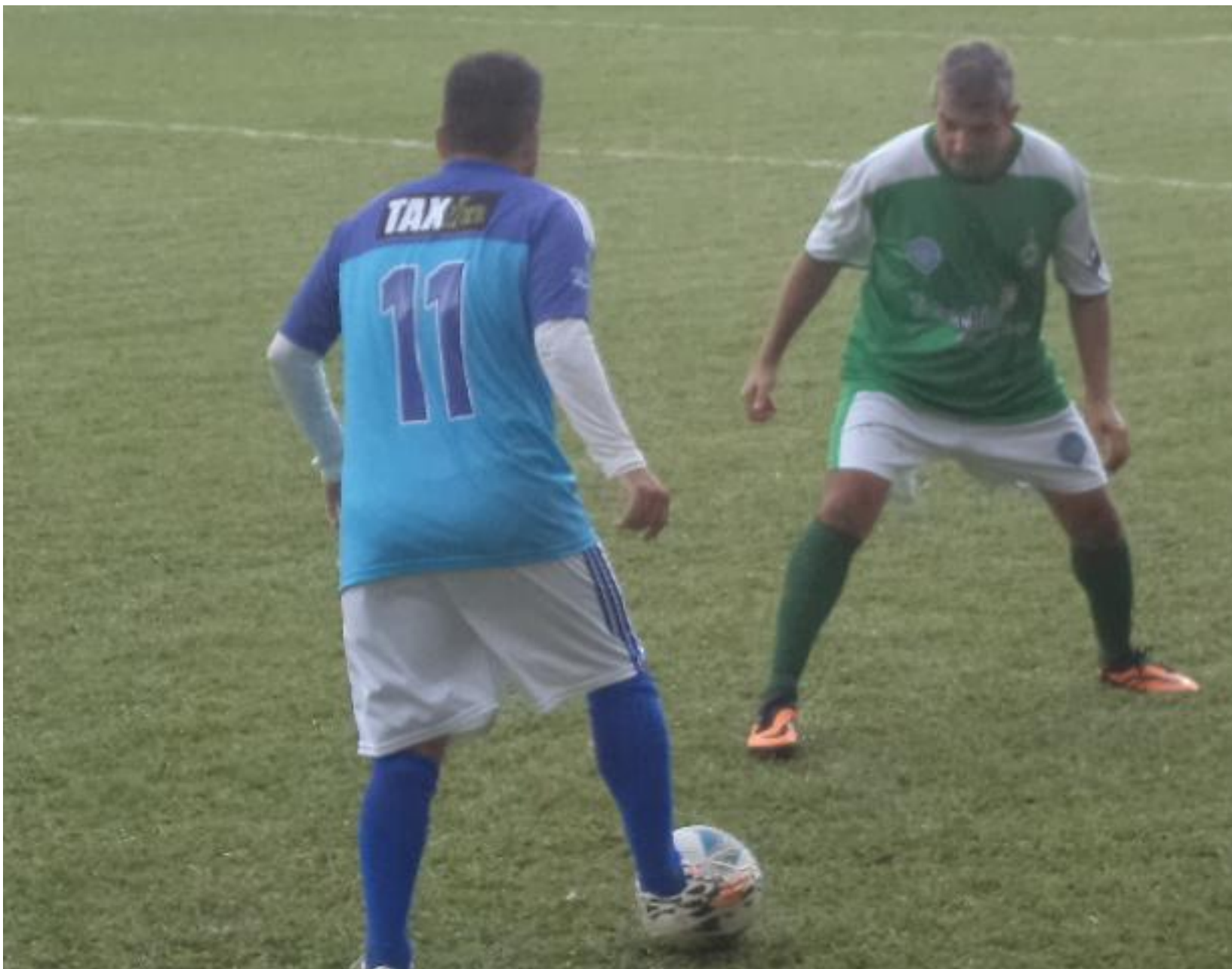
Foi um duelo constante onde o Taborda levou a melhor e fez o gol.