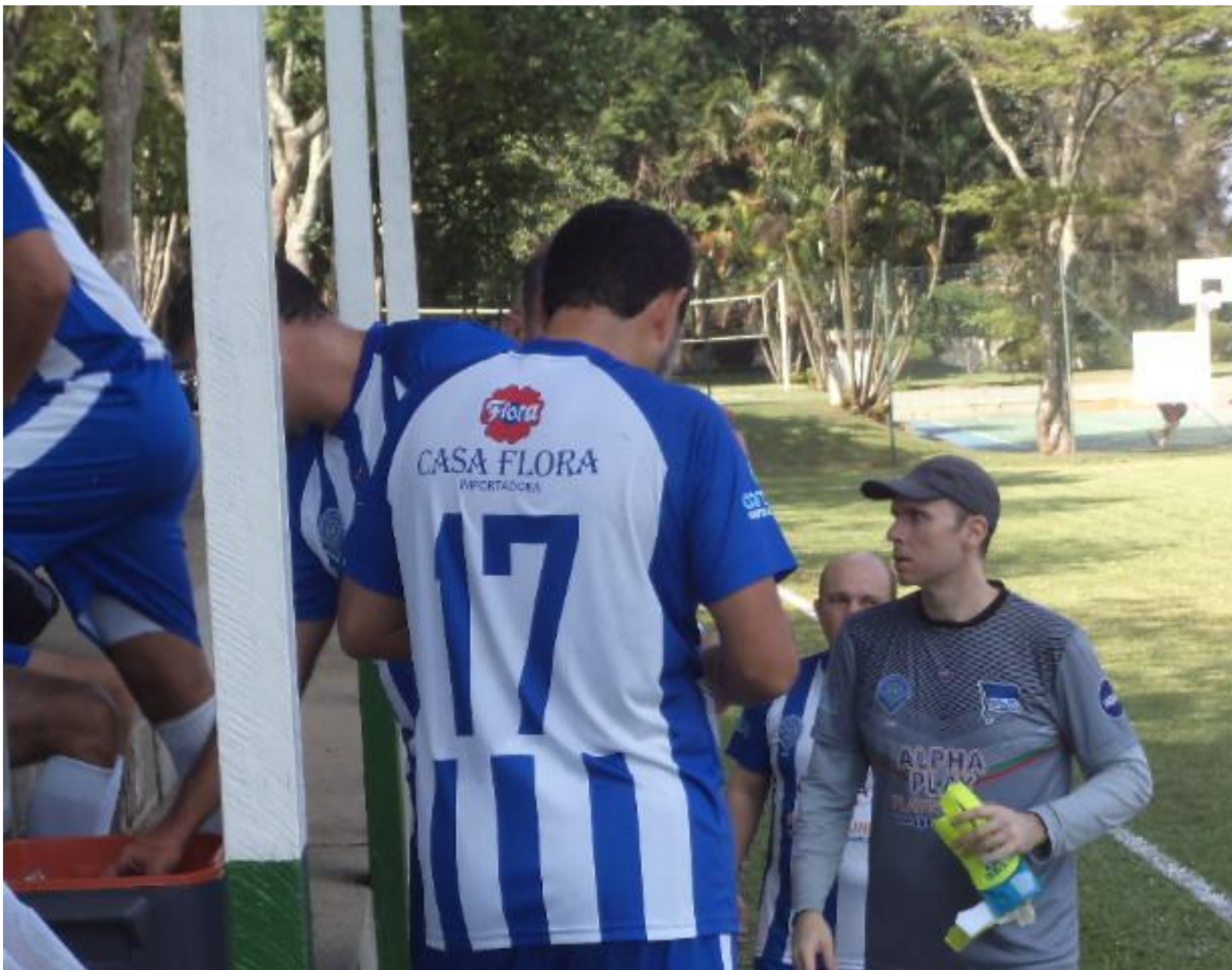
Calma que vai ter churrasco