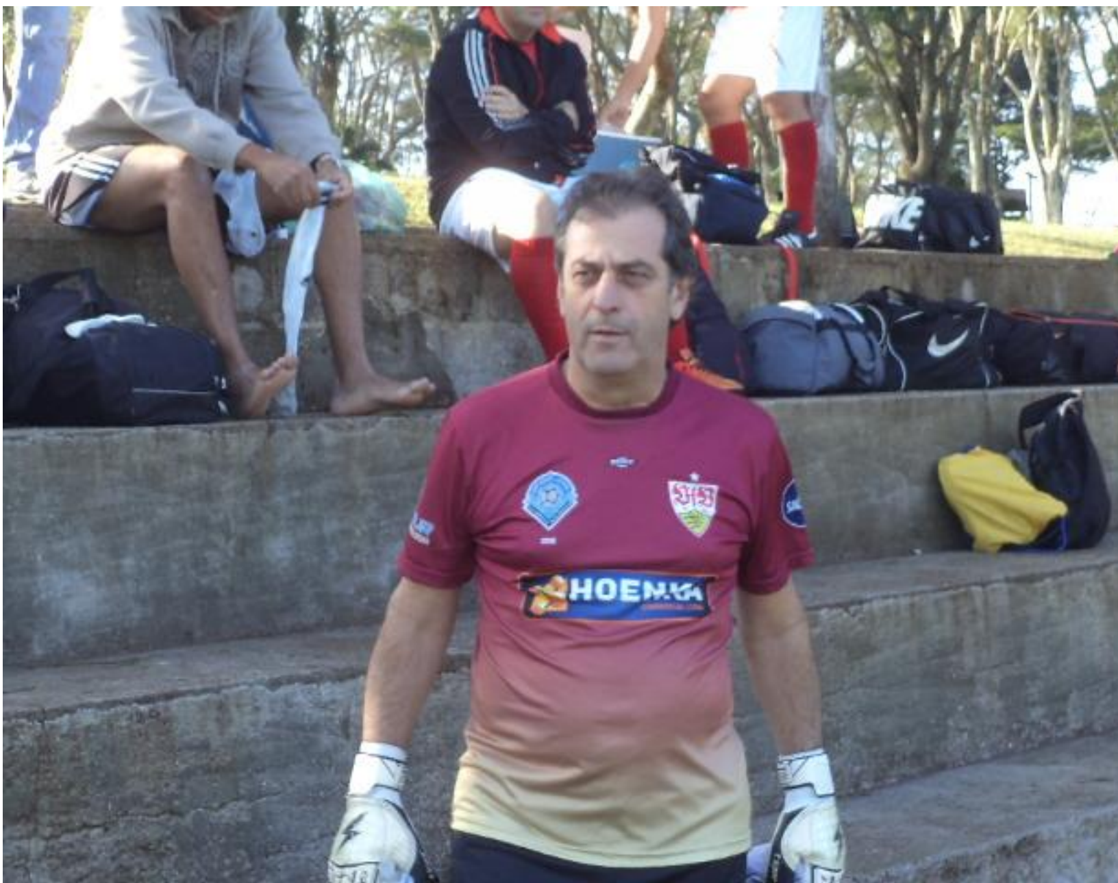
Ronaldão não gostou do resultado