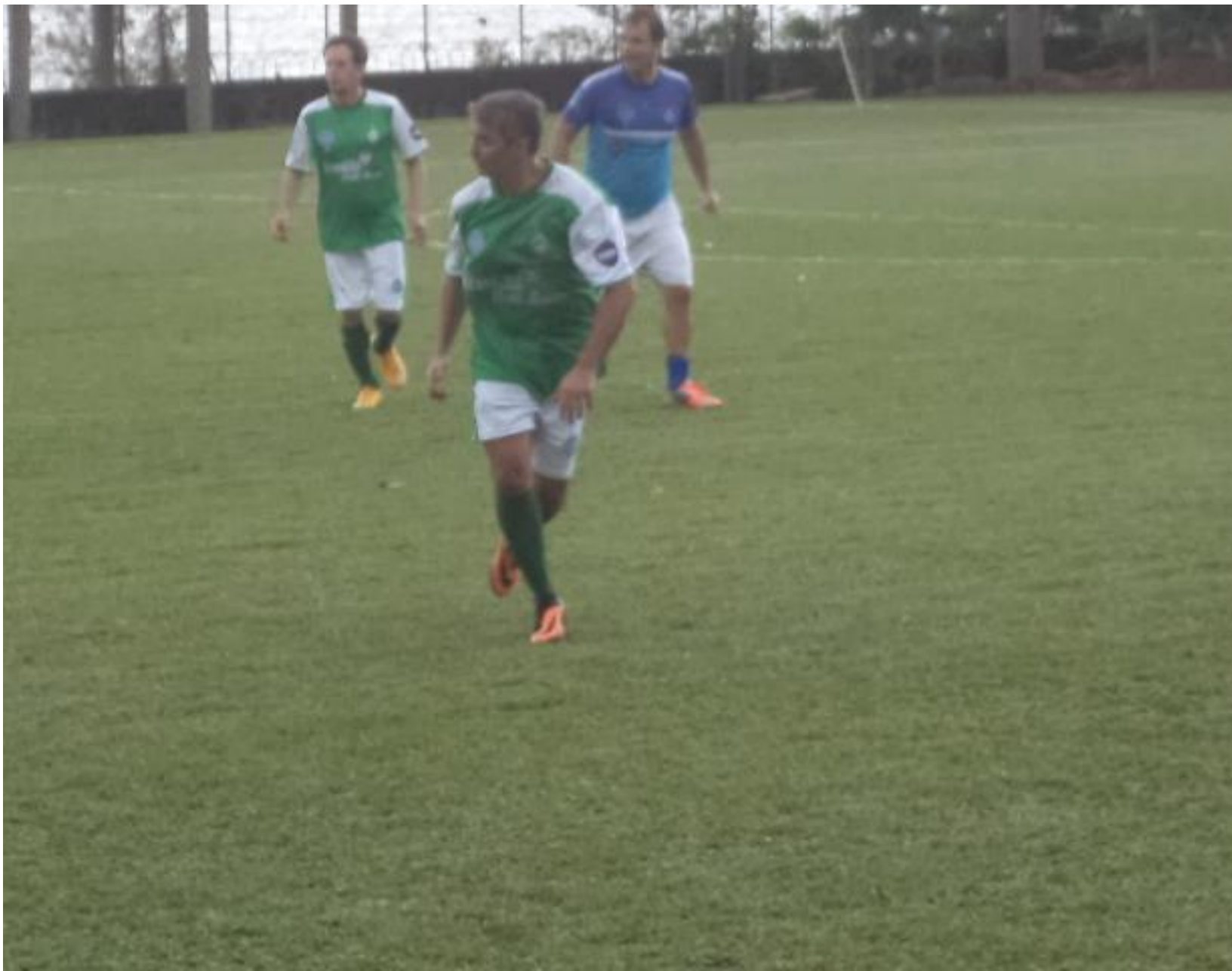
Ele se esforçou