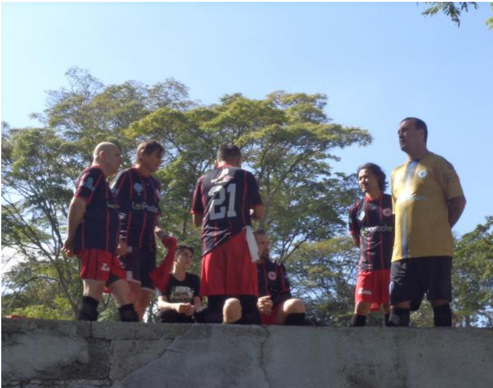
Todo mundo prestando atenção na preleção.