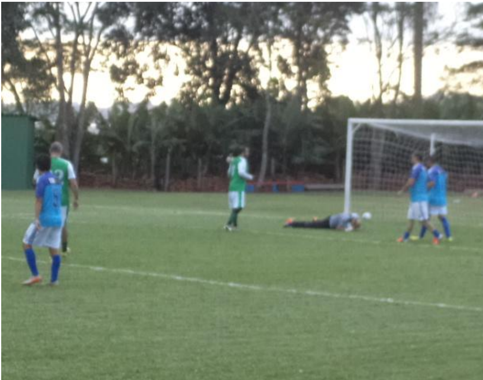
O Alessandro parava todas as tentativas