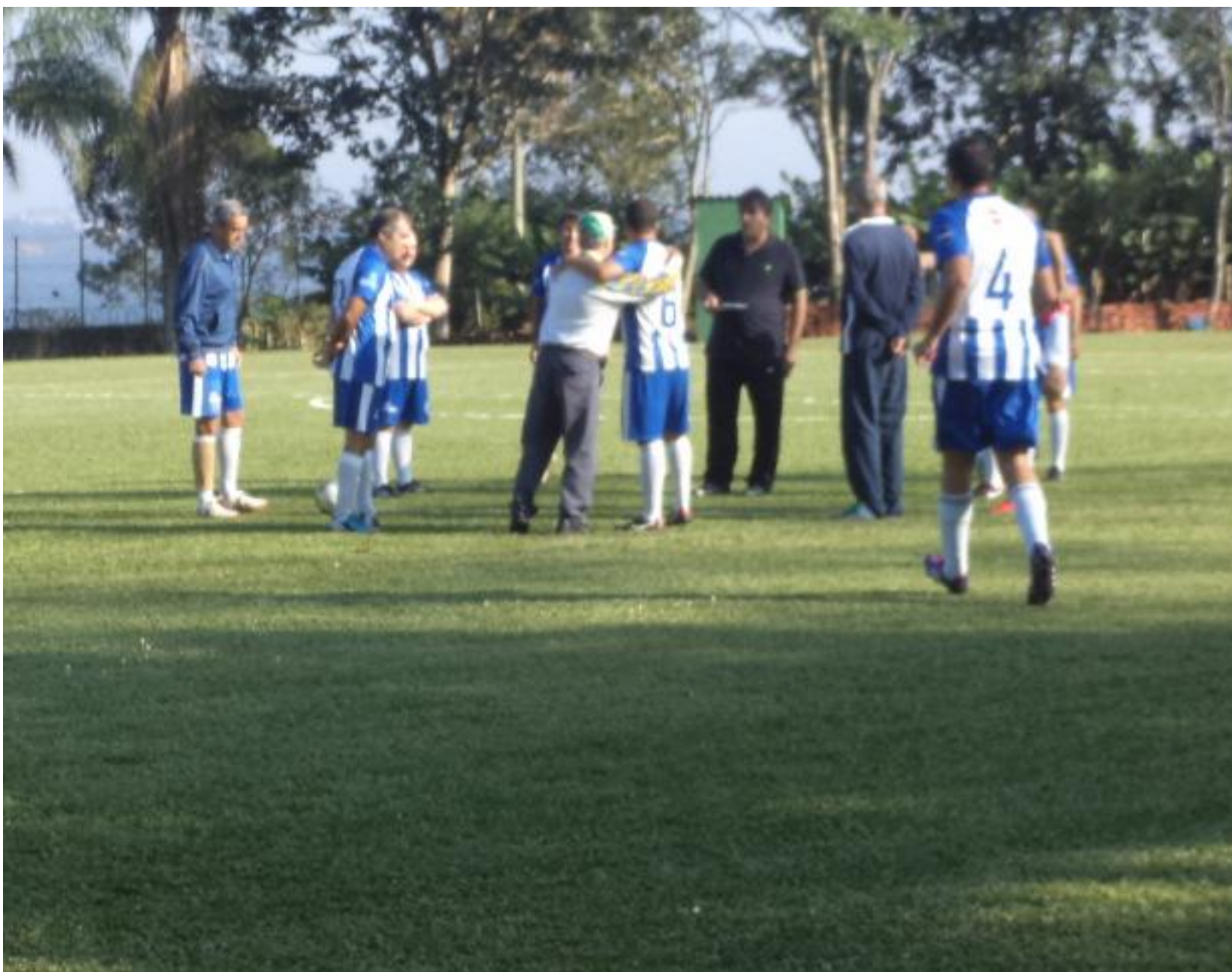
O Dadá com cara de sono e com frio pelo jeito.