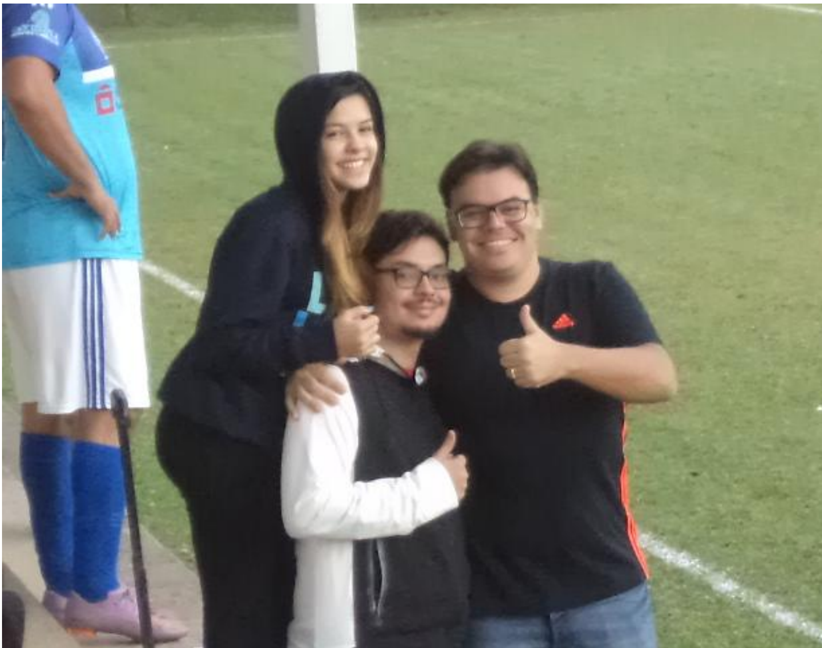
Bela família Mario, parabéns.