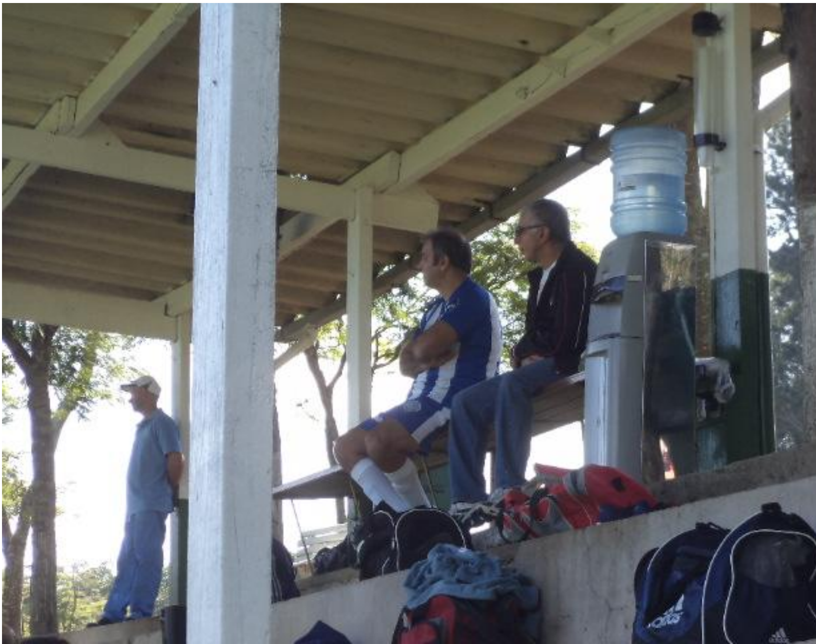
Presidente atento a tudo.