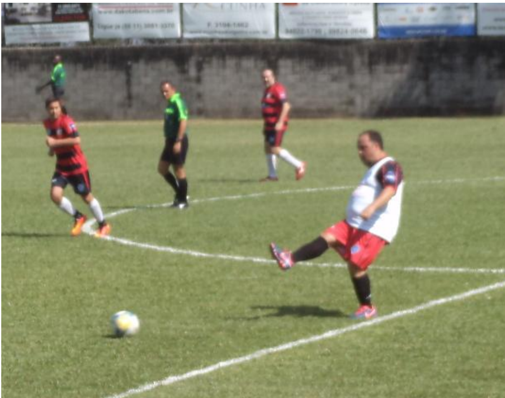
O menino tava dominando o meio