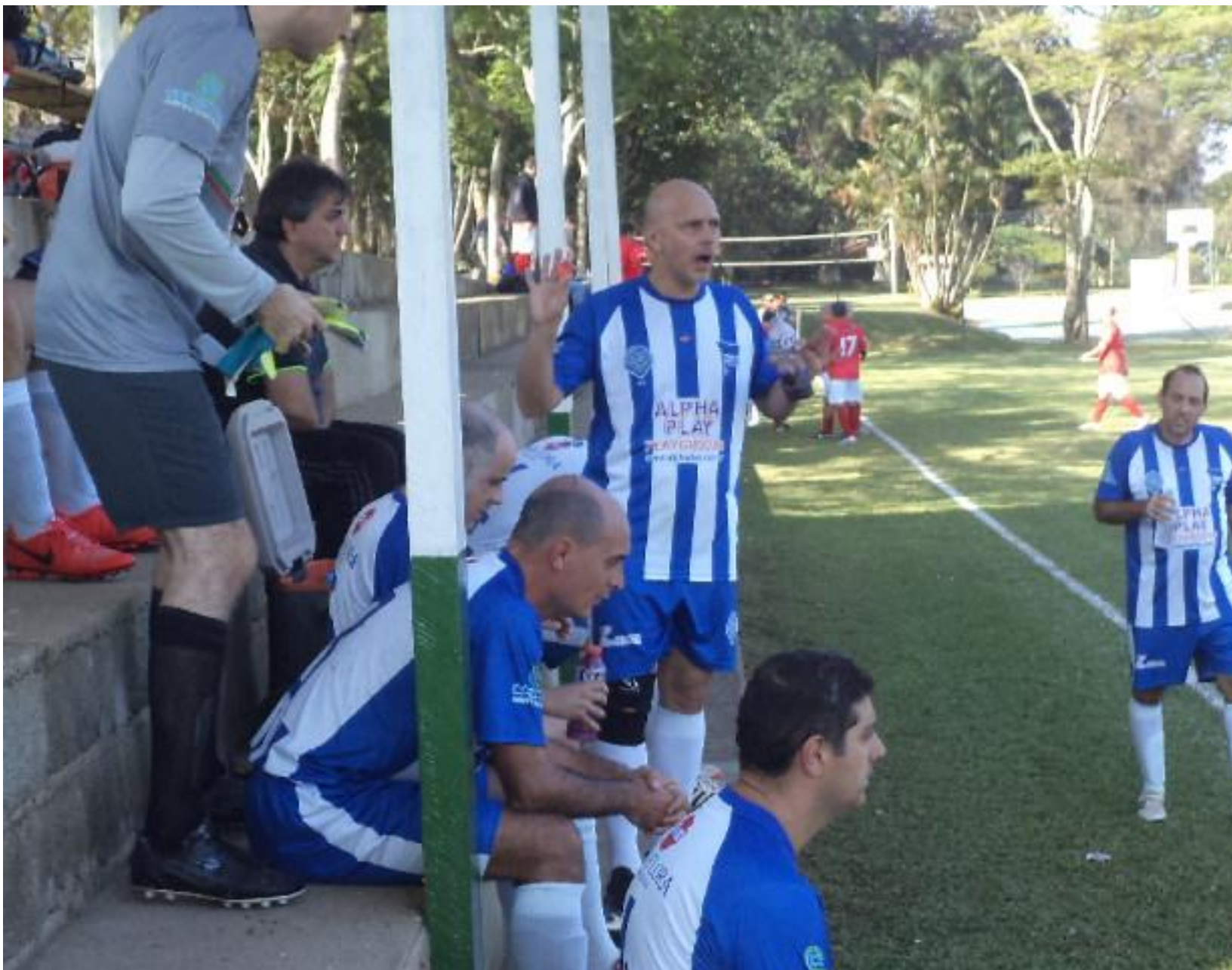
Lud, explicando o que não tá certo