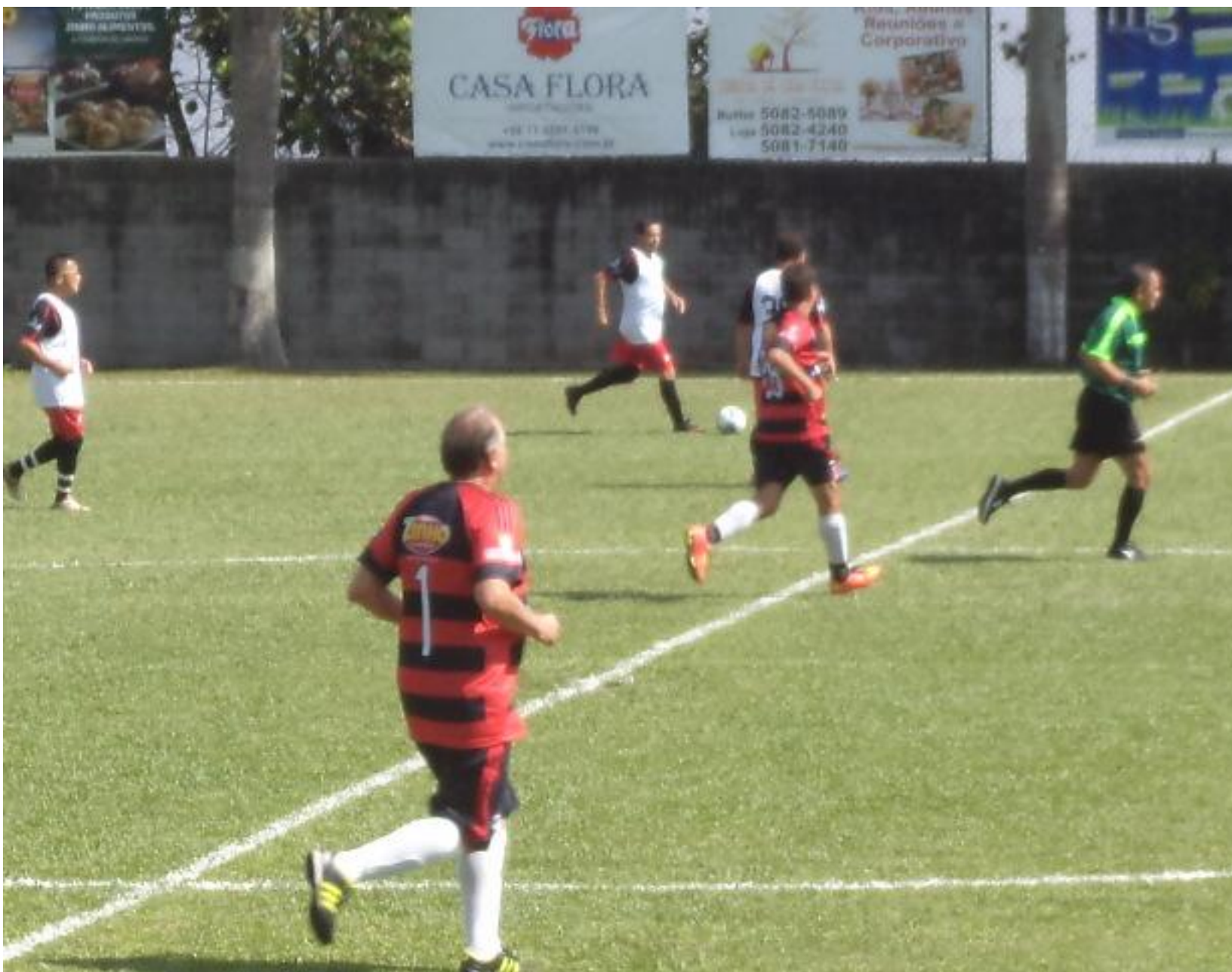
Fogassa na linha