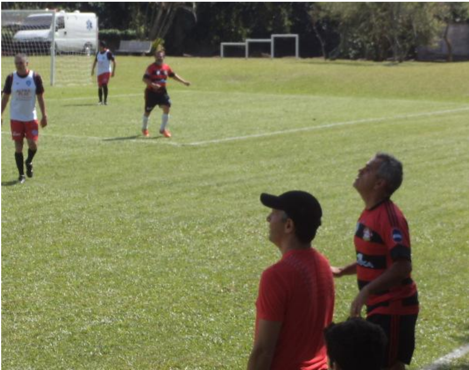
Bachert de “pofessô”