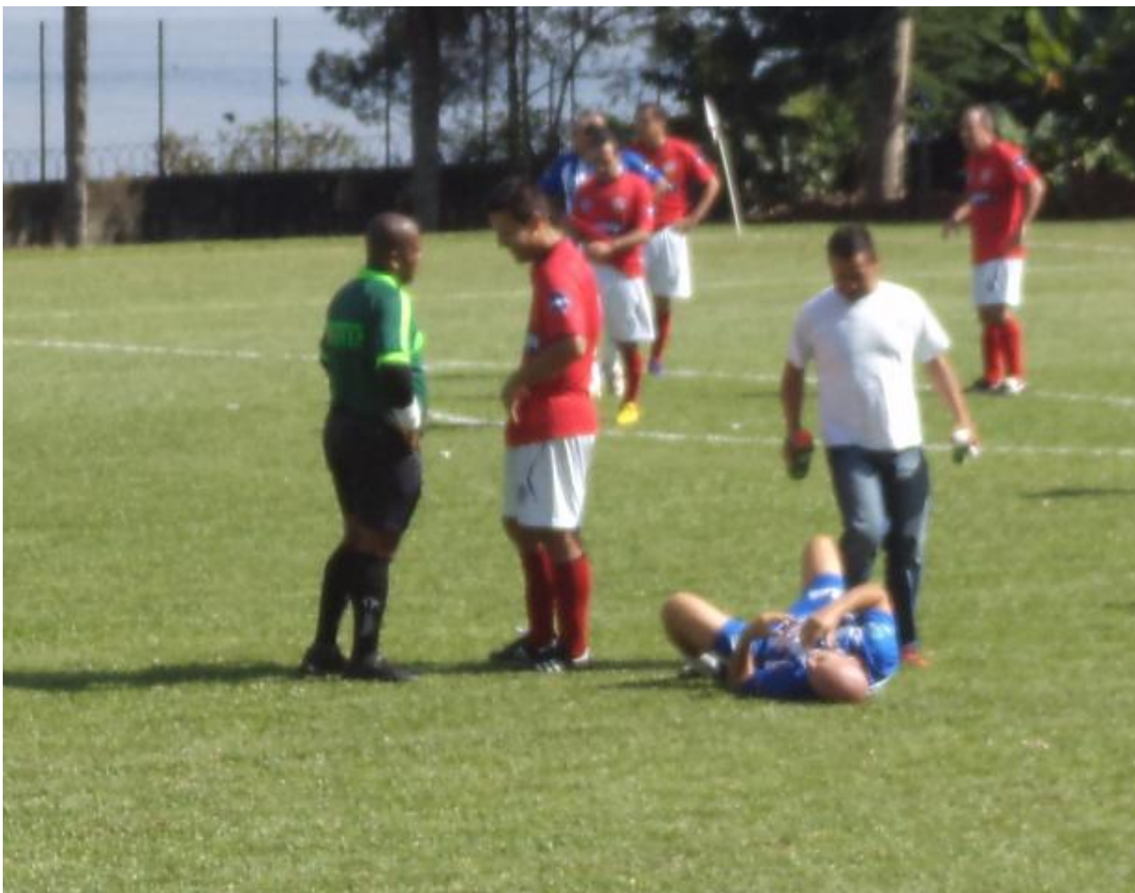
Tem um careca no chão, mas juro que não sei qual deles...