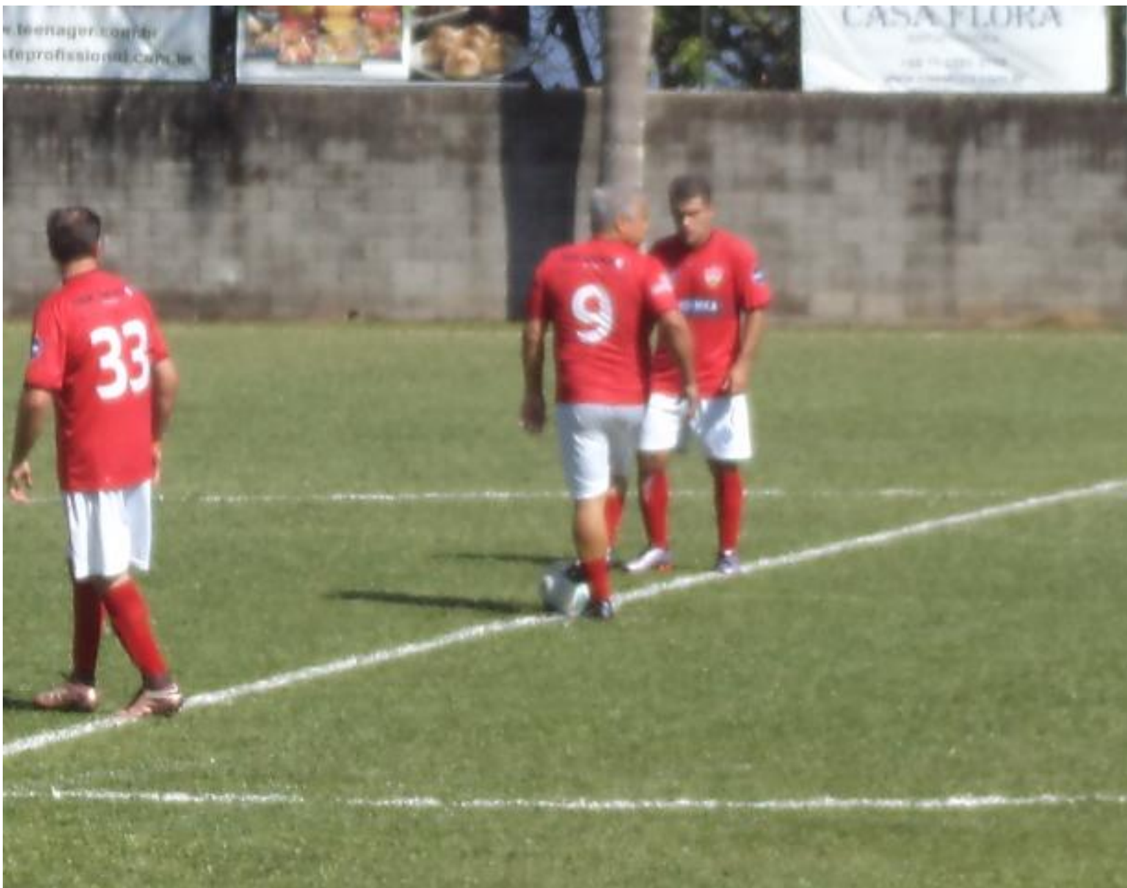
Nova saída para o Stuttgart