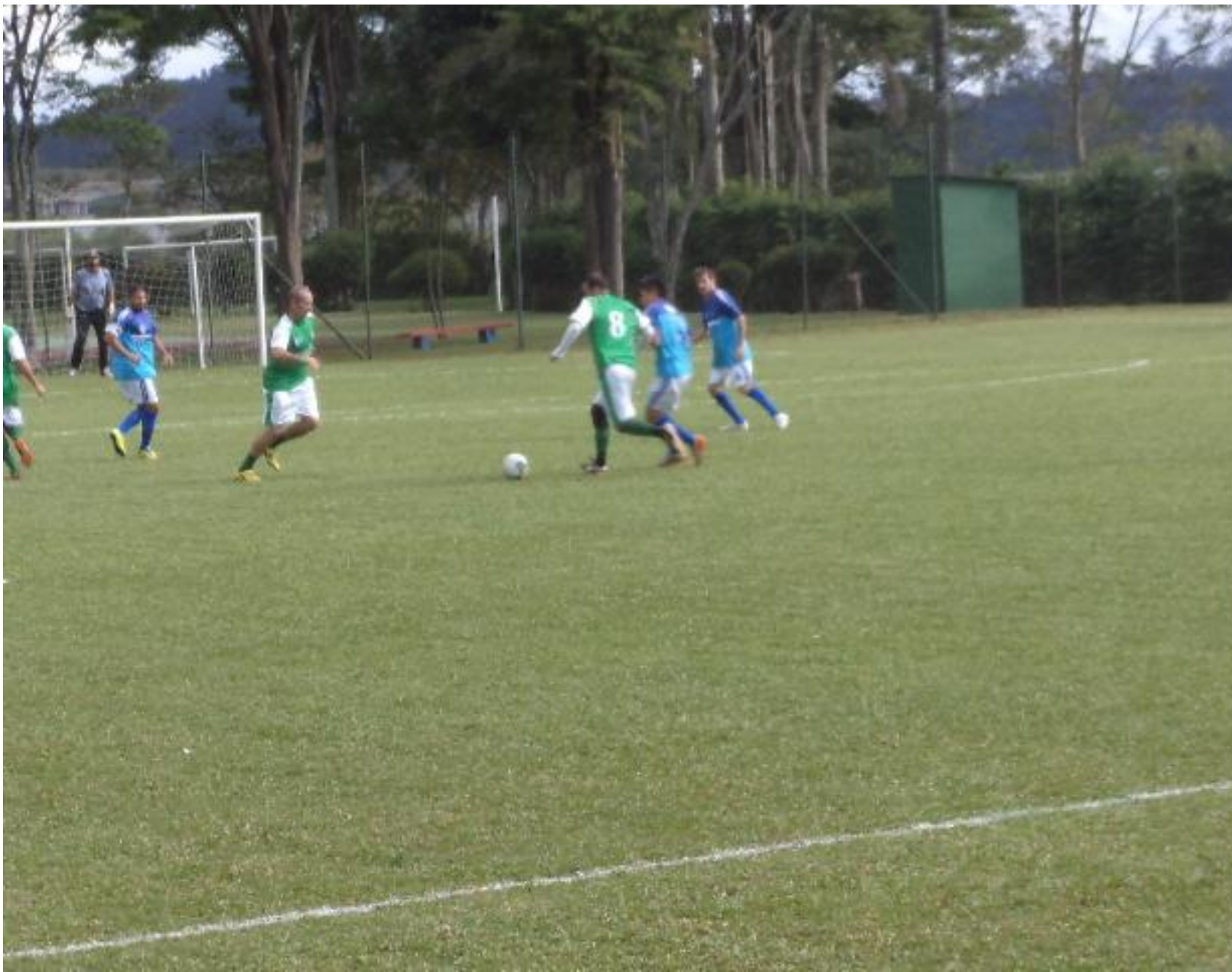
Mais uma tentativa, dessa vez do Leo