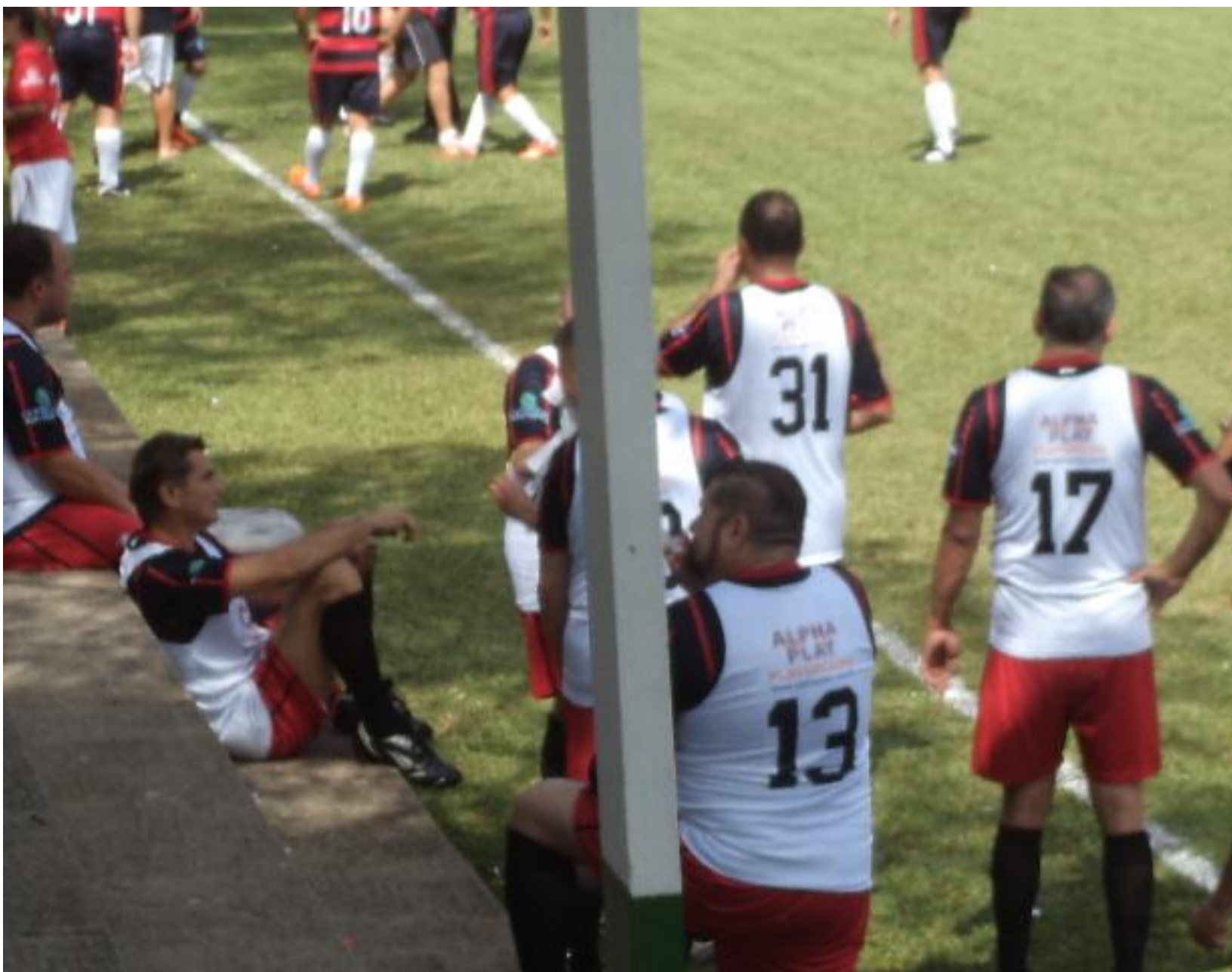
Resultado, colete branco para um lado