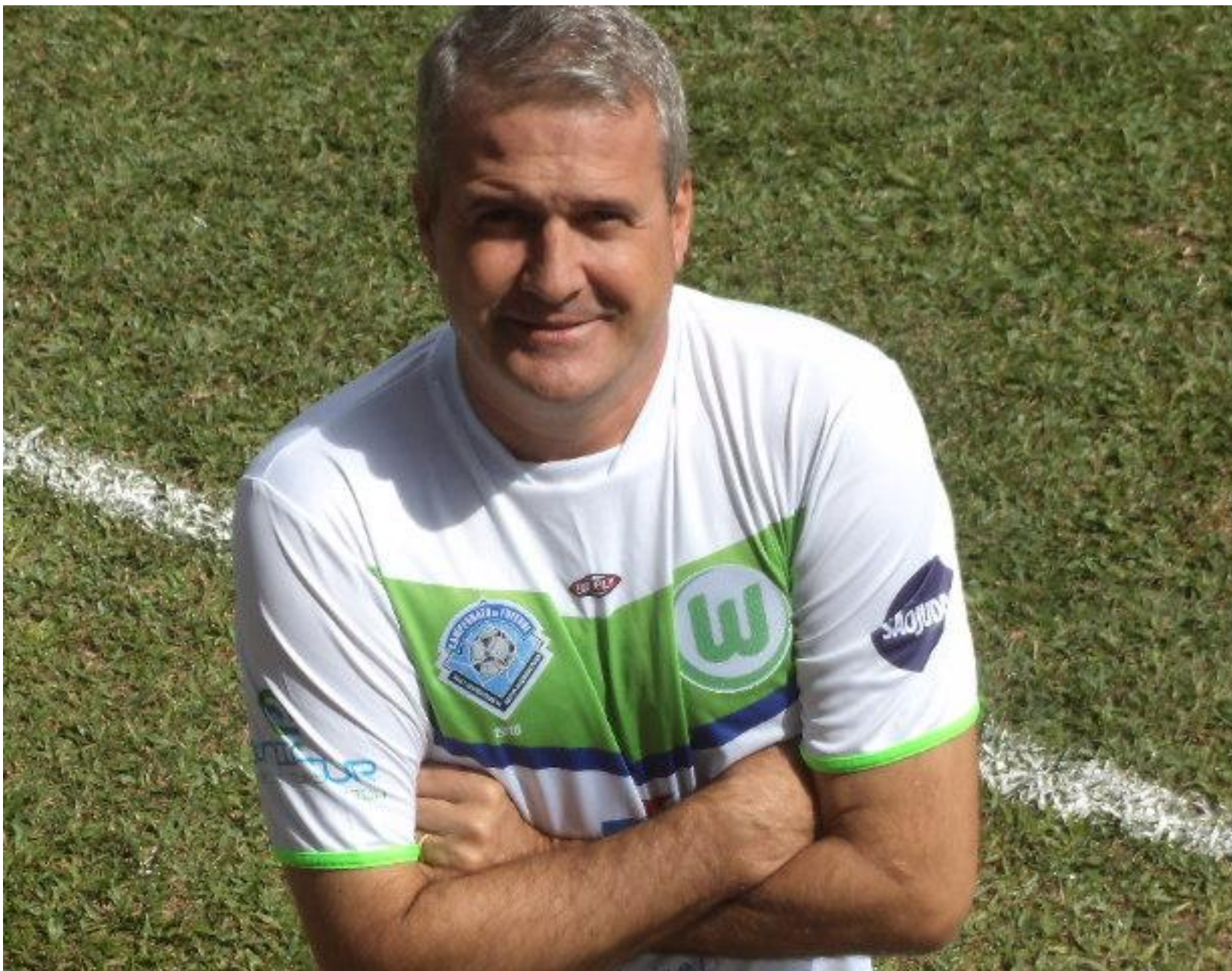
Trava, com cara de... Deixa pra lá