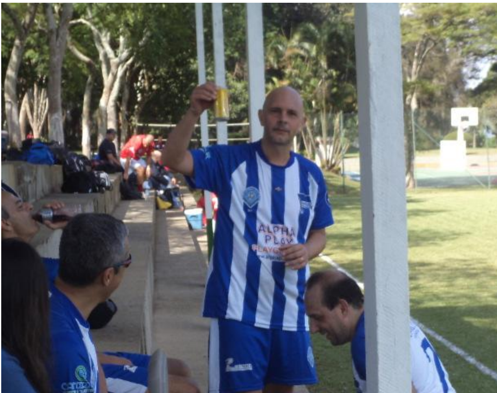
Uma latinha, pois ninguém é de ferro