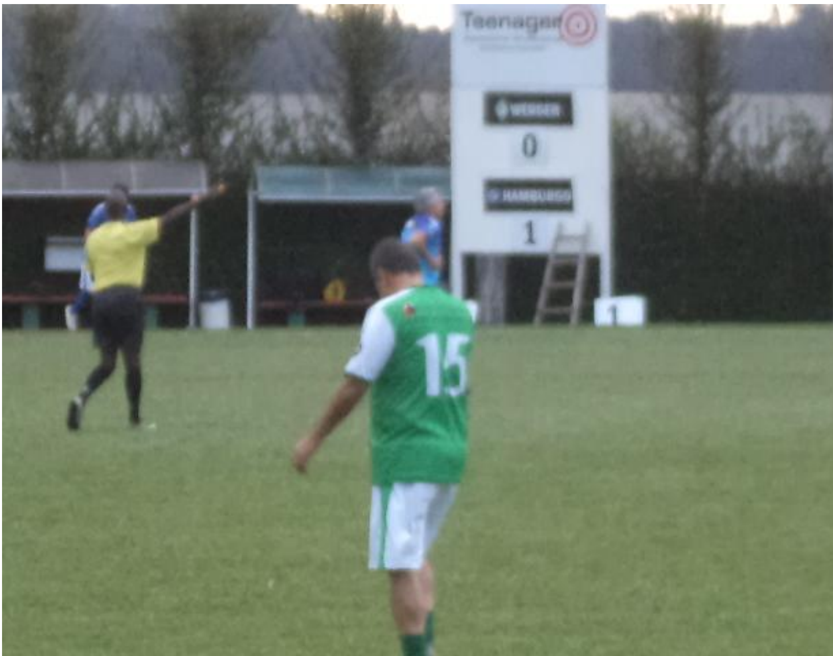
O Mariano também tentou apoiar