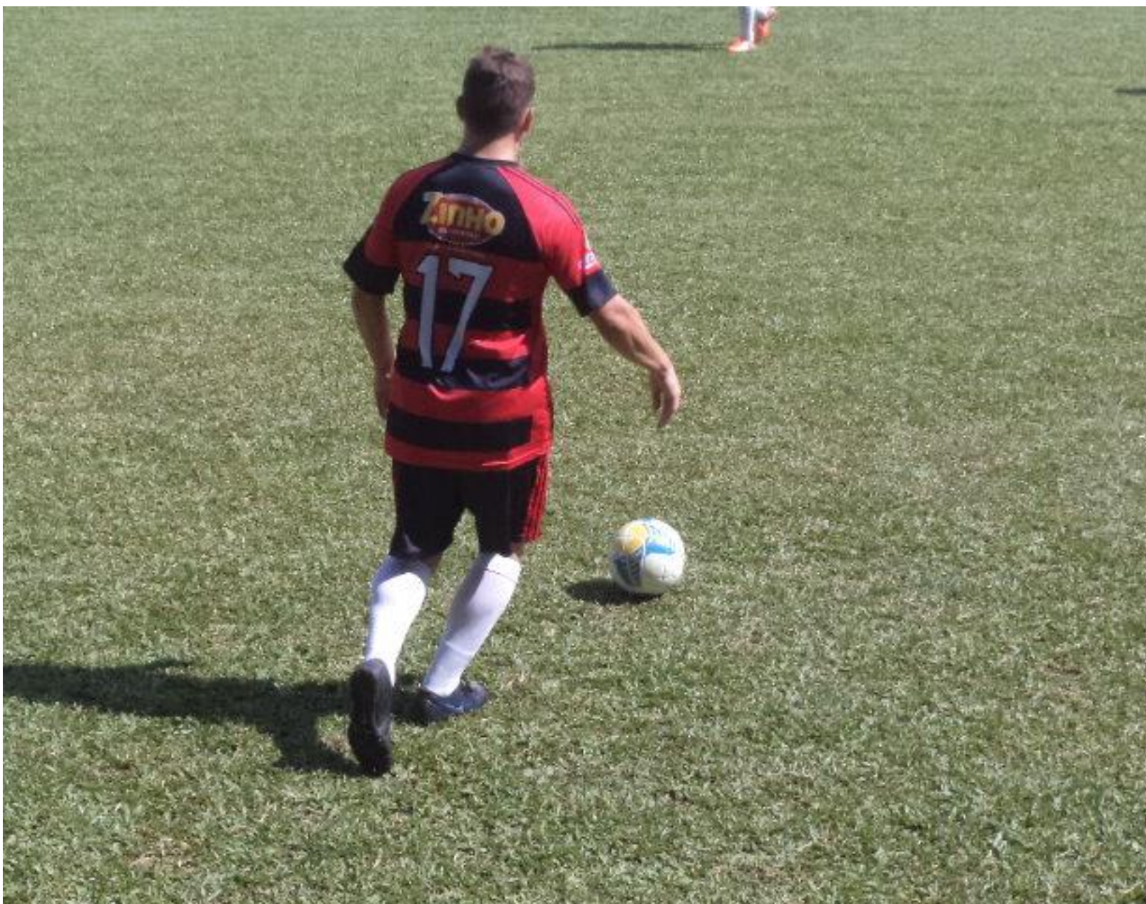
Olha o Corello aí