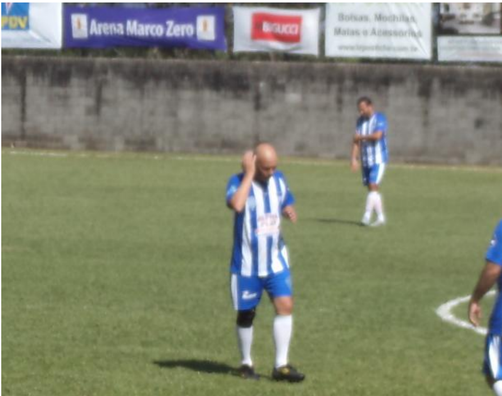
E o Lud penteando os cabelos