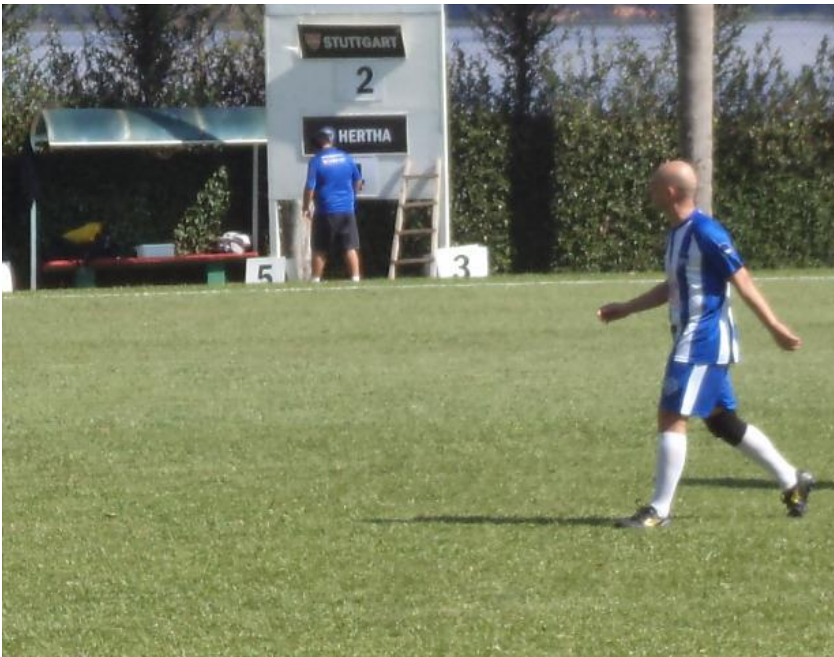
A essa altura já tava fácil