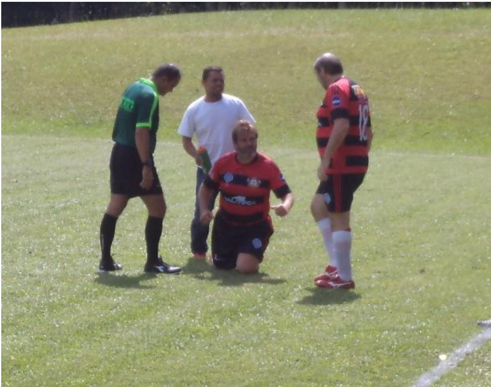
Fizeram alguma coisa, ele levantou rapidinho