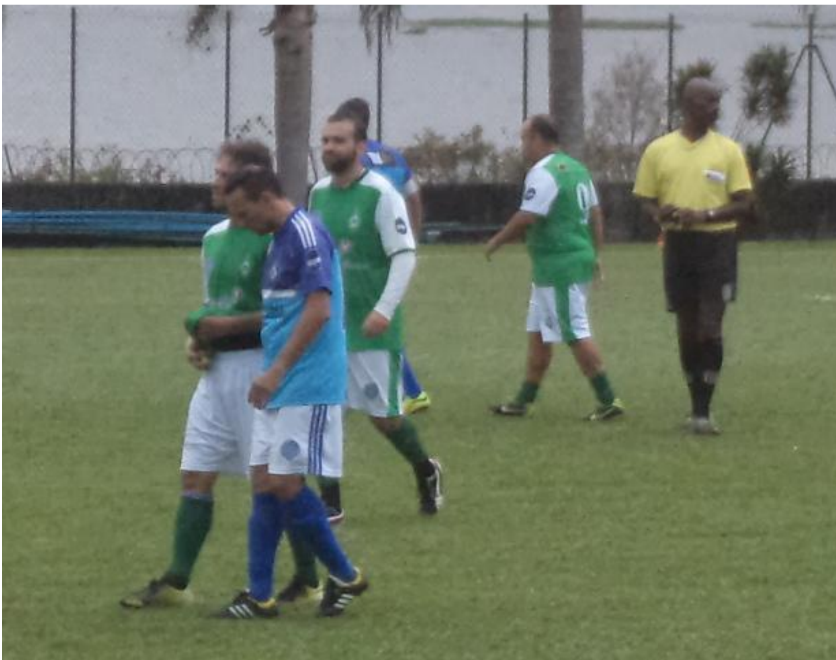
Os últimos comentários