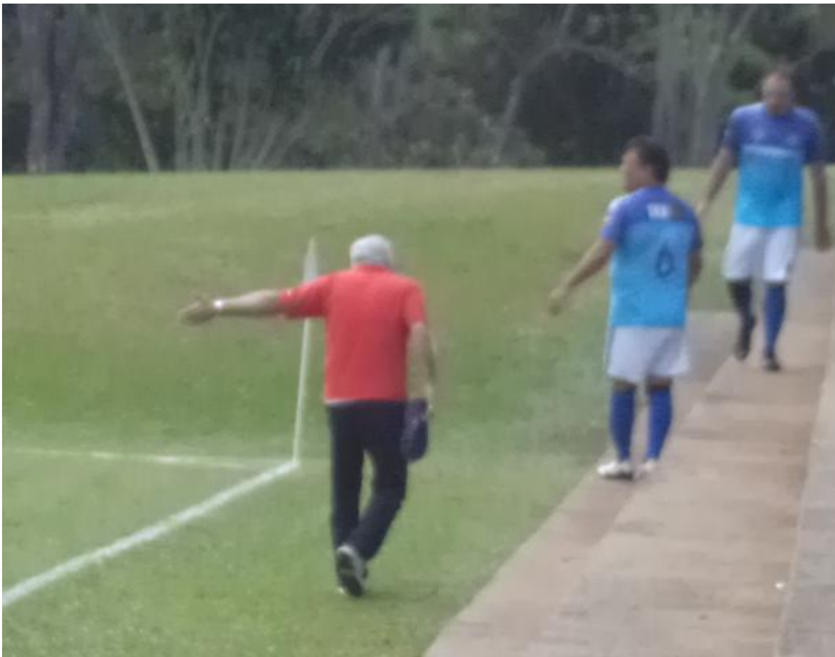
O Marcão “aguniadu”!