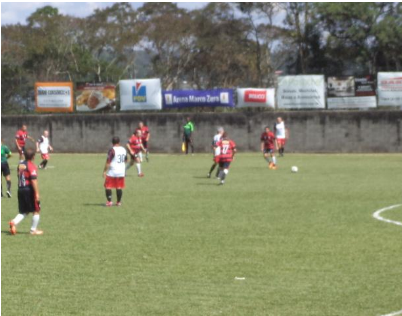
Metade dos jogadores de linha na partida estão nessa foto.