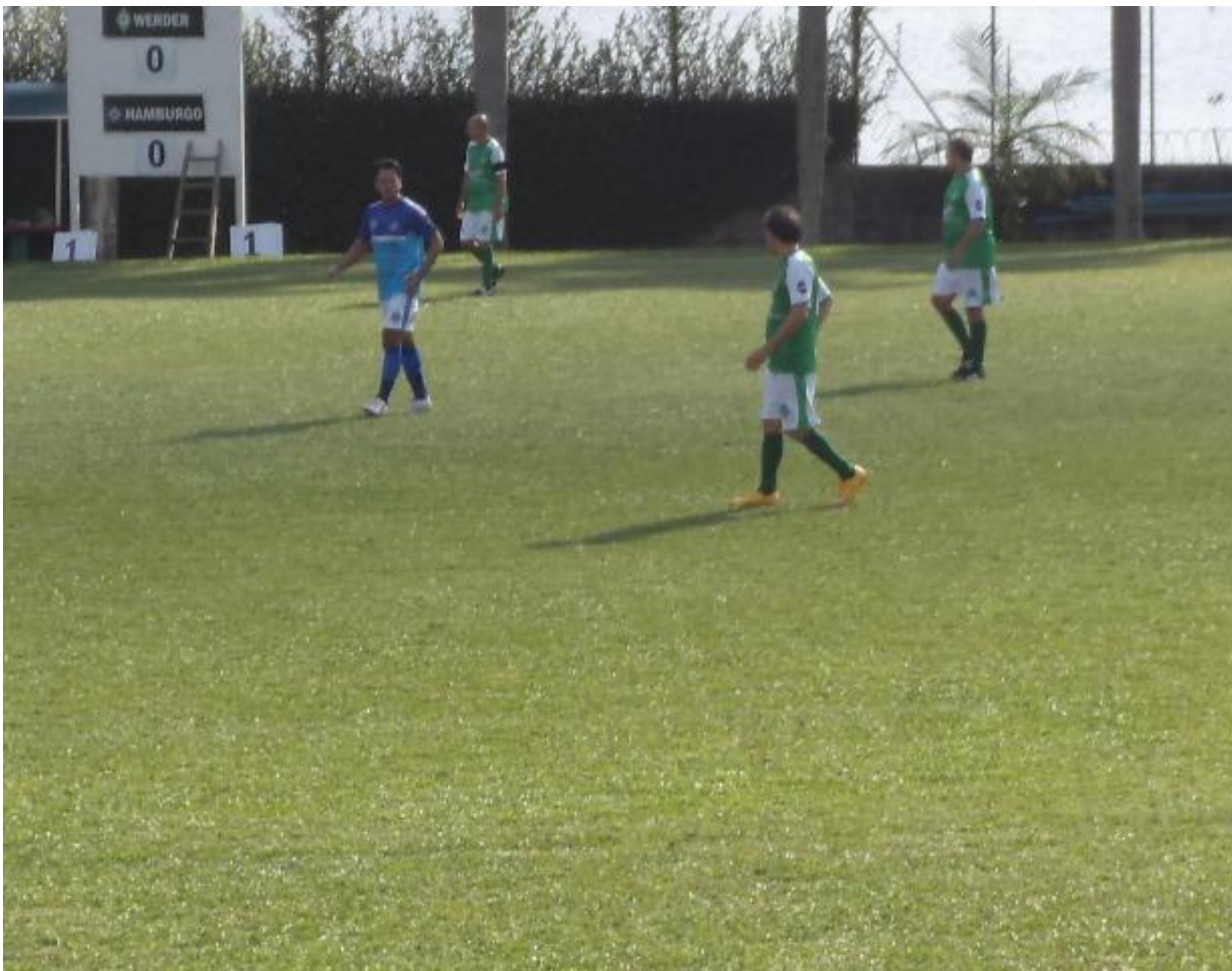
Último jogo, bem equilibrado