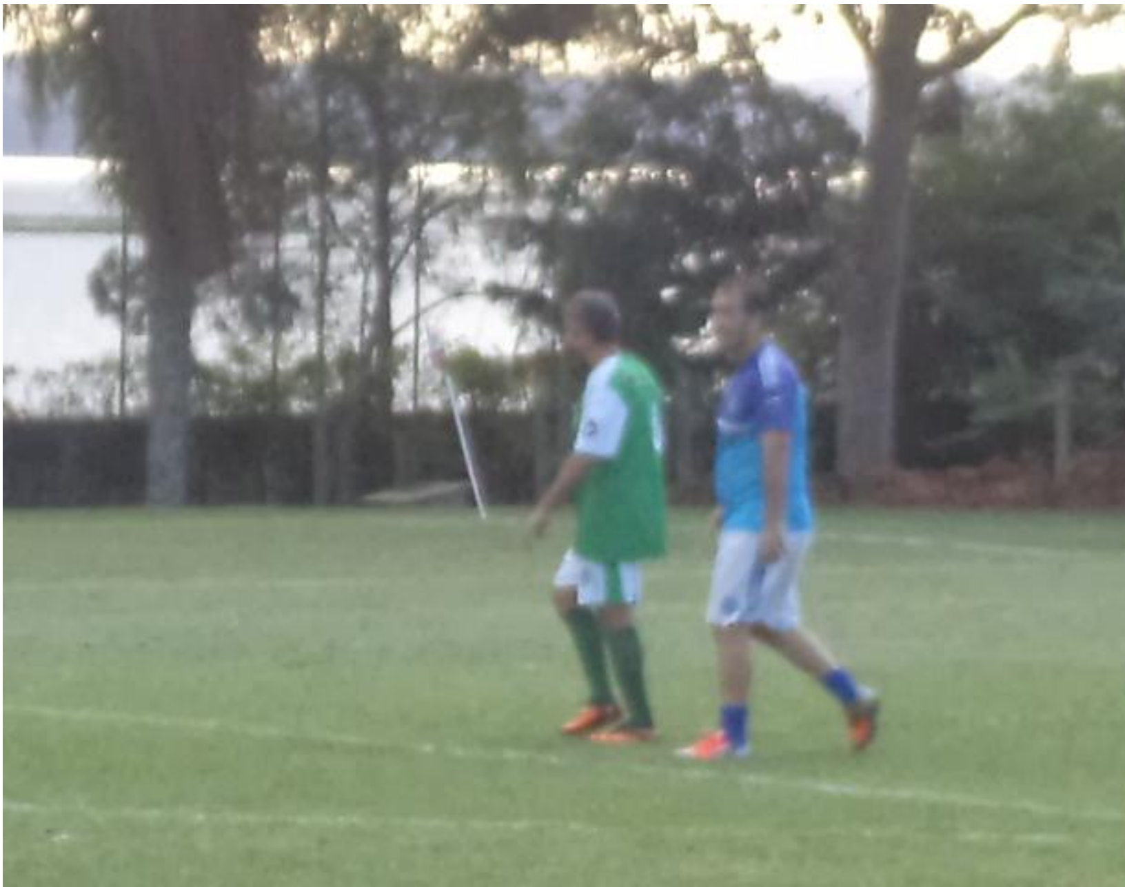
O Pina e o Lerro