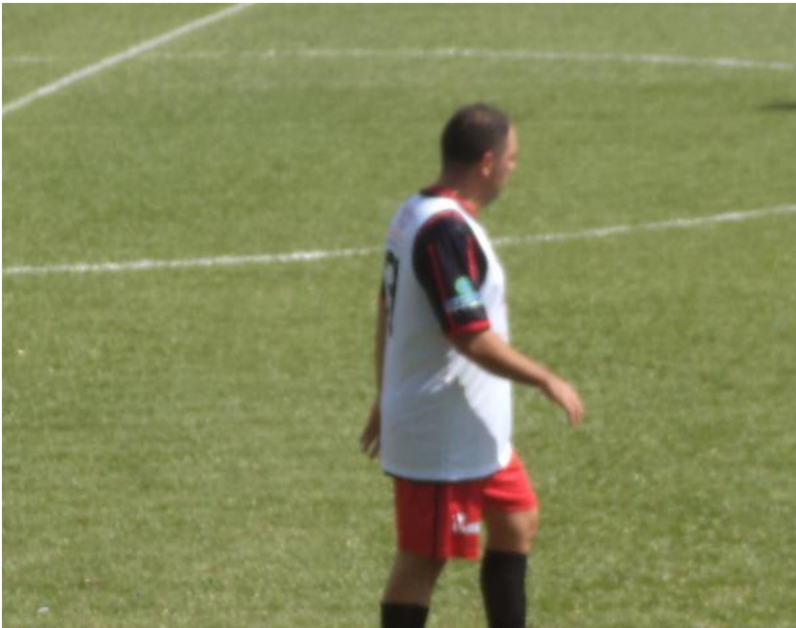
Jogo caminhando para o final