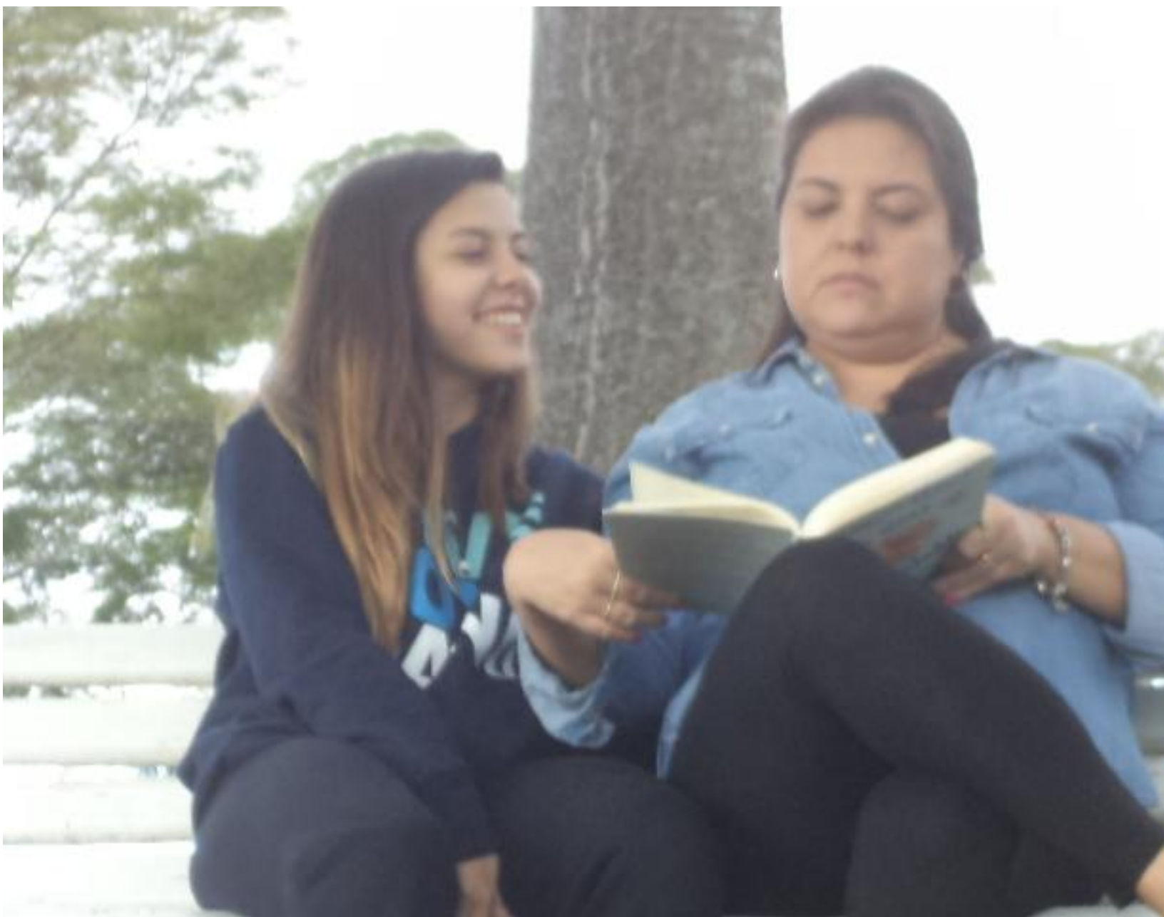
A presença feminina sempre embelezando o barranco.