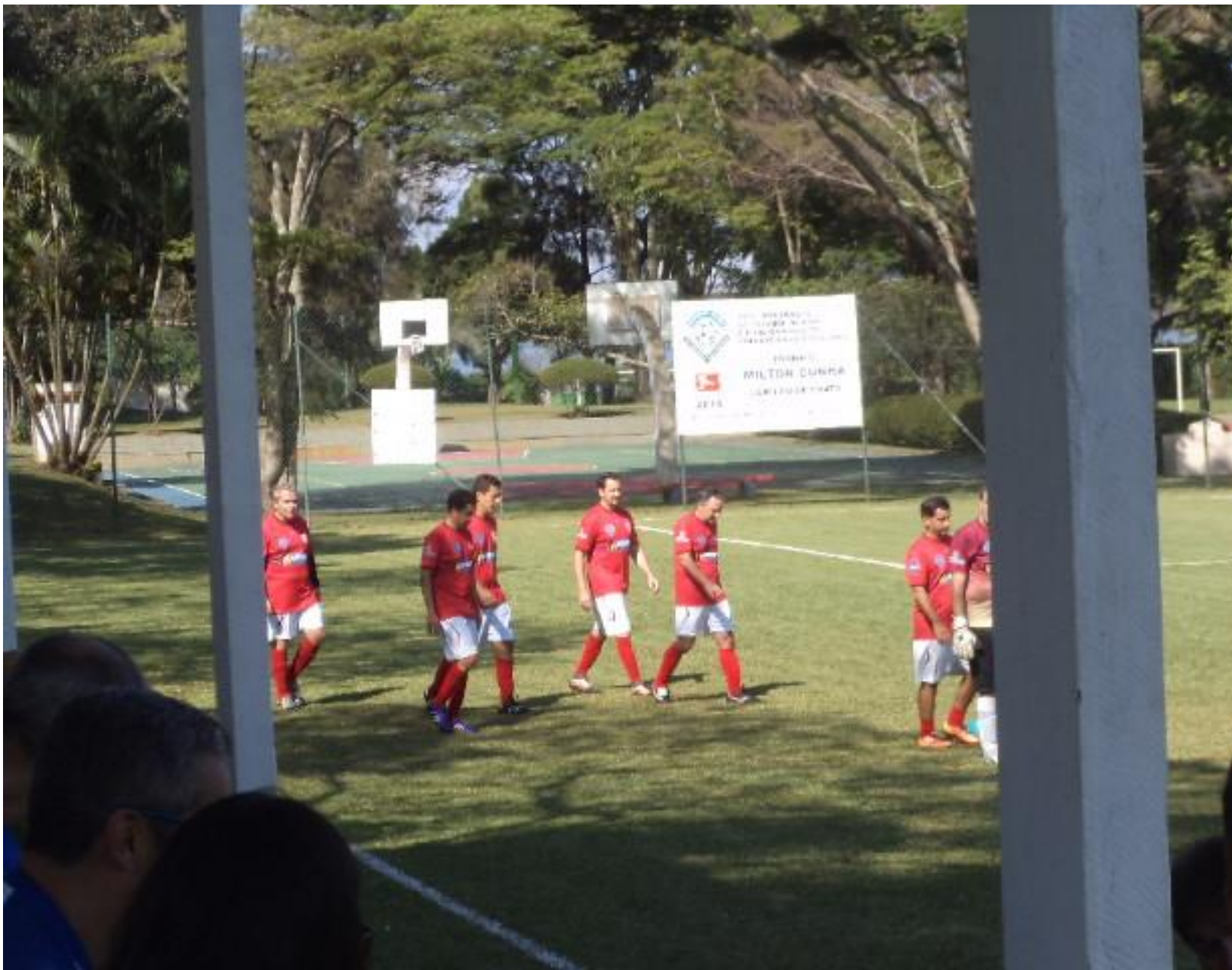
Acho que era o Stuttgart voltando