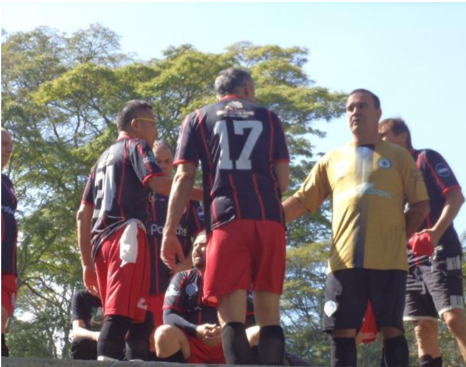
Batata no gol? E a toalhinha branca para combinar com as faixas nas meias