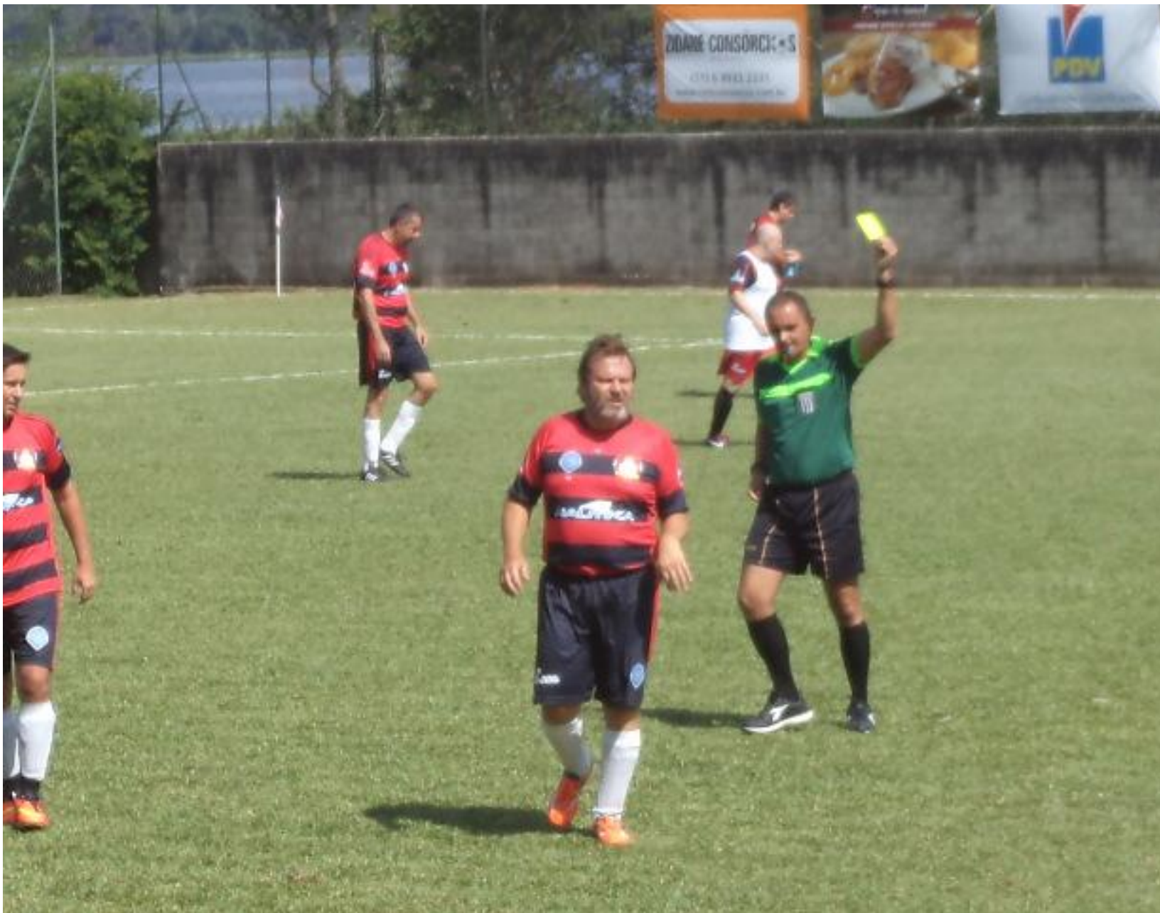
Que foi pro Corello que não tá na foto, não pro Capozzi como parece