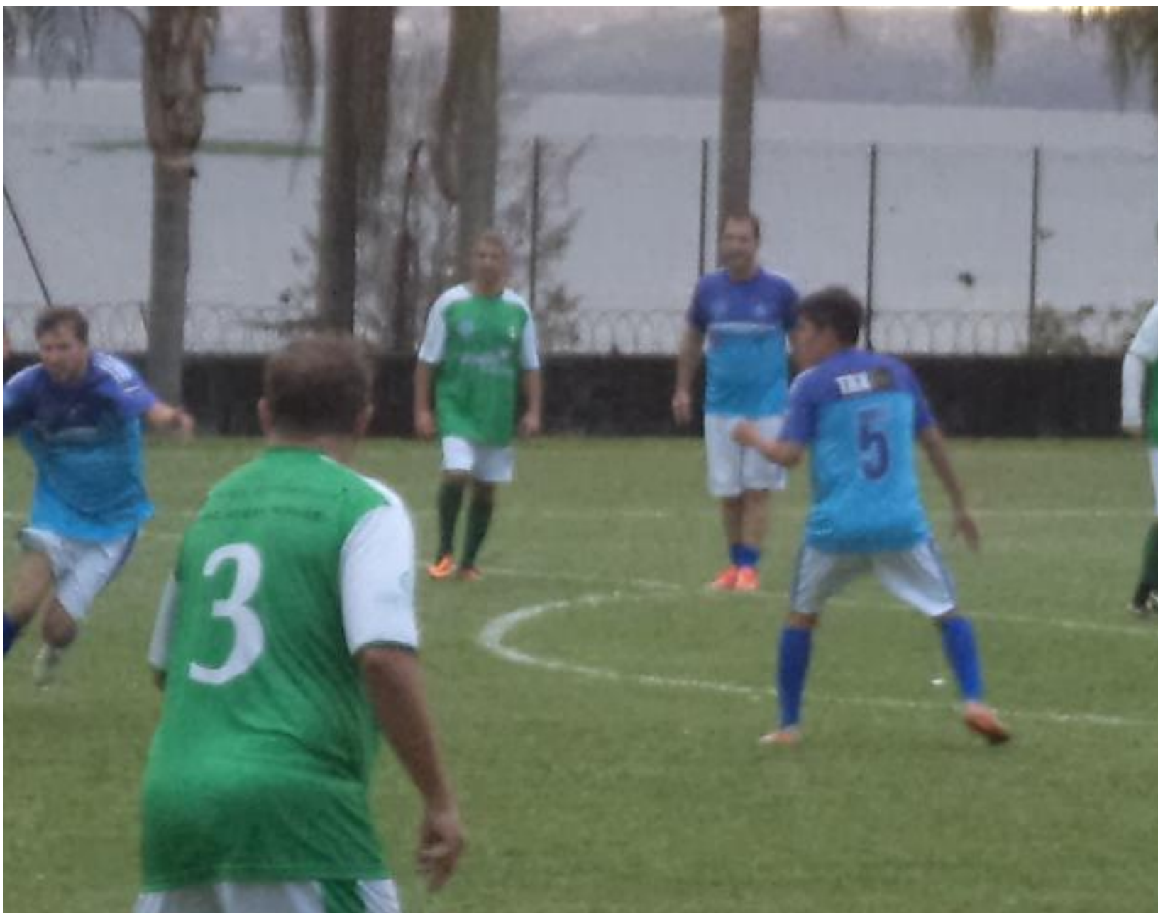
Os azuis do Hamburgo, depois da expulsão do Wang, recuaram todos e não deram chance de empate