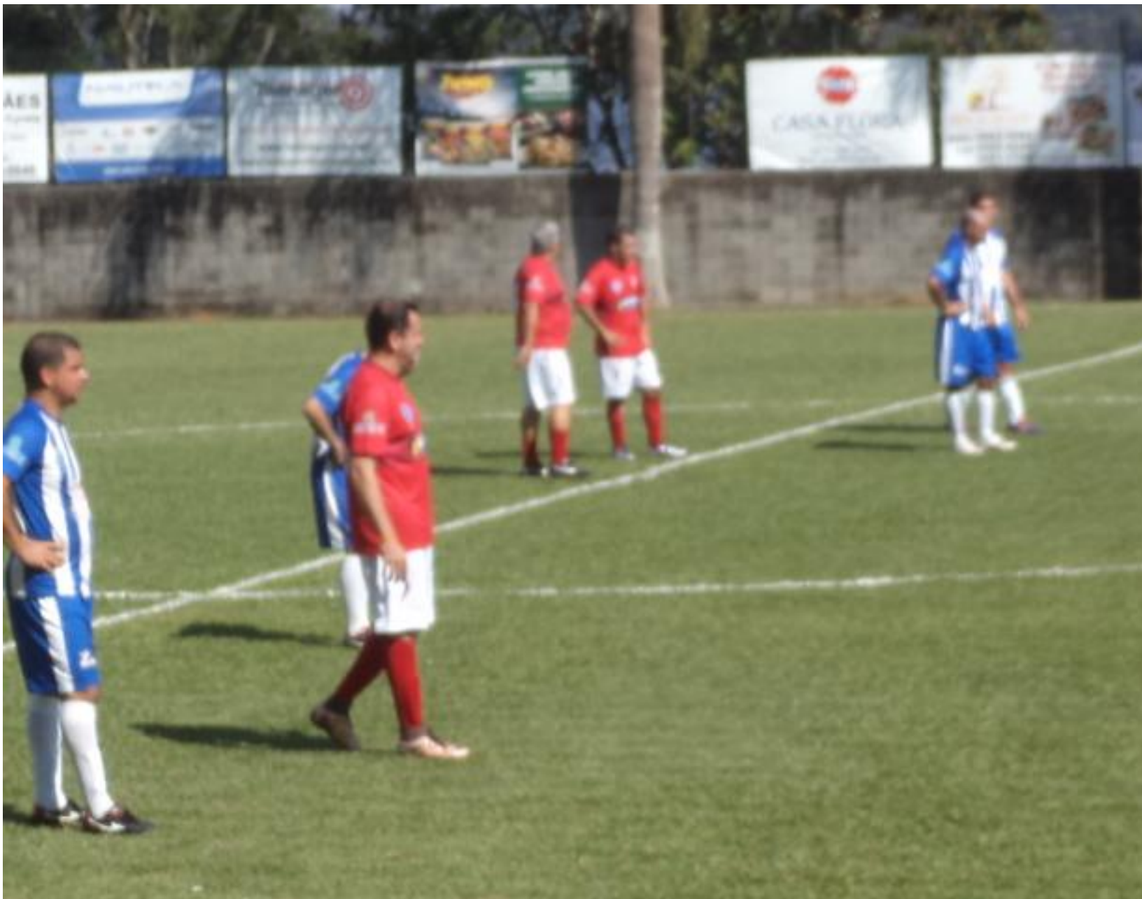
Todo mundo esperando ela, a bola...