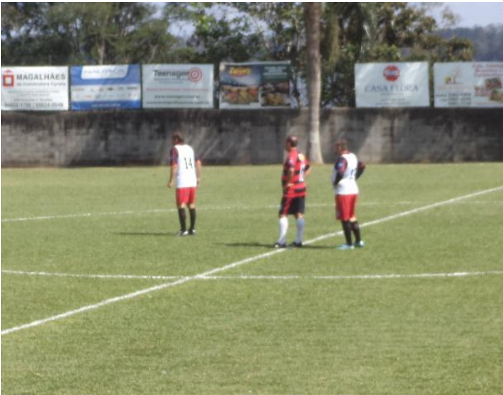
Espanhol cercado pelo Bambam e pelo Seinas