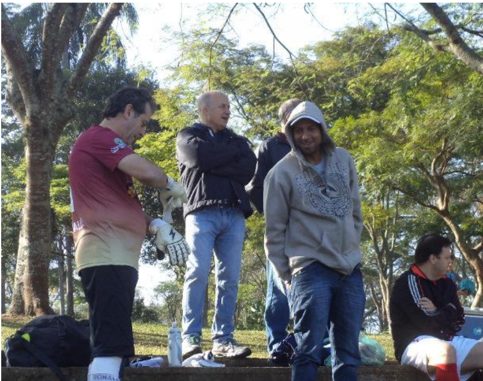
Olha eles ai de novo