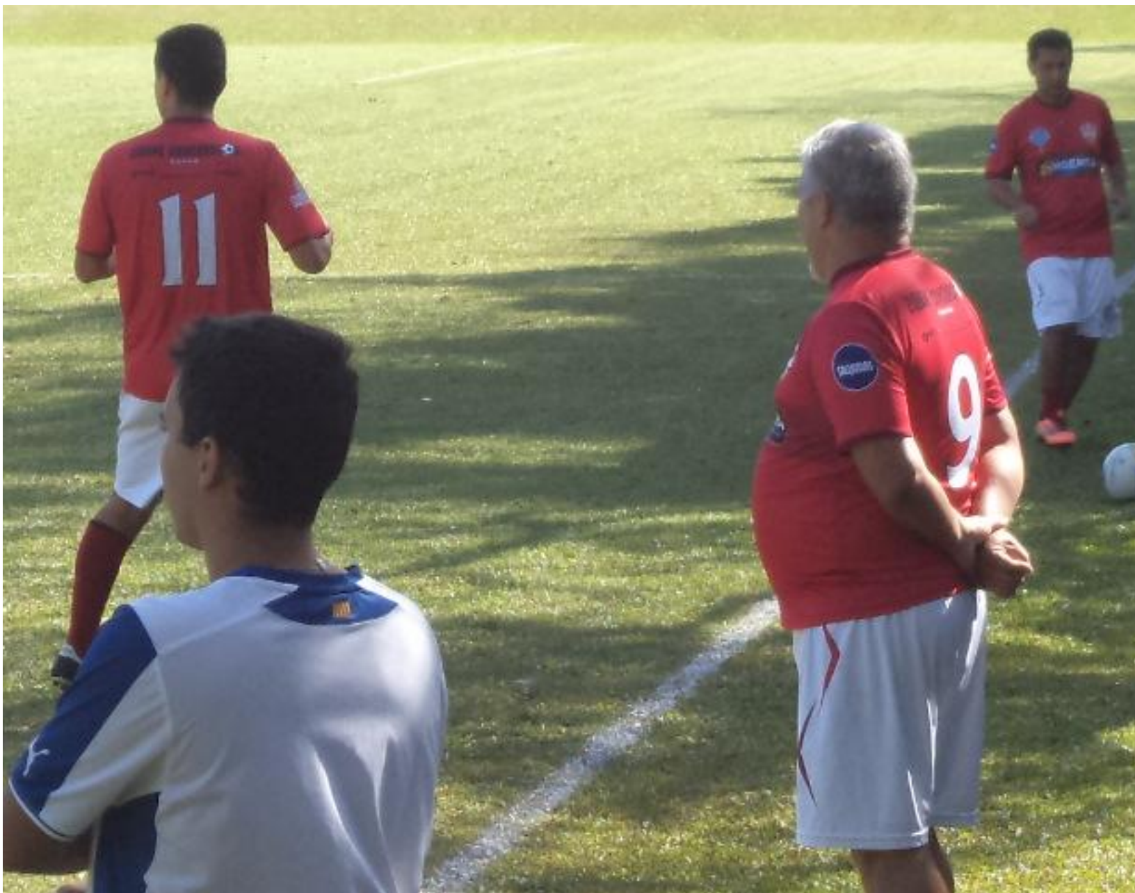
E o Dunga só observando