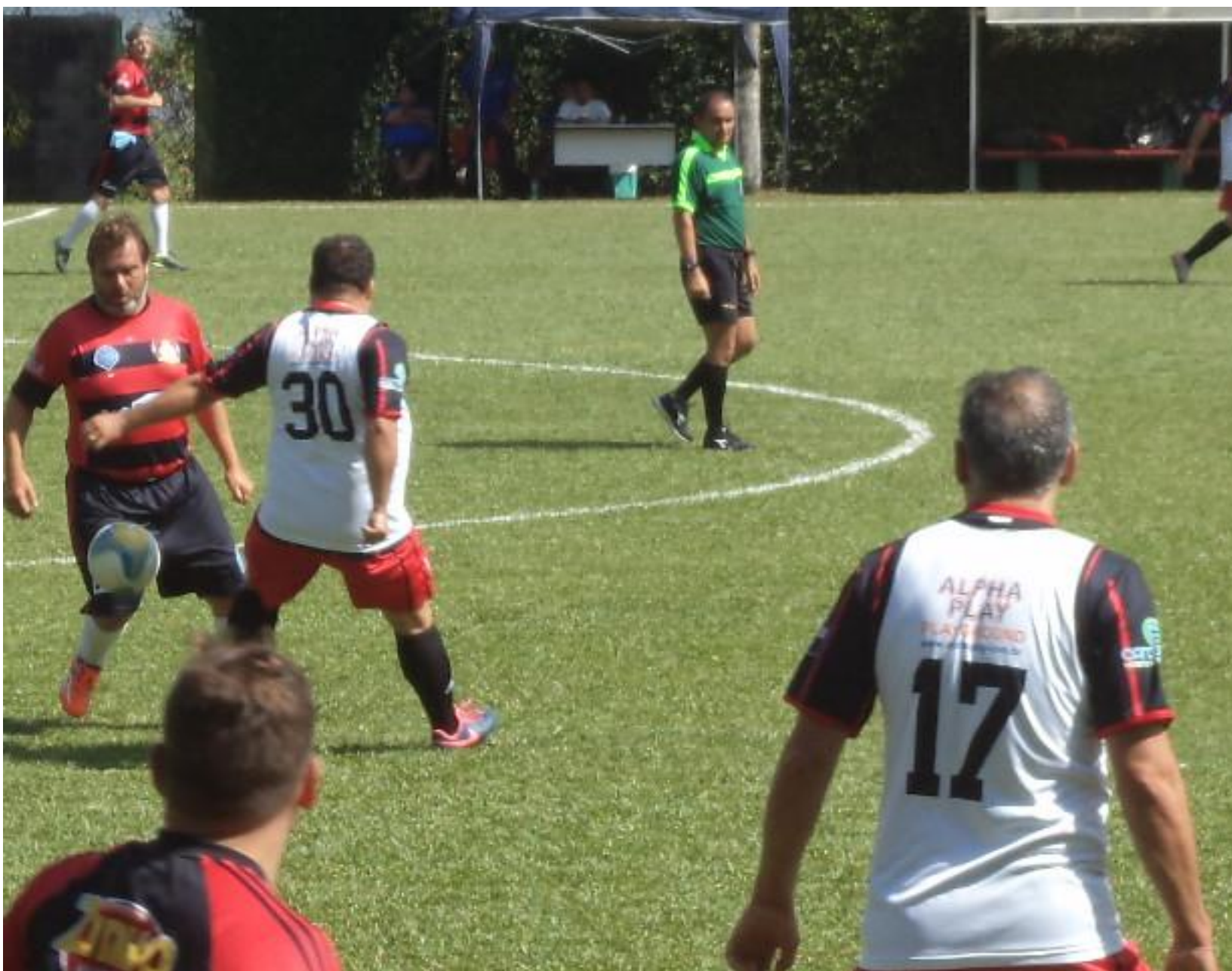
Sempre os mesmos nas fotos