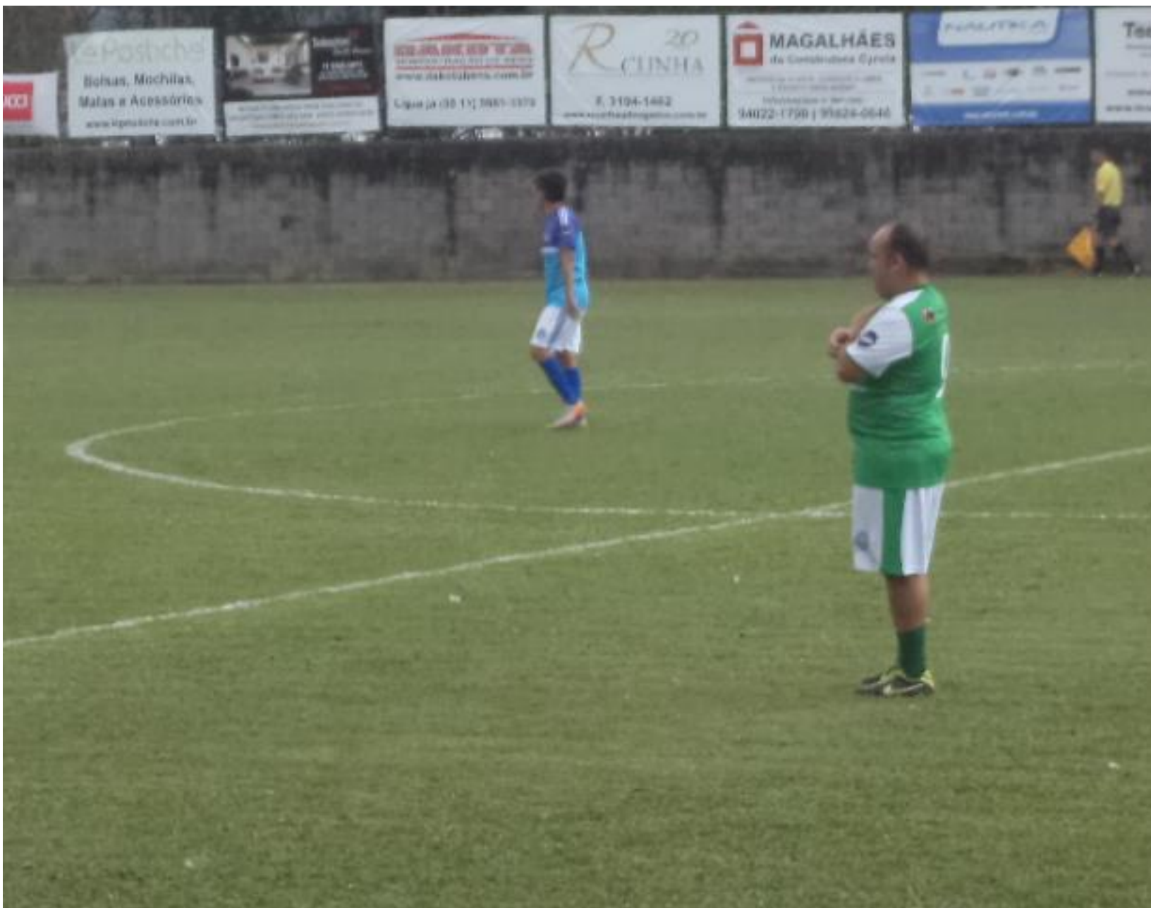
Dudu só observando