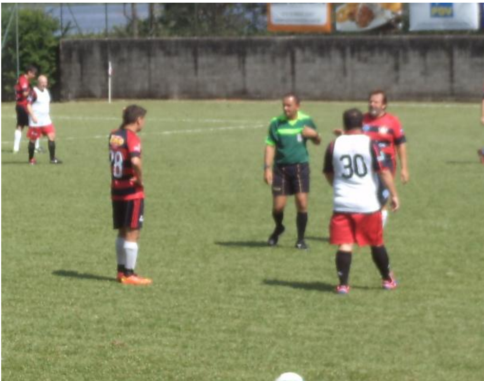
Parece que dessa vez tem cartão