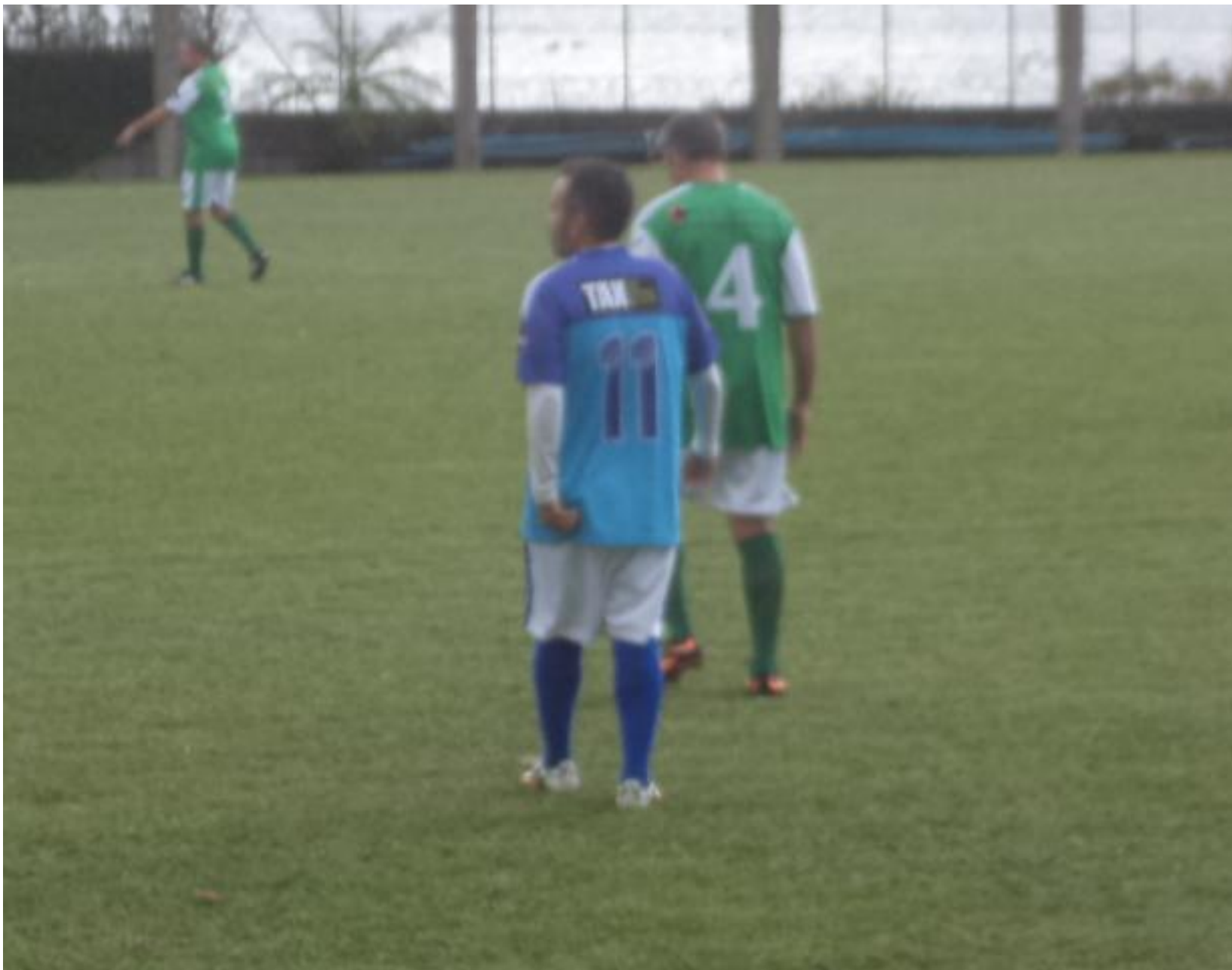
Tabordinha sempre nas costas do Lerro