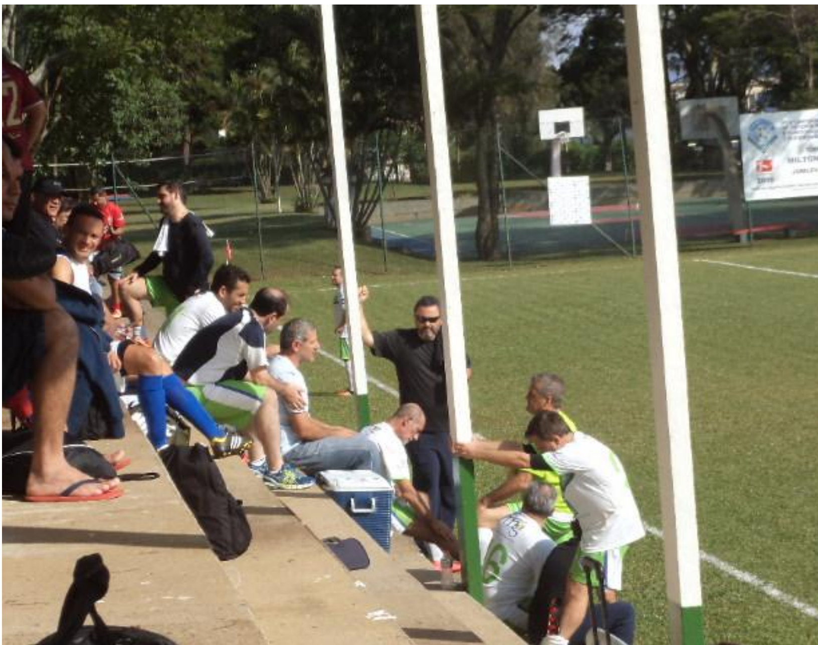
Boa presença no barranco