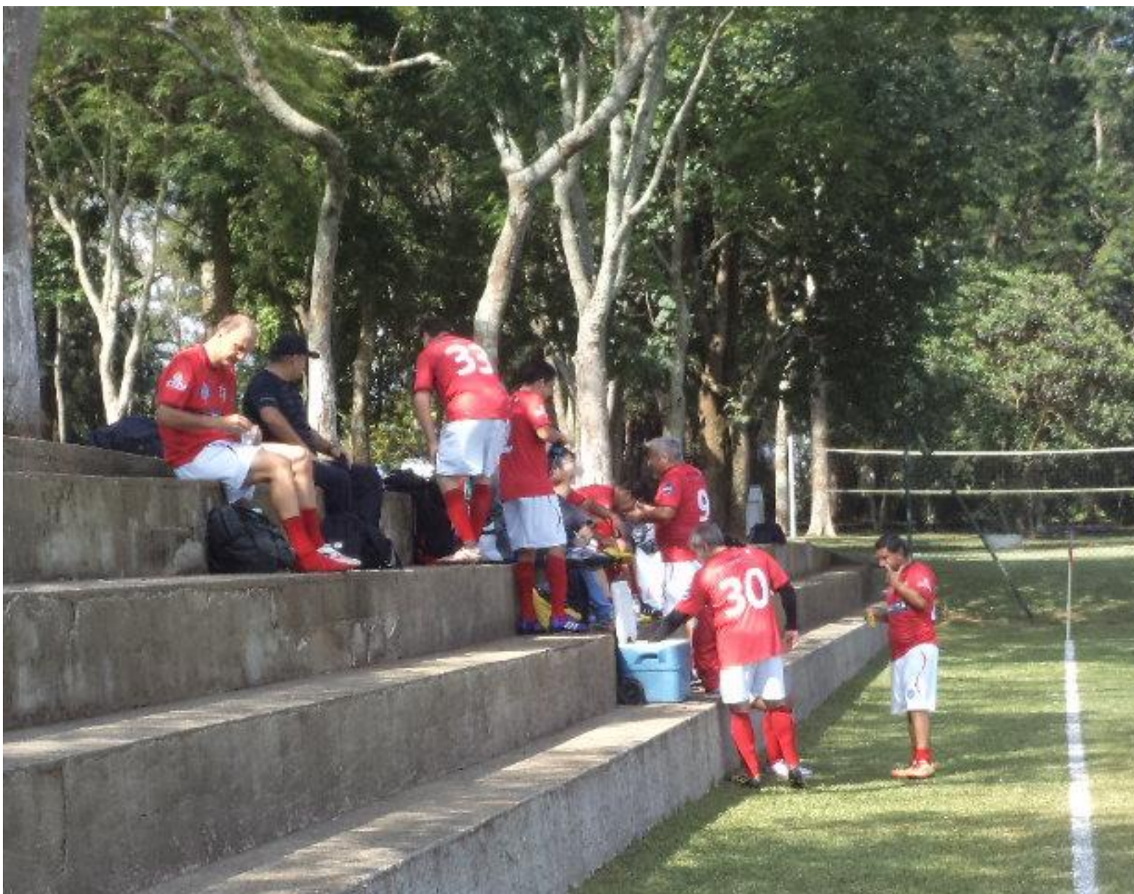
Hora da catota do coordenador.