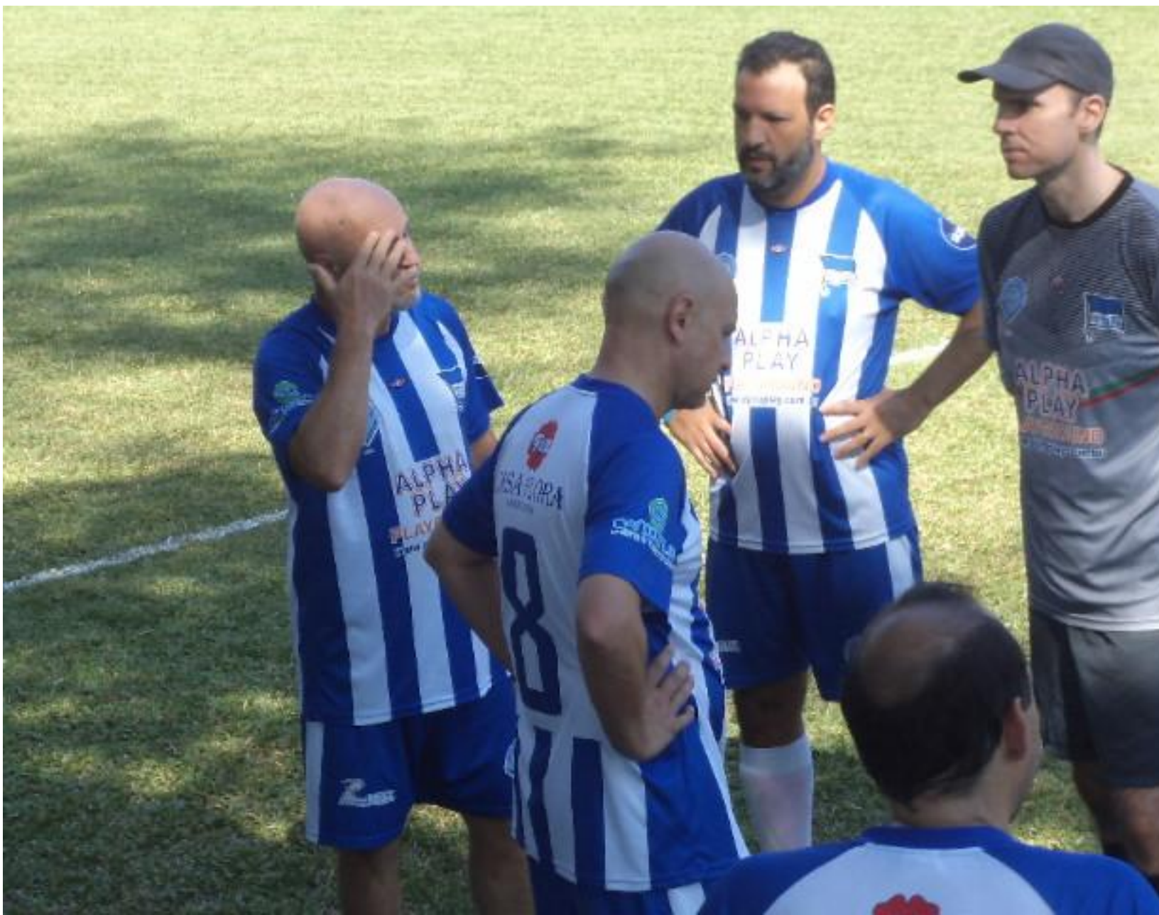
Bora pro jogo