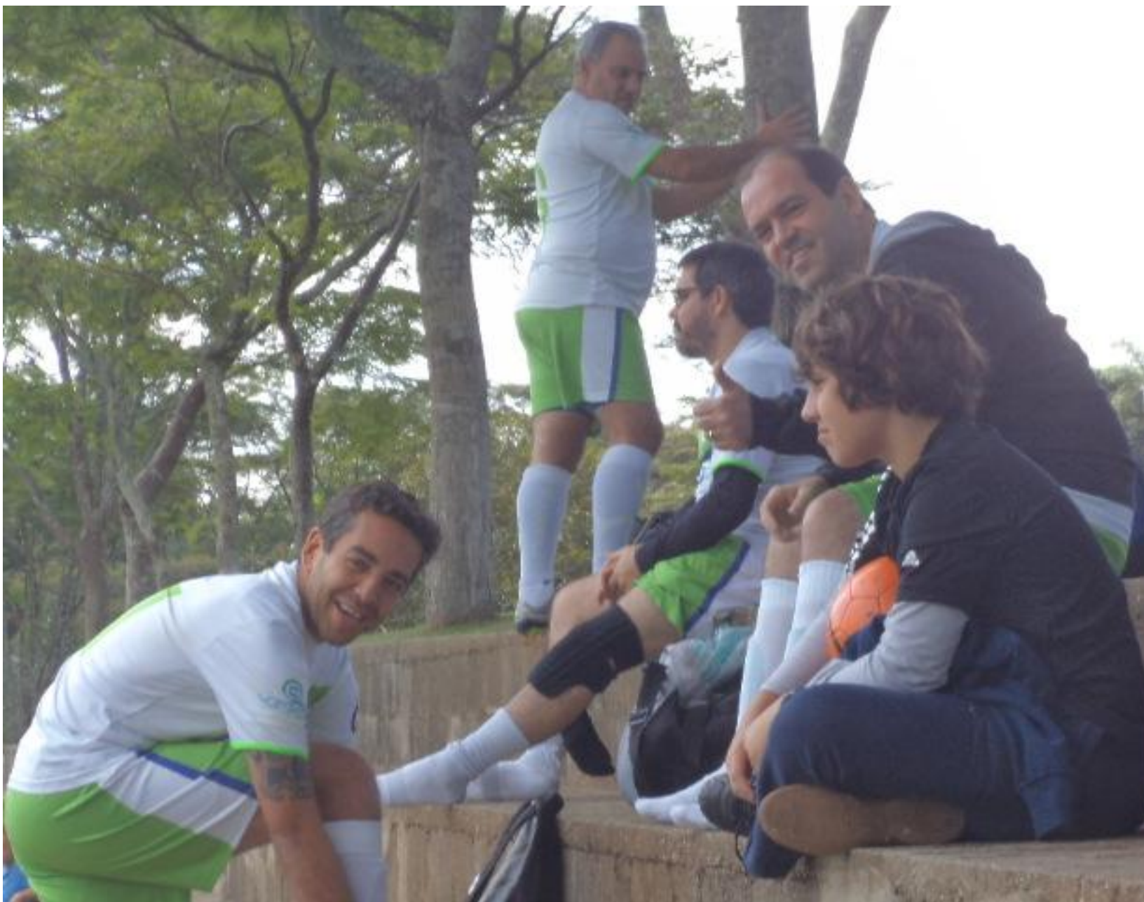
Olha a cara de felicidade