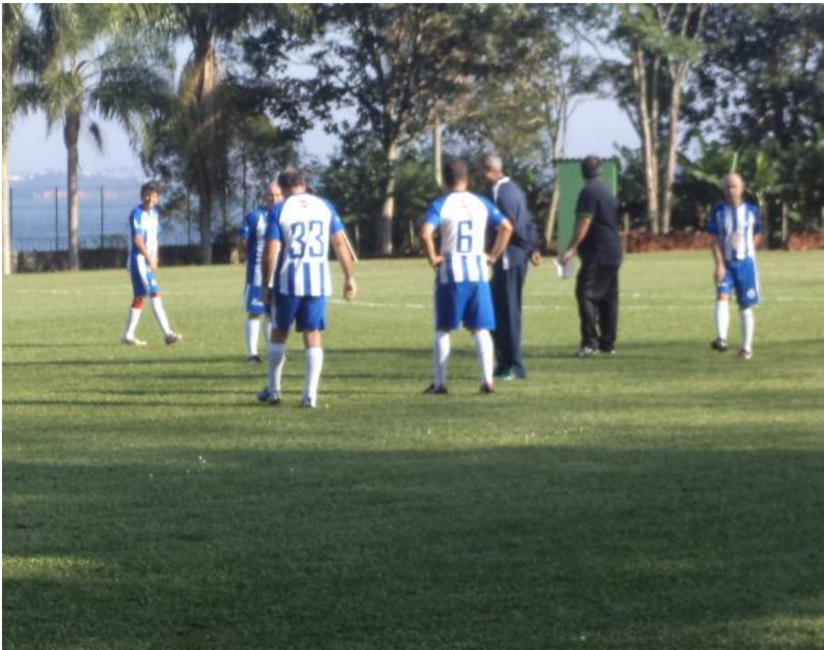
Concentração pré jogo