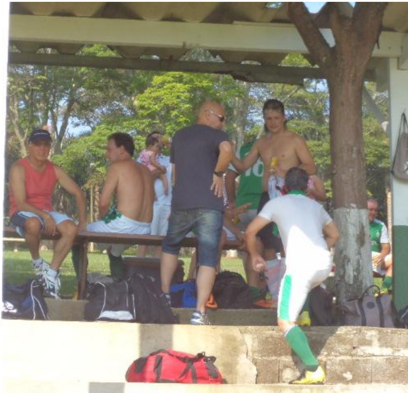
O presidente só observando