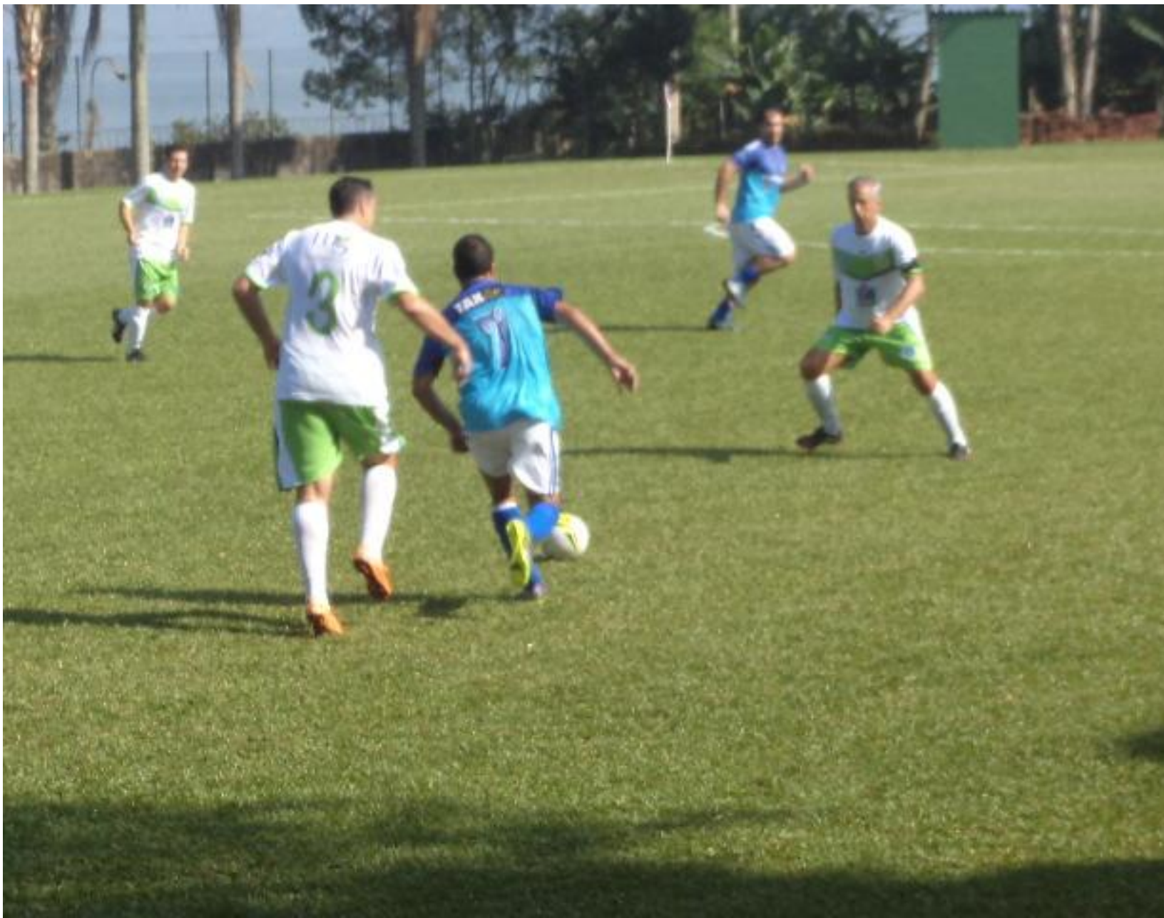
Cara de mau do zagueirão...