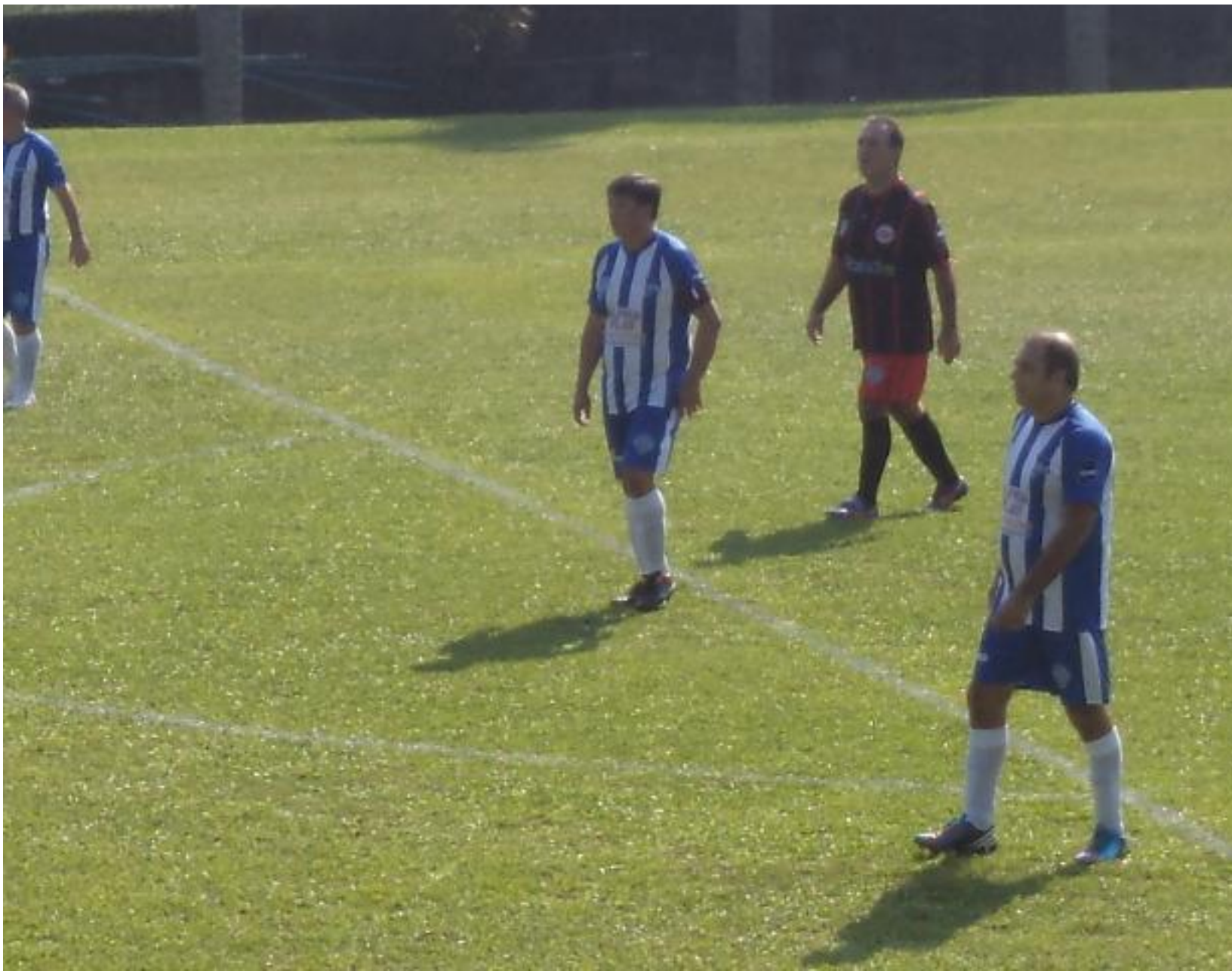
O Batata não teve moleza