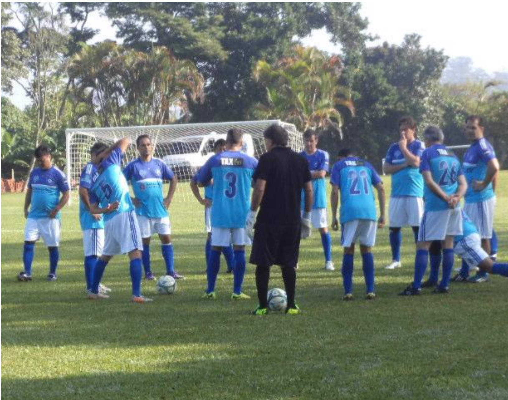
Antes do jogo, muita conversa e estratégia.