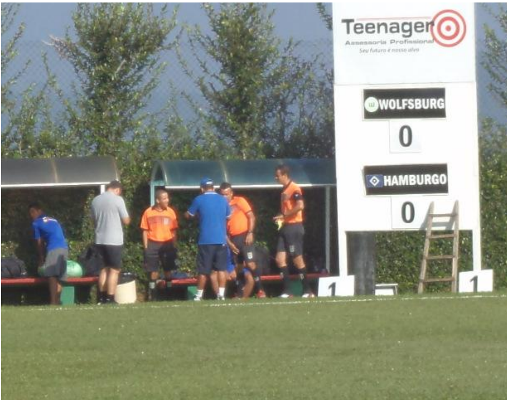
Últimos cuidados antes do jogo.