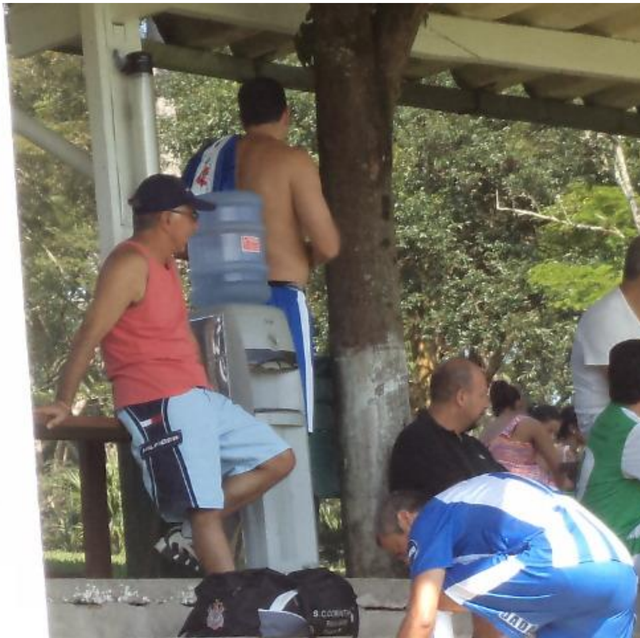
O presidente de olho.