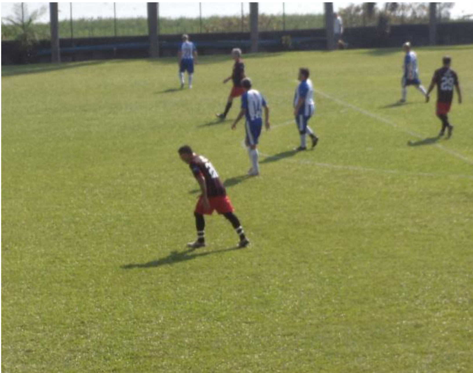
Camisa de listra para os gordinhos não sei se fica muito bem...