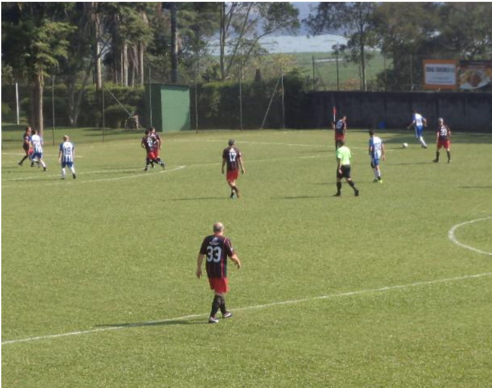
Cruzamento da direita