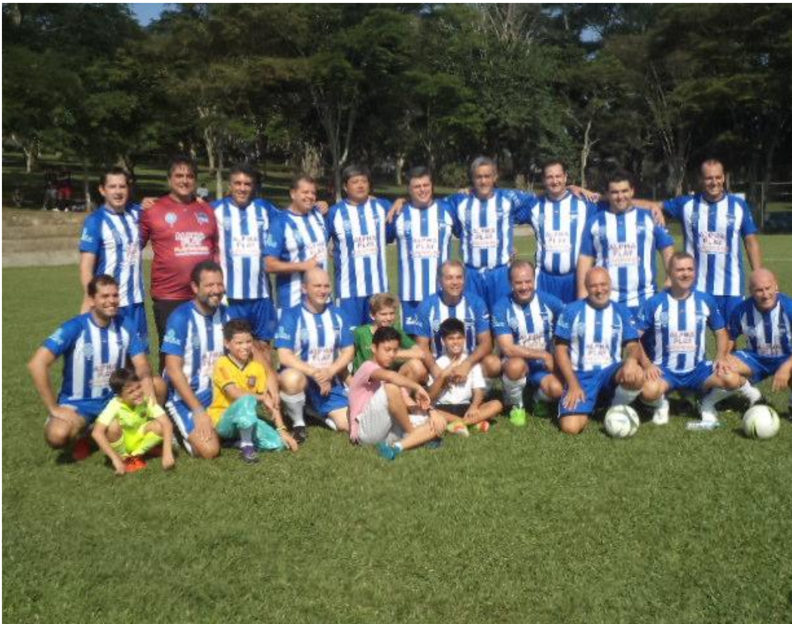
Equipe completa de Berlim.