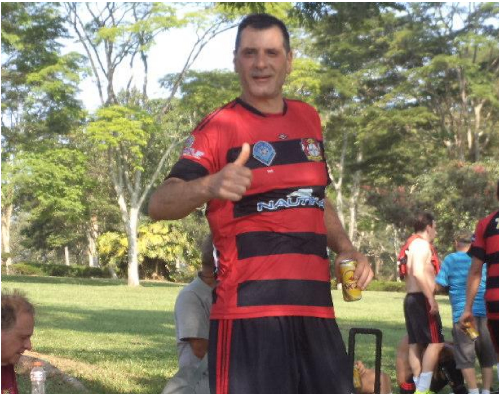
Basso no pós jogo.