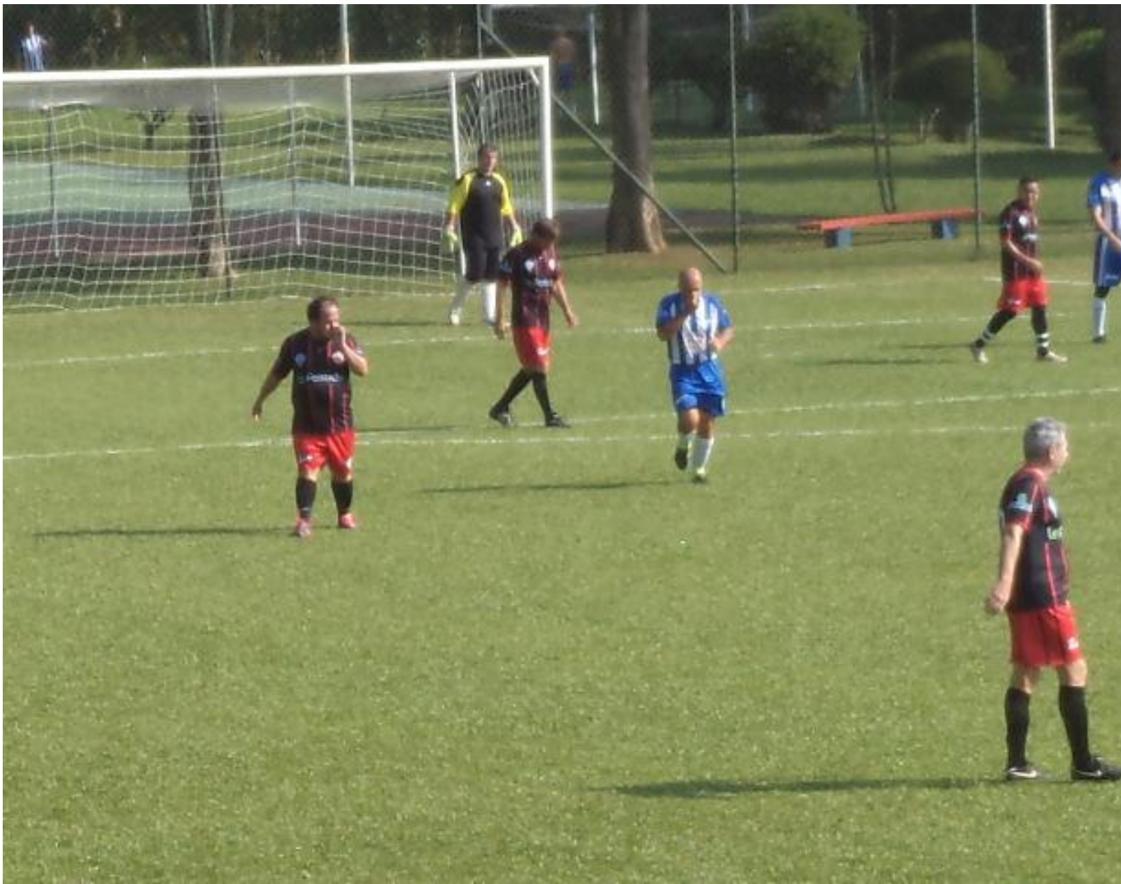
Momento para tirar a “catota”