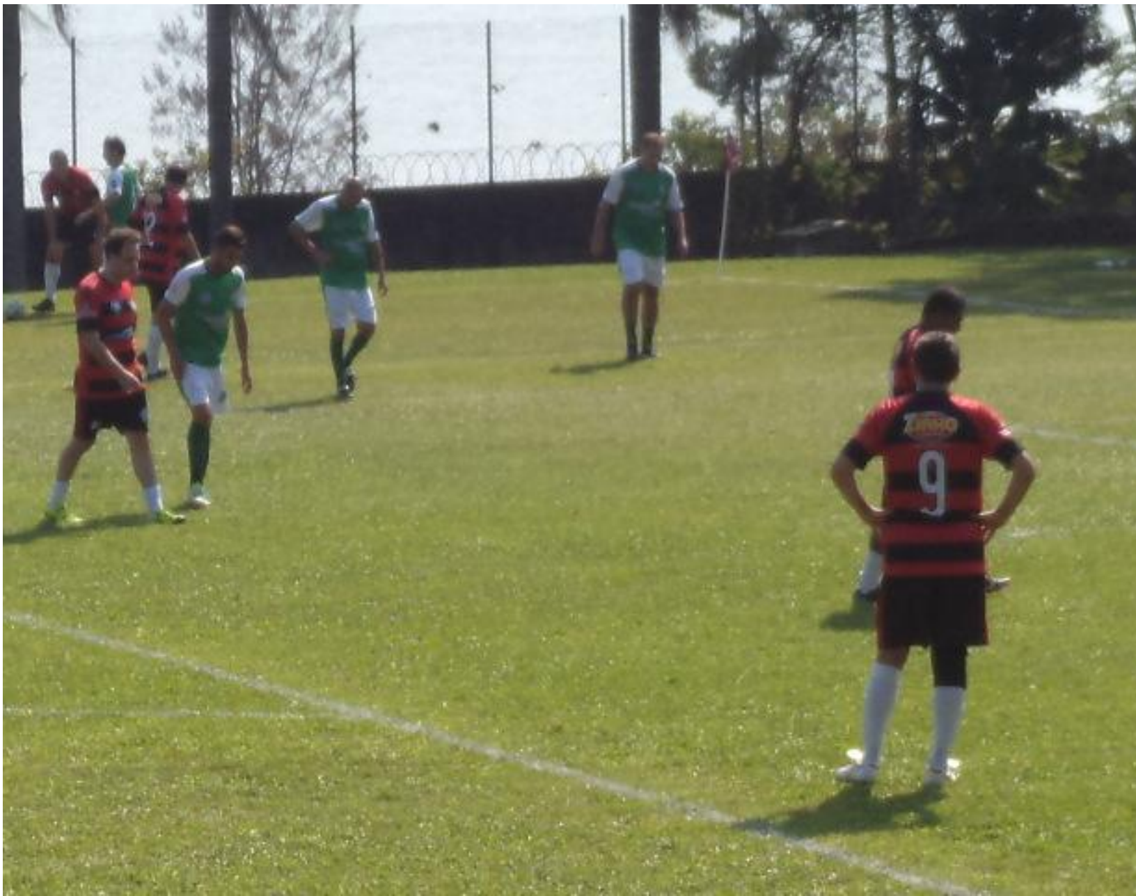
Ai que preguiça