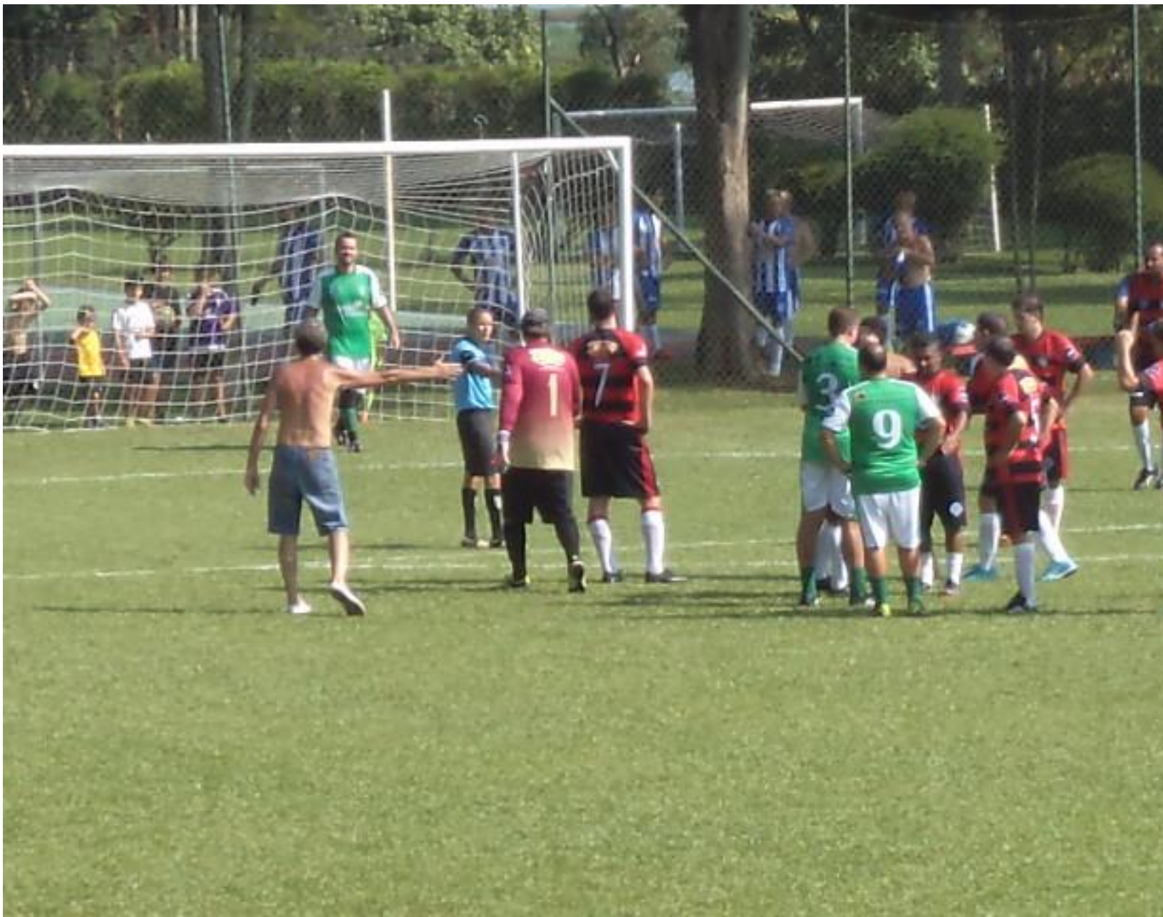
Professor Pipoca também fala.