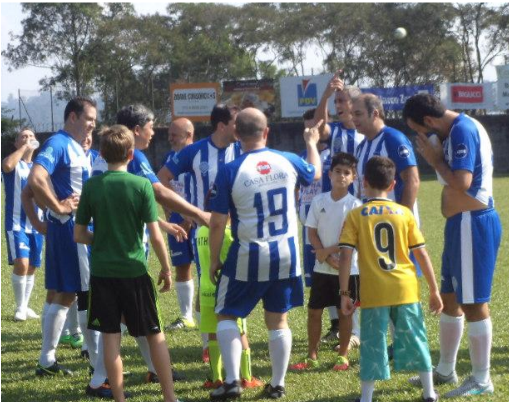
Herta na preleção, a garotada participando.