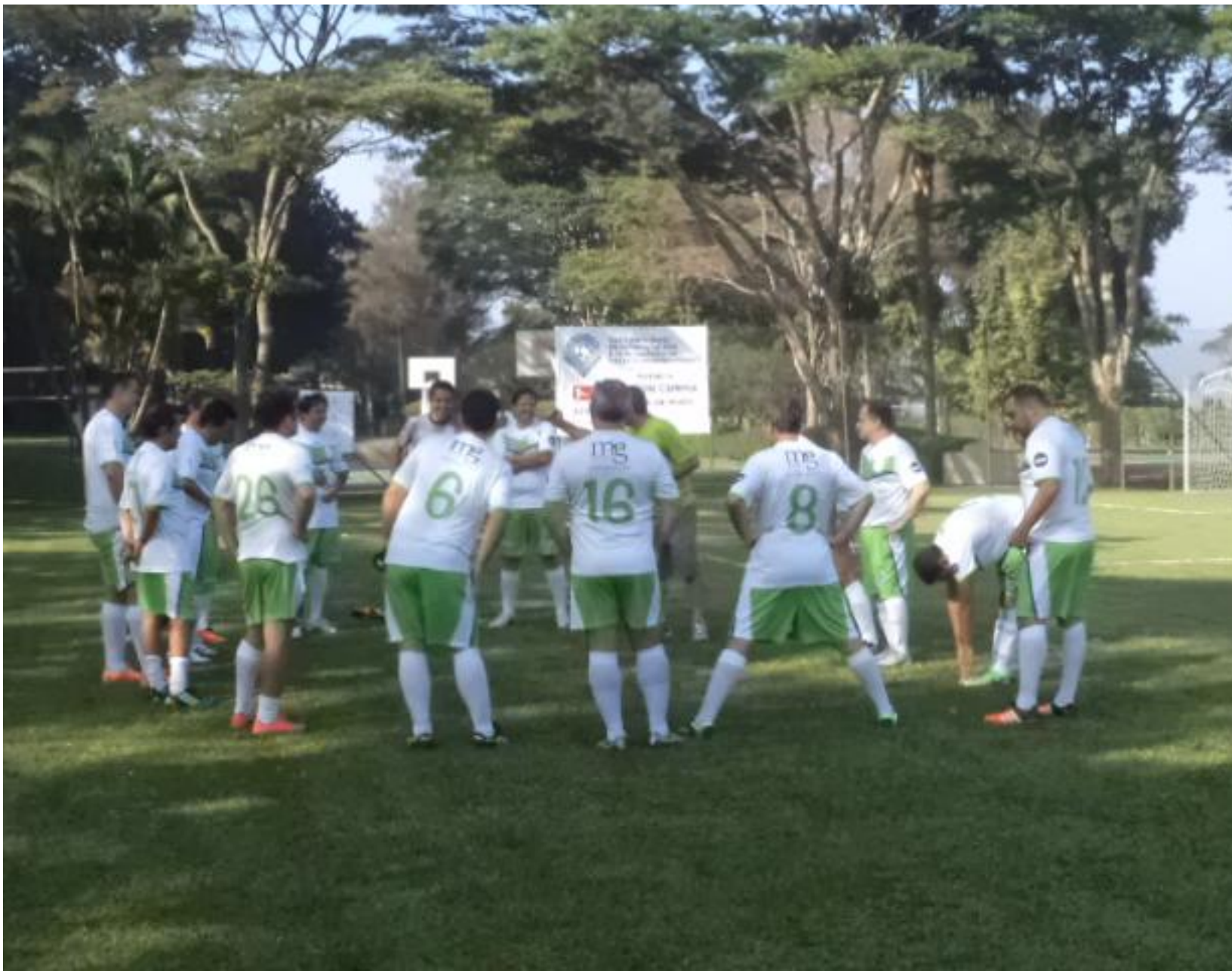
Deste lado parecem mais concentrados.