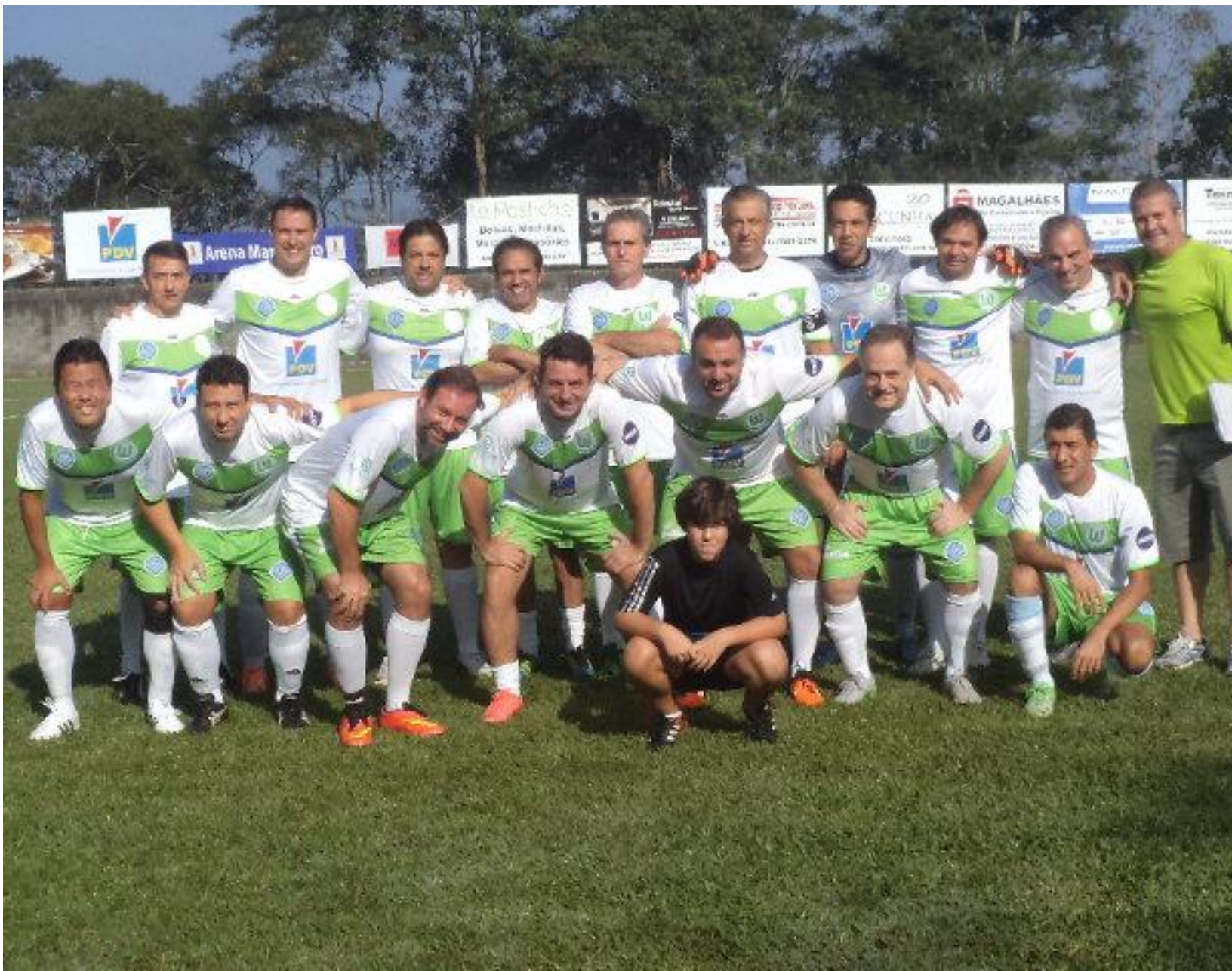
Já do lado dos líderes todo mundo posando.