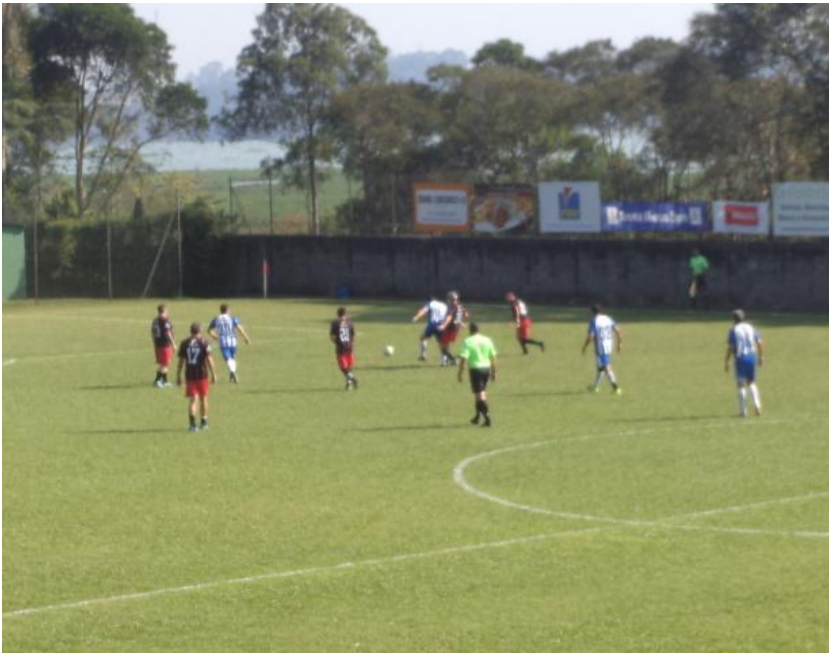
Mais uma chance