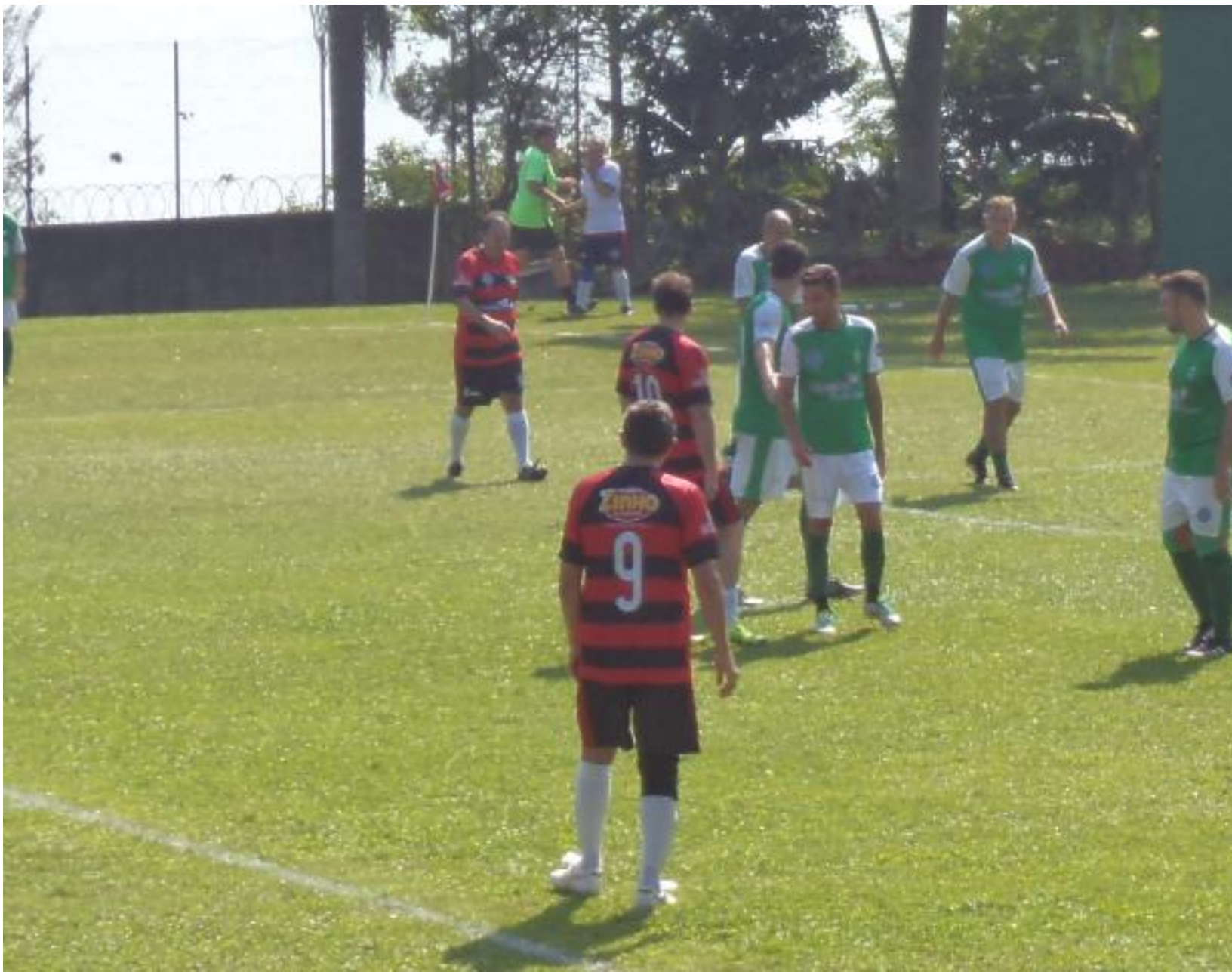
Bachert esperando uma oportunidade