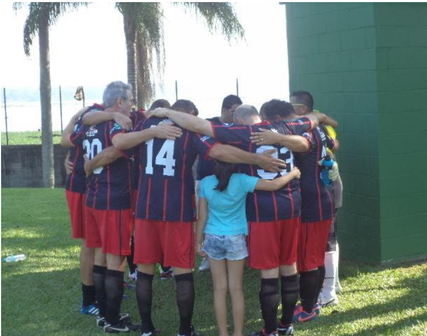
As orações antes do jogo são especiais, momento de união.