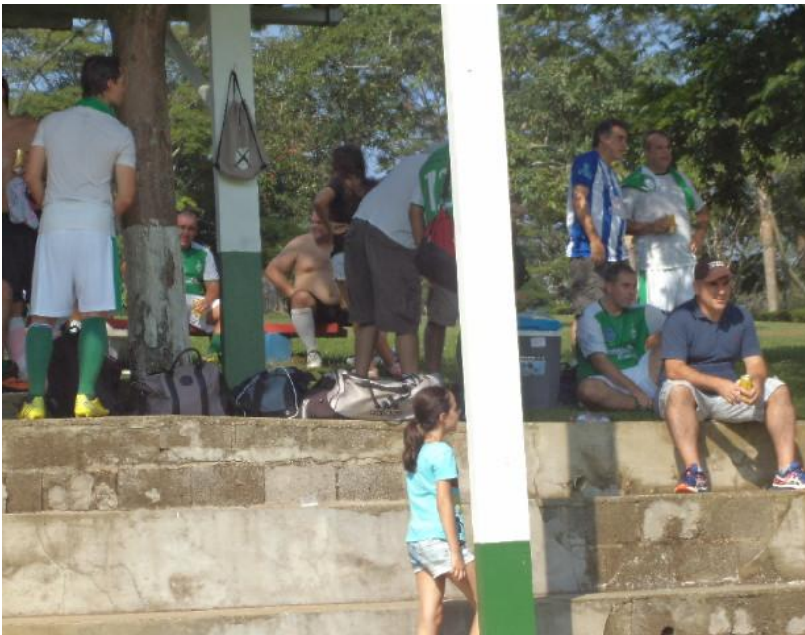
Todo mundo atrás de uma sombra