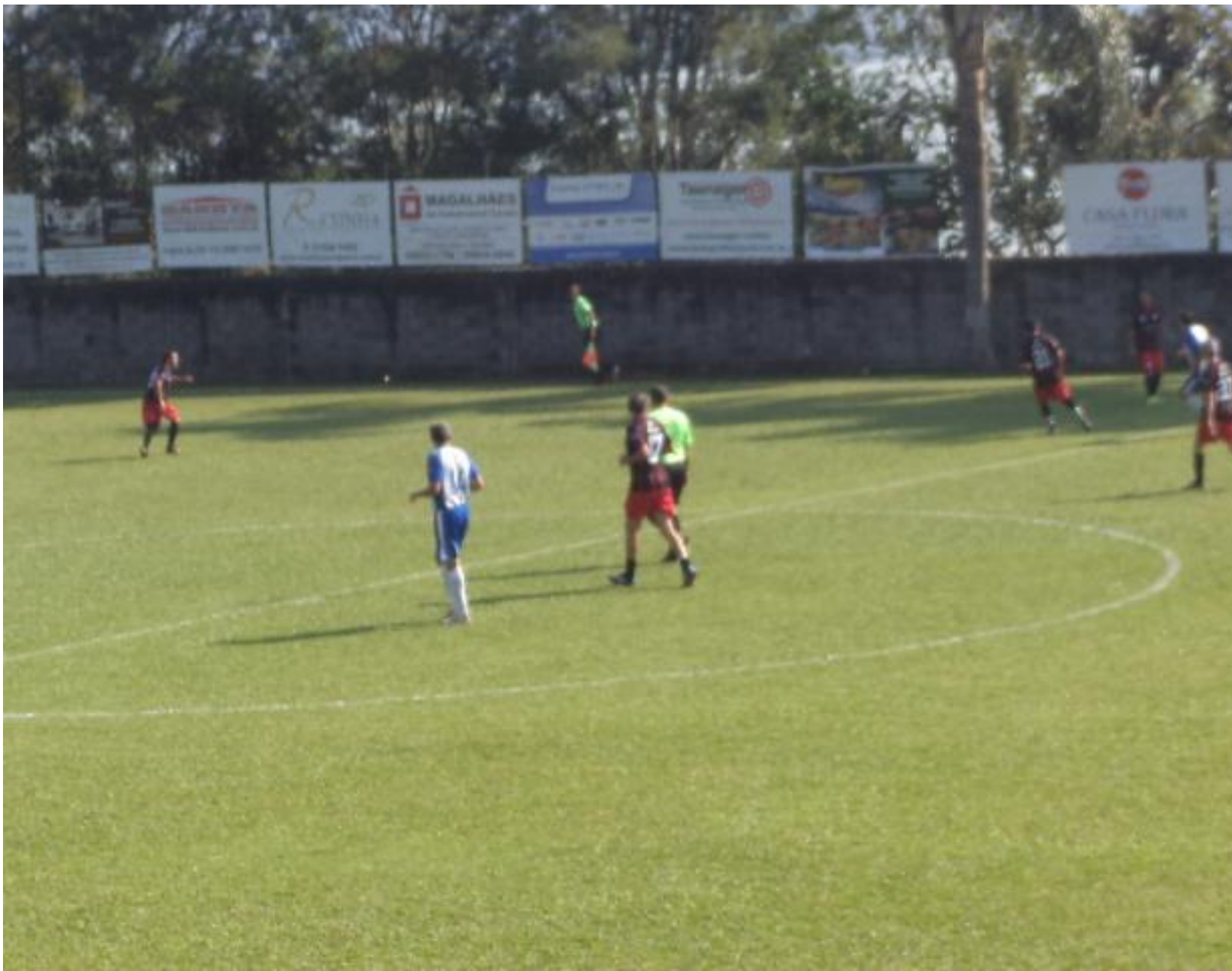
Olha o contra ataque