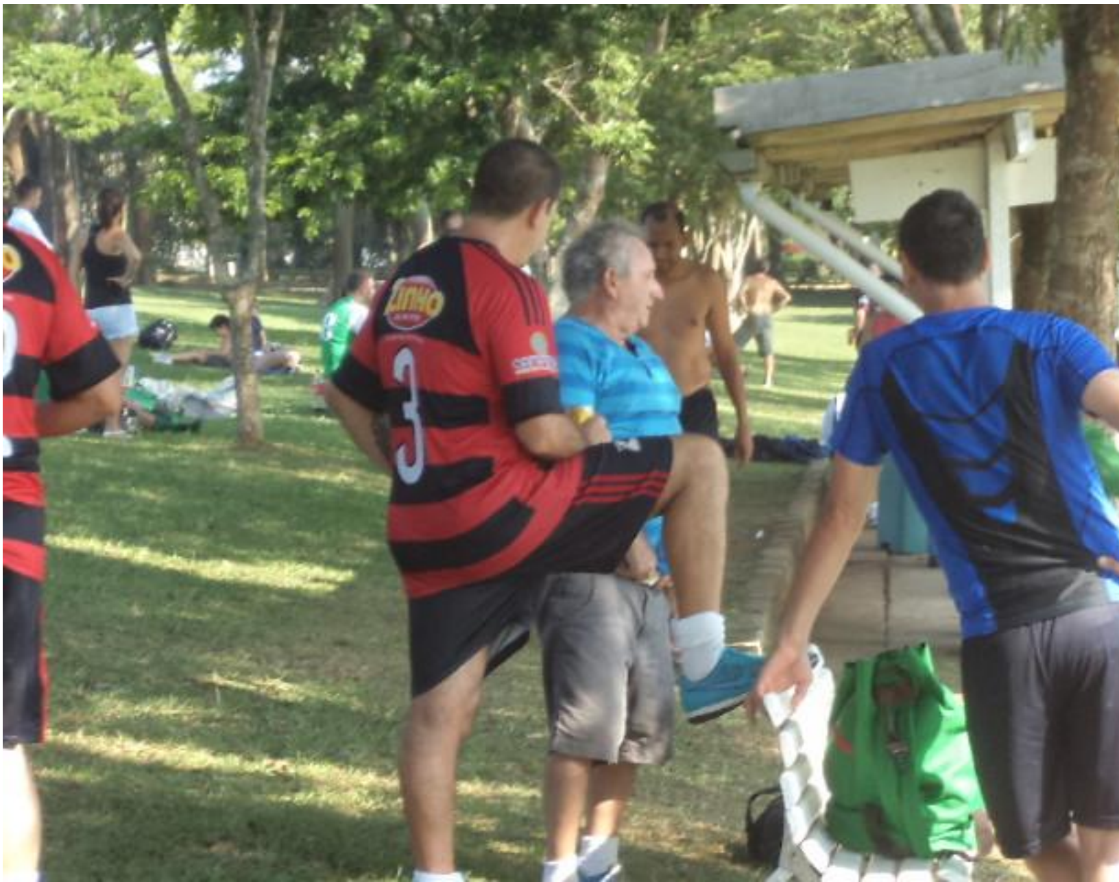
Patané e seus causos.