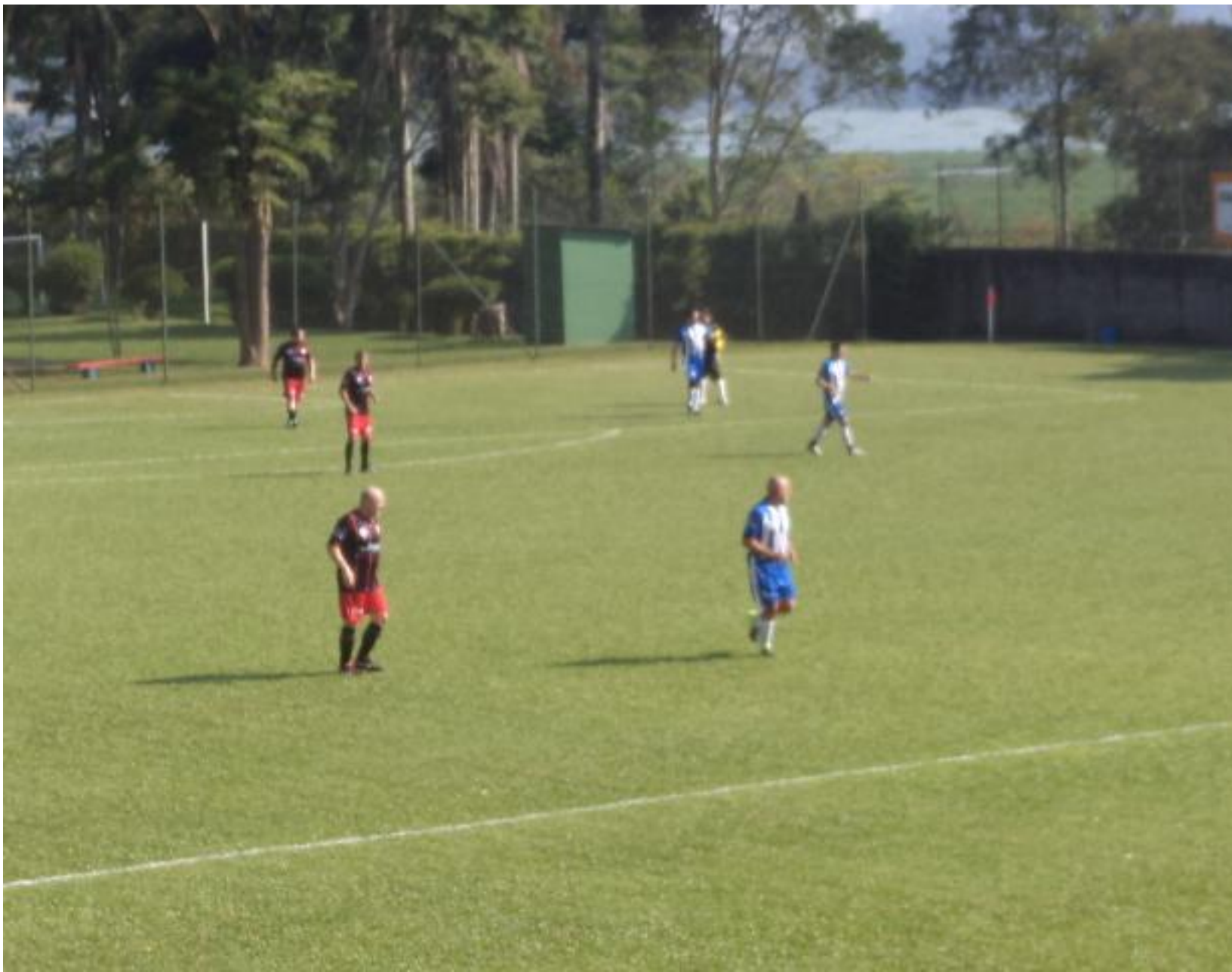
O Didi não tira o olho.