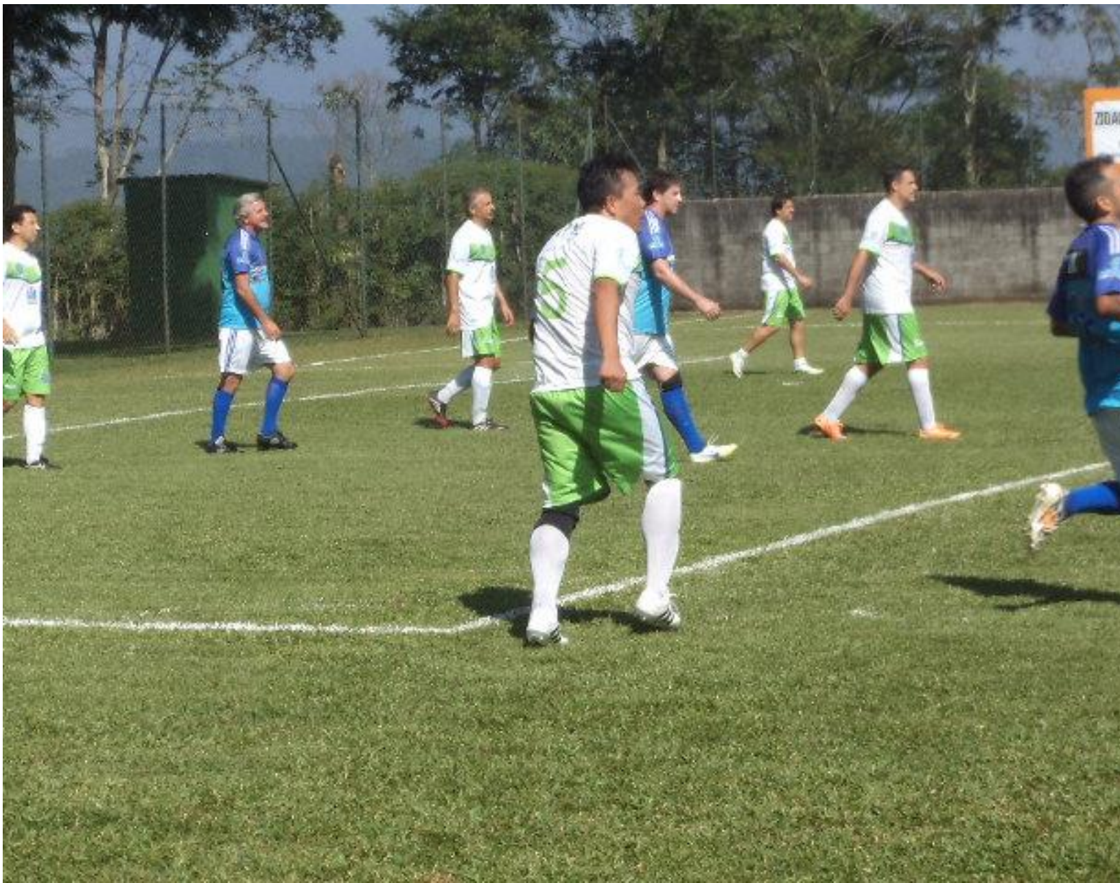
Yoon na proteção, Taborda na correria.