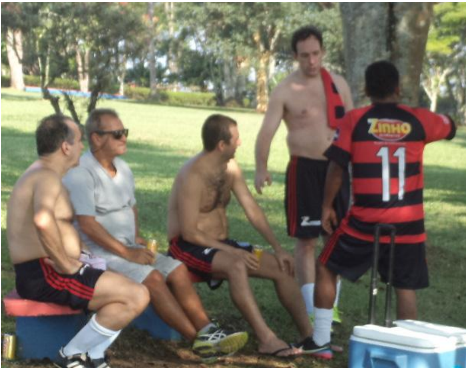
O calor tava terrível