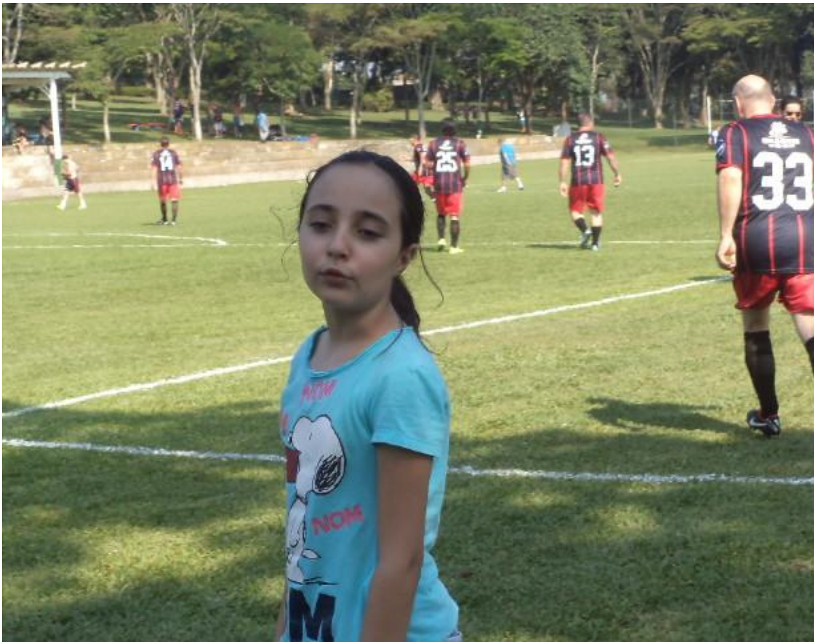
Papai vai jogar e eu venho prestigiar.