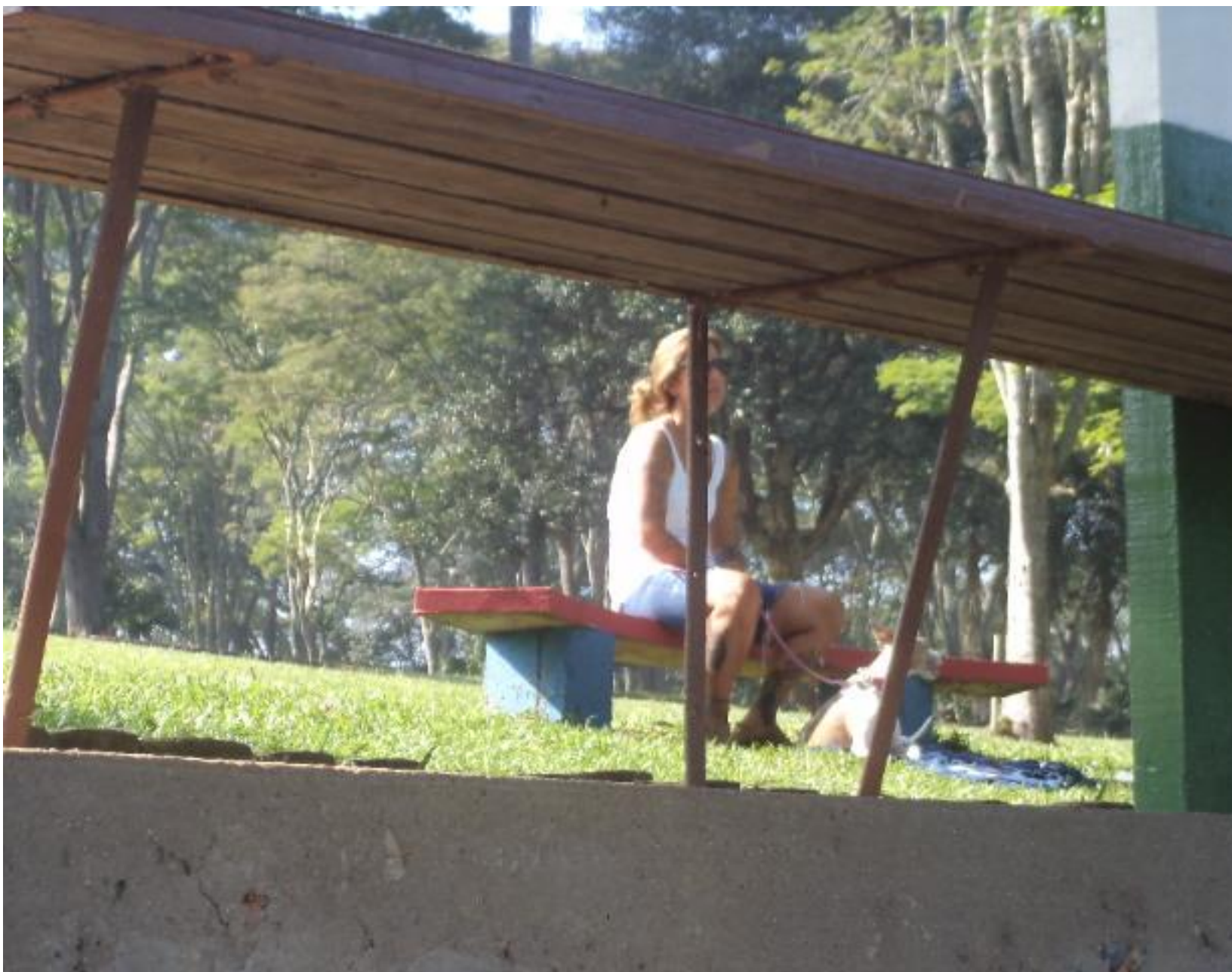
A gatinha e o cachorro.