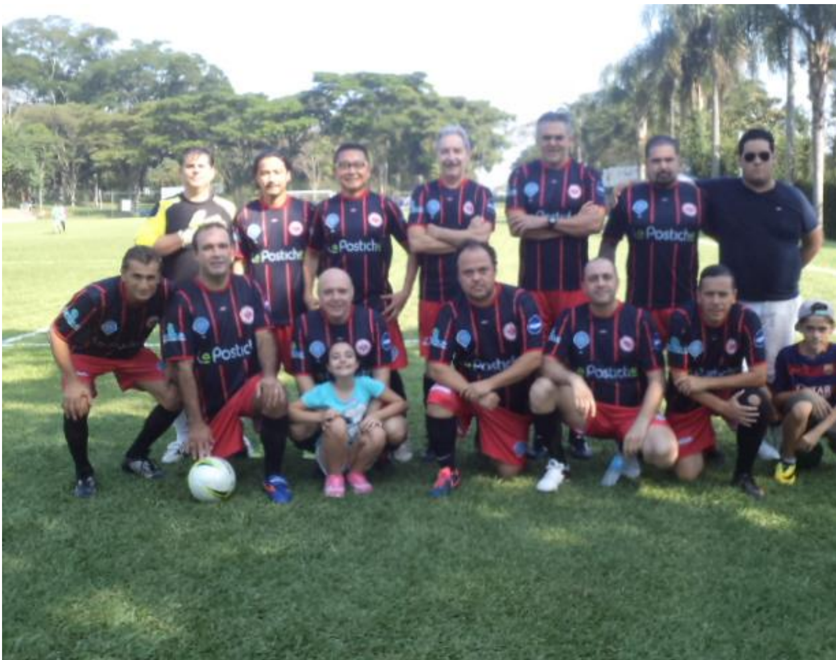
Foto da equipe, com a garotada participando, legal de ver.