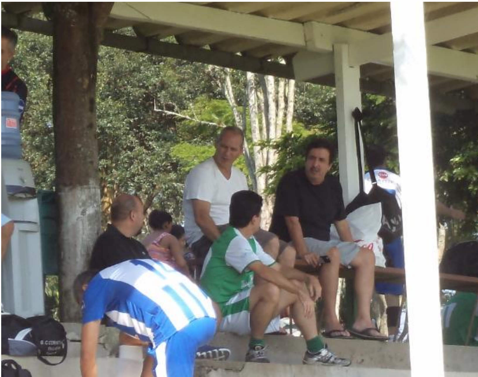
Barranco cheio, bom de se ver.