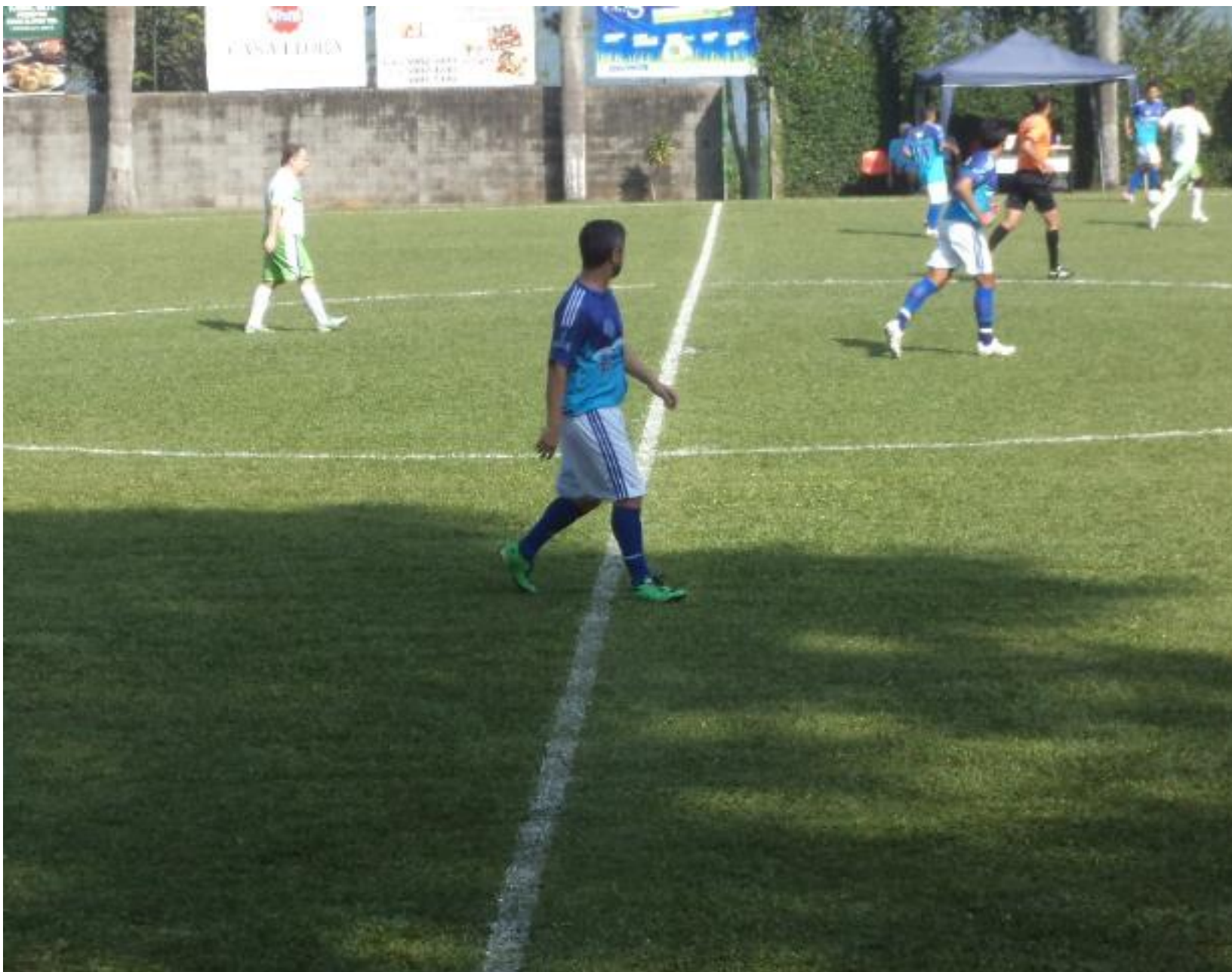
Depois reclama que chamam de chinelinho, só passeia em campo.