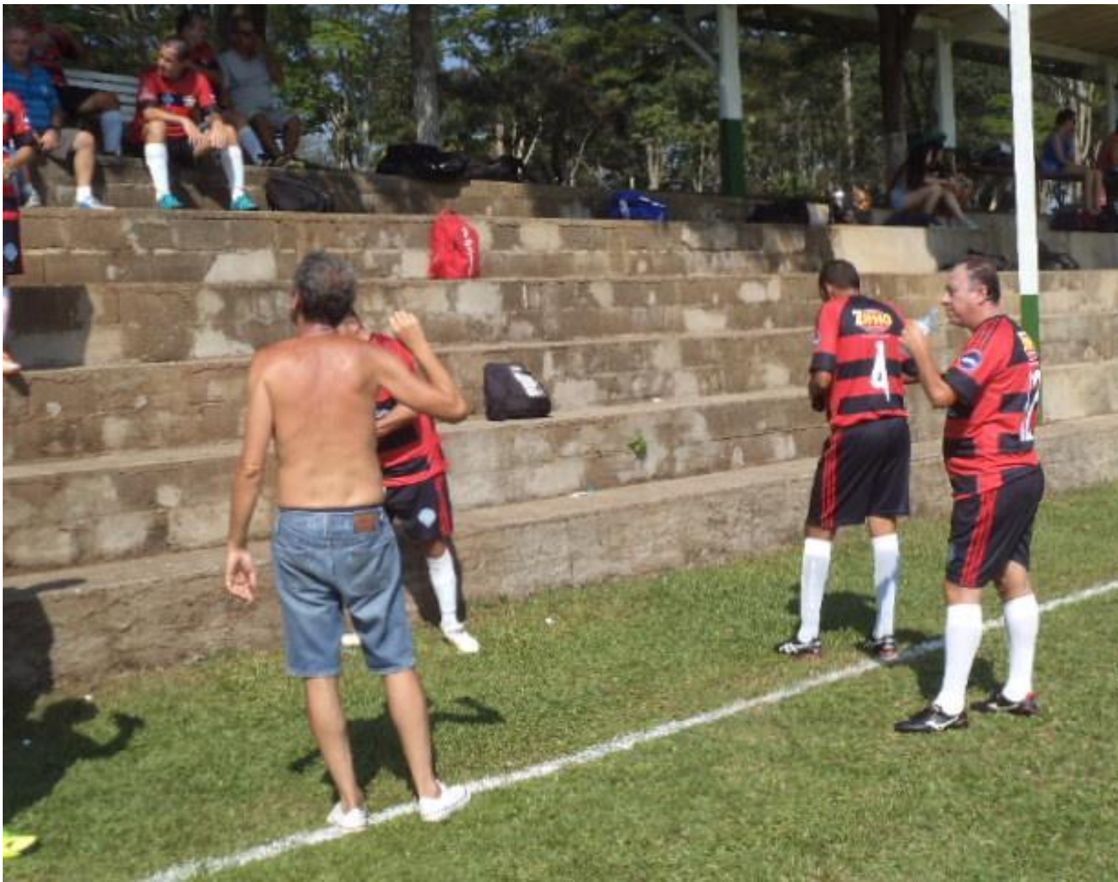
Que sede heim? A noite foi braba ontem...