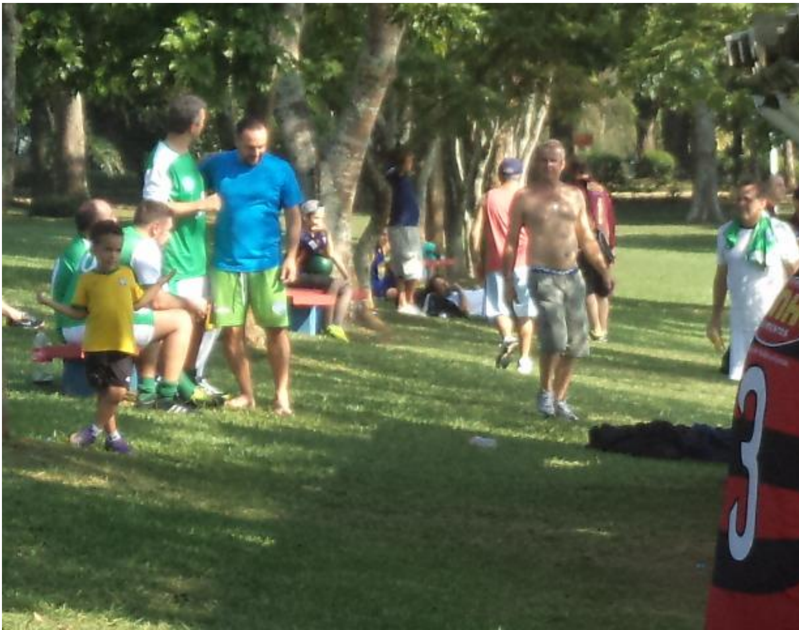
O barranco, pedaço mais divertido da chácara. Põe a camisa aí ôôô