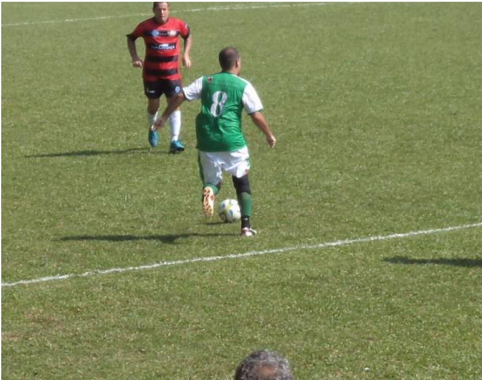
O Leo partindo pra cima