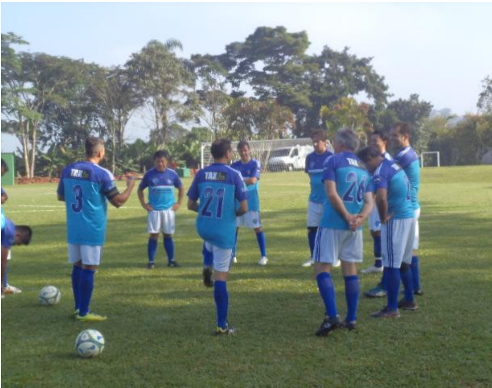
O pofessô ajustando os últimos detalhes...