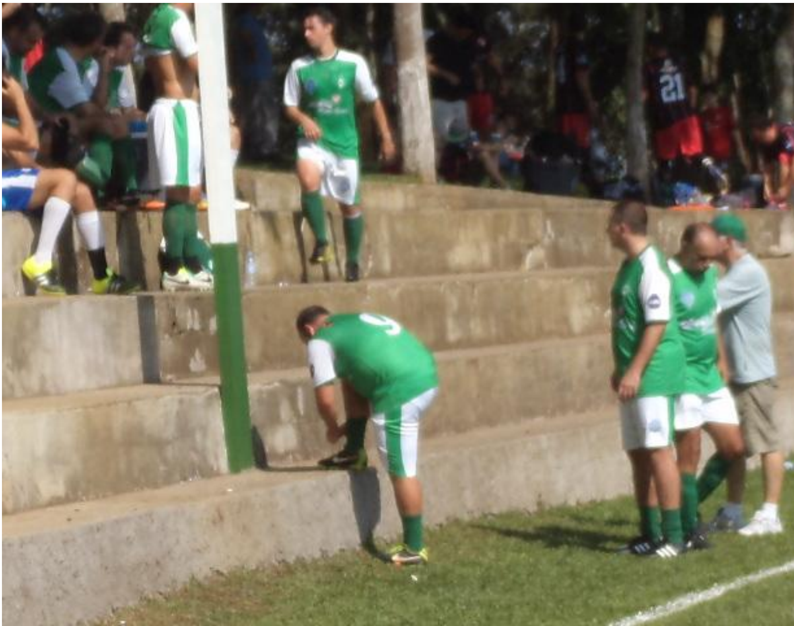
Tá difícil amarrar a chuteira...