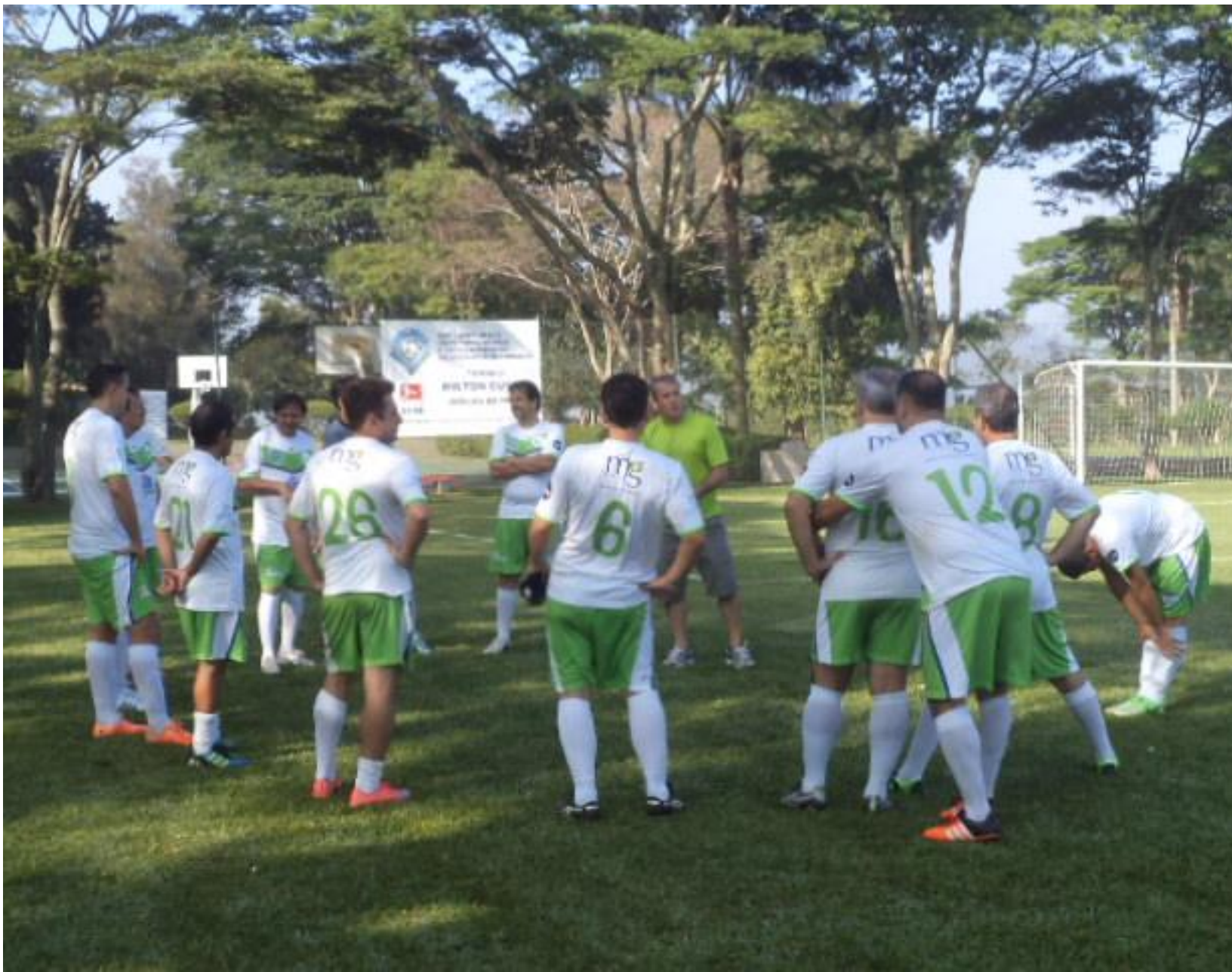
Abrço por trás... Humm, "num gostia"...