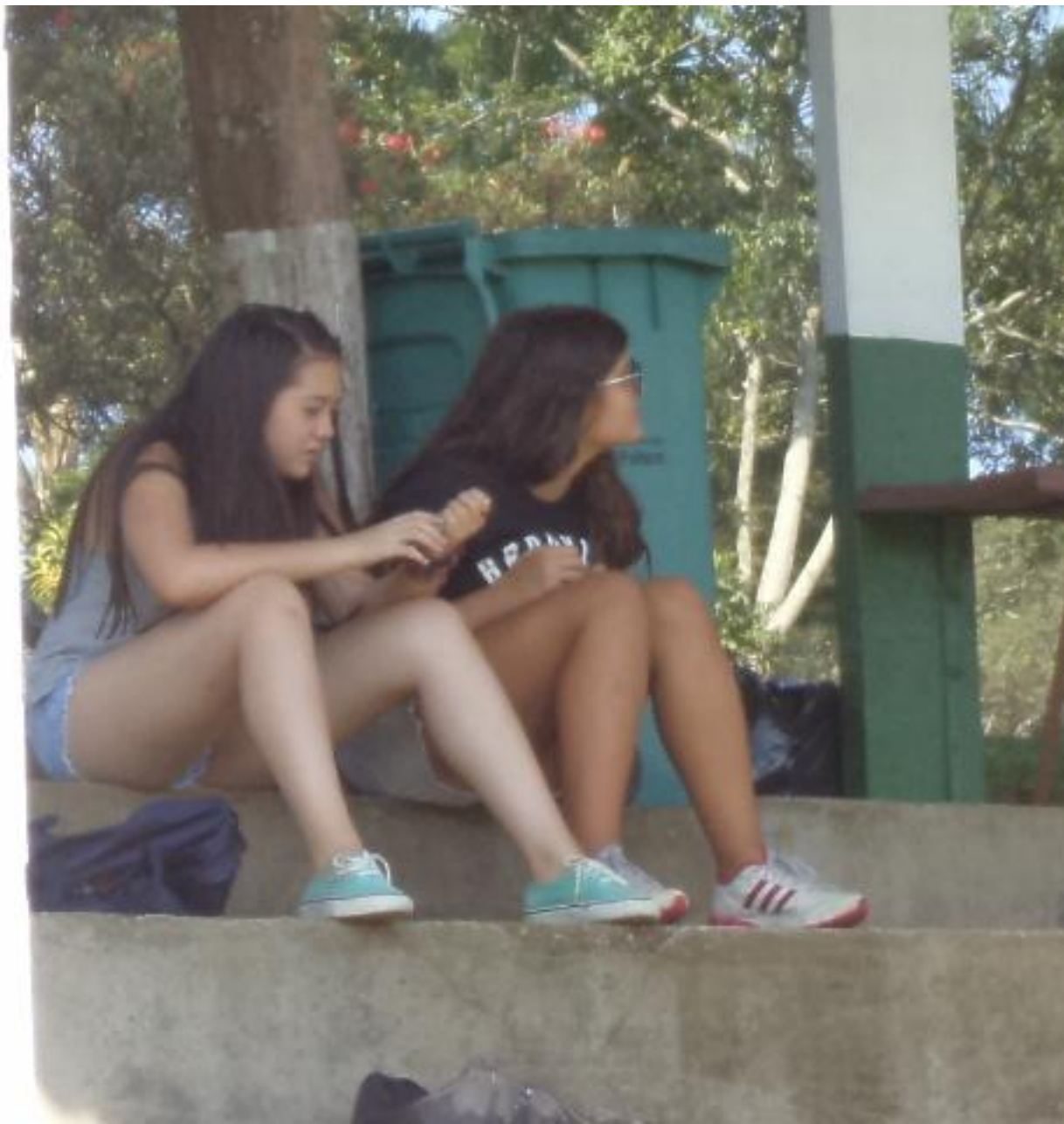
As meninas vieram prestigiar.