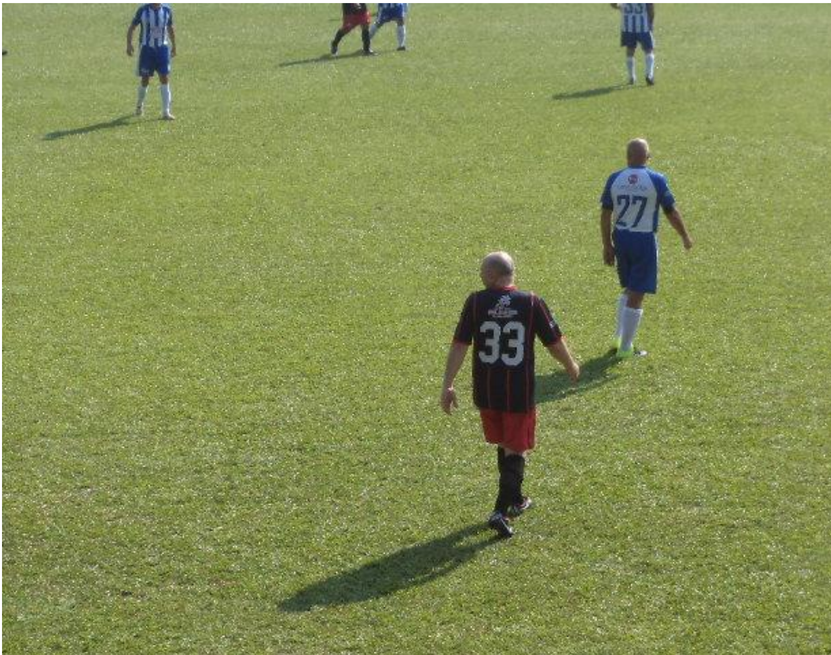
É a terceira foto que aparecem juntos