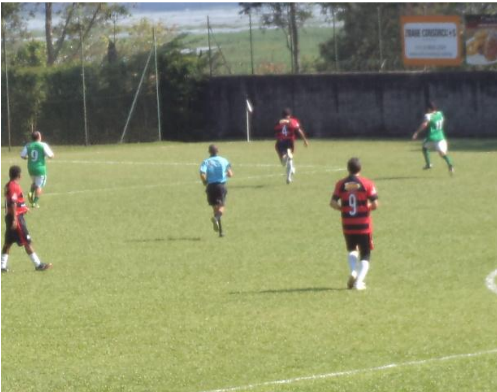
Bola esticada pro Bigucci, correria.