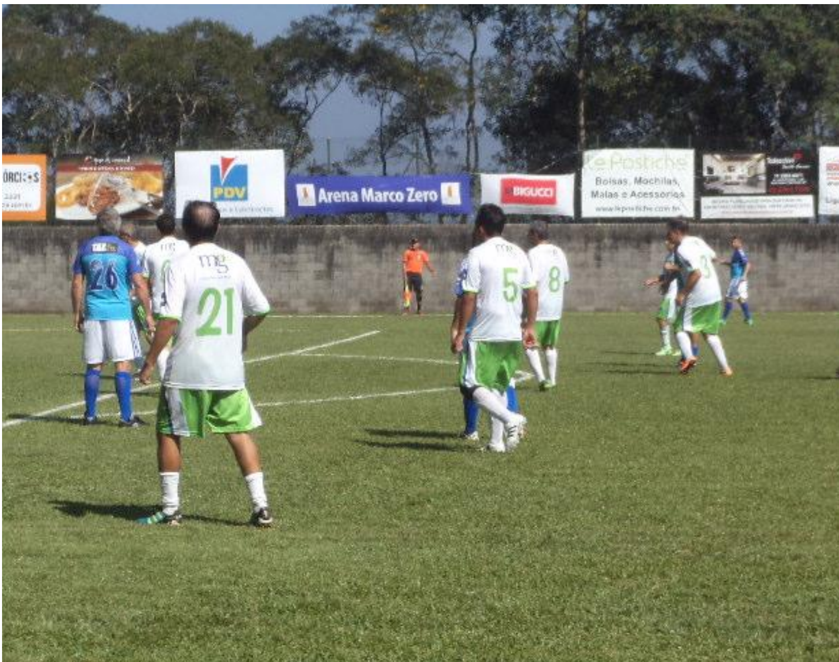
O Doni com penteado de motel, uma entrada, uma saída e F... no meio...